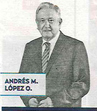
ANDRÉS M. LÓPEZ O.

» Frente a miles de sus seguidores, en lo que fue su último Grito de la Independencia, el presidente Andrés Manuel López Obrador ahora sí bajó el telón de su administración. Emotivo y lleno de aplausos, el tabasqueño inicia la cuenta regresiva para despedirse del movimiento que encabezó. Lo deja en manos de Claudia Sheinbaum, como también lo hace con la plaza que tantas veces llenó, como el principal opositor al régimen.