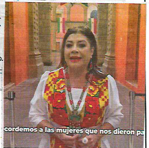
cordemos a las mujeres que nos dieron pa

Estuvieron los titulares de la Sedena y de la Marina.