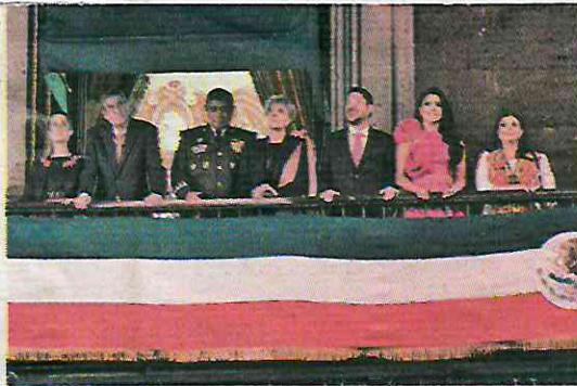
● DE HONOR. Invitados, como Claudia Sheinbaum y Clara Brugada, en el balcón de Palacio Nacional.