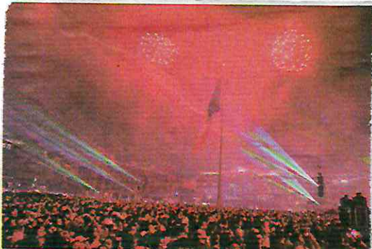
● LUCES. Los fuegos artificiales fueron de lo más aplaudido luego de la ceremonia de El Grito.