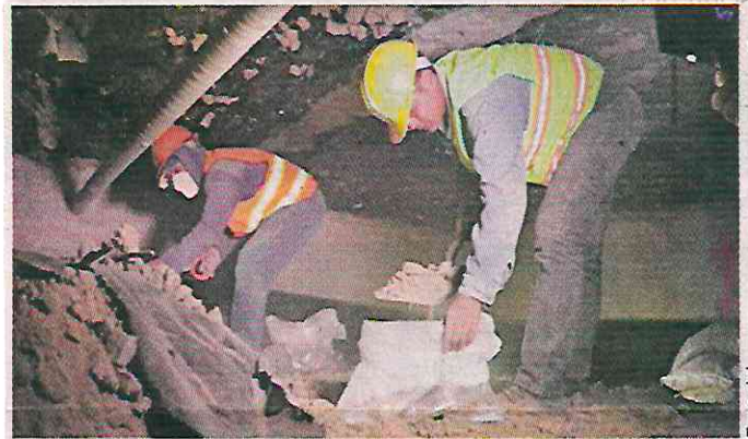
El Gobierno capitalino, bajo el cargo de Claudia Sheinbaum, se hizo cargo de la rehabilitación de la Terminal 2 en 2022.