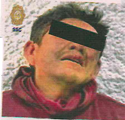
El hombre cuenta con 3 ingresos al Sistema Penitenciario

los uniformados solicitaron los servicios médicos, quienes lo diagnosticaron con hematoma en el ojo, una herida de dos centímetros en la ceja y a descartar fractura nasal, sin ameritar traslado hospitalario. El detenido cuenta con tres ingresos al Sistema Penitenciario de la Ciudad de México por los delitos de Quebrantamiento de sellos en 2022, Robo en 2023 y Robo agravado en pandilla en 2014.