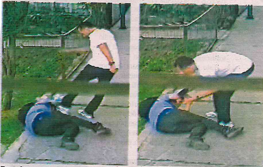
En redes sociales se ve al hombre cómo le da una golpiza al jovencito para despojarlo de sus pertenencias

DETIENEN AL ASALTANTE QUE GOLPEÓ A ESTUDIANTE AFUERA DE LA UAM XOCHIMILCO