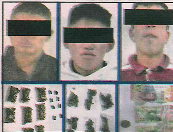
Elementos de la Secretaría de Seguridad Ciudadana atraparon a tres narcomenudistas

Con la finalidad de descartar cualquier hecho delictivo, les marcaron el