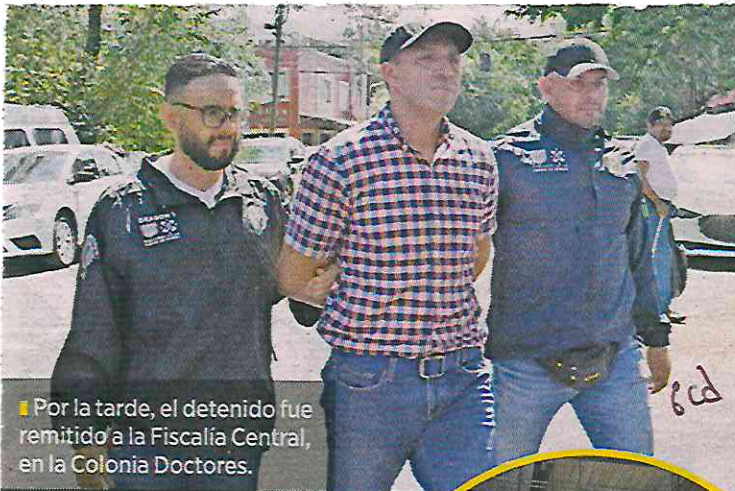
Por la tarde, el detenido fue remitido a la Fiscalía Central, en la Colonia Doctores.