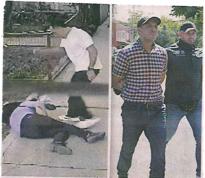
El hombre, quien aparece en un video asaltando con violencia, fue remitido a la Fiscalía Central, en la Colonia Doctores.

Por la tarde, policías de Inteligencia de la SSC lo trasladaron a la Fiscalía de Investigación Estratégica Central, en la Colonia Doctores, Alcaldía Cuauhtémoc, donde se definirá su situación jurídica.