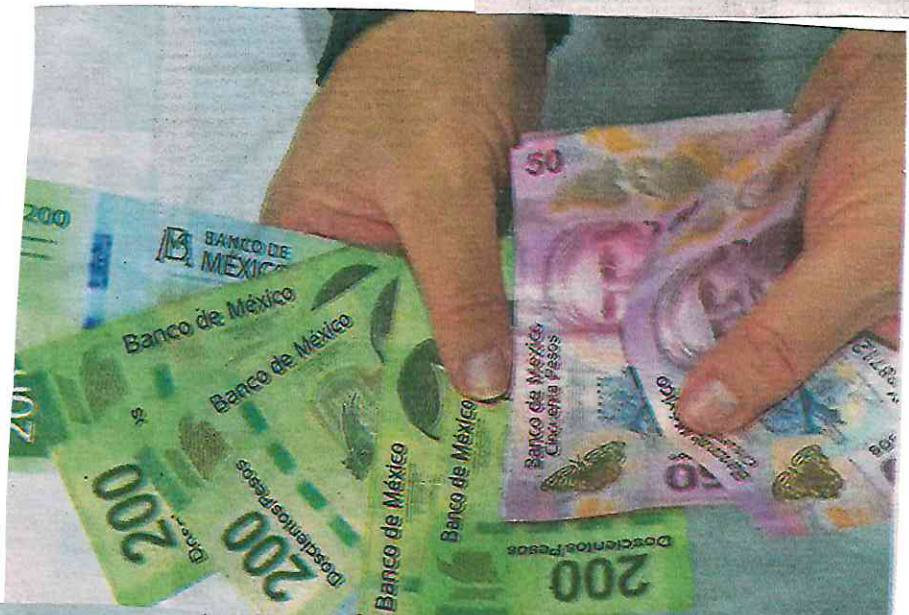
En México, el código penal federal señala este delito, pero no tiene el nombre de usura, sino que lo menciona como una manera de fraude