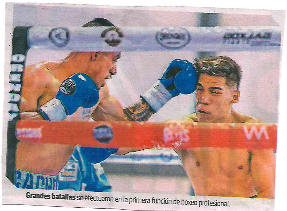
Grandes batallas se efectuaron en la primera función de boxeo profesional.

También Christian, de peso wélter; Ángel y Juan ambos de súper ligero, así como Gustavo, de súper pluma, obtuvieron su licencia para ser parte del profesionalismo con la esperanza de que el deporte les pueda dar una segunda oportunidad en la sociedad.