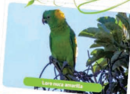
Loro naca amarilla