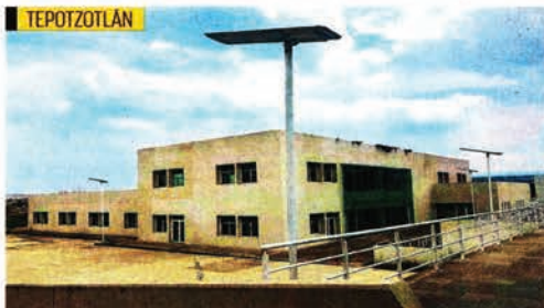
La unidad de Santiago Cuauhtlán, en Tepetzotlán, lleva un avance de 52%. Los pobladores esperan que se concluya su edificación para recibir servicios públicos, pues muchas veces recorren a centros privados o deben desplazarse a otras comunidades.