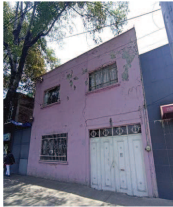
Inmueble del litigio.

Dos días después de que este diario exhibió presuntas pruebas fabricadas y alteradas por la Fiscalía capitalina en un caso de despojo en la colonia Nativitas de la alcaldía Benito Juárez, el Poder Judicial decidió cancelar la audiencia que se celebraría el 17 del presente mes, en la cual, se determinaría si las presuntas imputadas deberían de continuar su proceso en prisión, a pesar de que en ningún momento tuvieron la oportunidad de presentar pruebas en su defensa, además de haber sido objeto de alteraciones en los hechos.