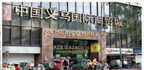
2 IZAZAGA 89. México Mart. "Ciudad de Comercio Internacional de Yiwu, China".

Este inmueble es pionero en la venta de miles de productos traídos desde China. El edificio no parece tener