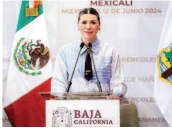
La mandataria estatal en el anuncio de la campaña Verano Seguro para hacer frente a las altas temperaturas.

Con dicha estrategia se ha logrado atender a cerca de cinco mil ciudadanas y ciudadanos que se acercan a recibir diversas consultas y acciones de salud preventiva en estos módulos que se encuentran en todo el estado.