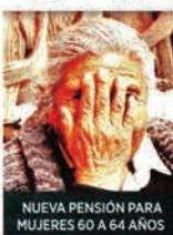
NUEVA PENSIÓN PARA MUJERES 60 A 64 AÑOS