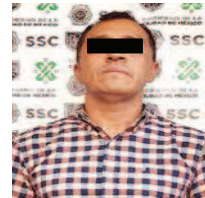
A Juan Carlos “N” se le liga con un grupo dedicado al narcomenudeo.

La Secretaría de Seguridad Ciudadana de la Ciudad de México (SSC) abrió una