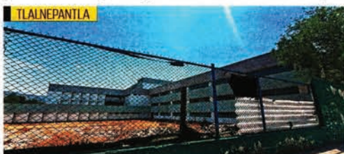
El progreso en las obras del Hospital General Valle Ceylán, en Tlalnepantla, es de 73%. Por la tardanza en la construcción, algunos de los habitantes lo llaman “elefante blanco”.