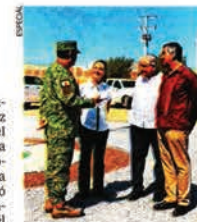
Durante su gira, Claudia Sheinbaum y López Obrador visitaron la nueva sede de aduanas.

Al llegar a supervisar, en compañía del presidente López Obrador, las instalaciones del nuevo Hospital Regional de Alta Especialidad ISSSTE en Torreón, Coahuila, la próxima mandataria de México detalló que en la gira que realizan ambos ha podido platicar con él acerca de las obras y las acciones que se están haciendo y están pendientes de concluir. ●