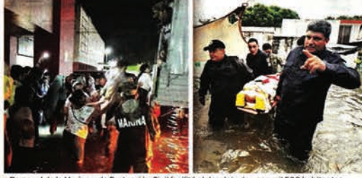
Personal de la Marina y de Protección Civil facilitó el desalojo de unos mil 500 habitantes.

La Guardia Nacional y el Ejército activaron un plan de auxilio a la población, mientras que la Gobernadora de