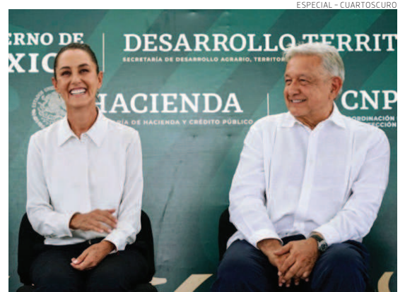
AMLO y Claudia Sheinbaum, durante su visita en Tamaulipas.

En esta escala por Tamaulipas, Sheinbaum y AMLO estuvieron acompañados además