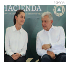
Sheinbaum y AMLO, de gira.

Fluidez. Este sábado la presidenta electa, Claudia Sheinbaum, acompañó al mandatario Andrés Manuel López Obrador a Tamaulipas, donde supervisaron la nueva sede de la Agencia Nacional de Aduanas en Nuevo Laredo. Sheinbaum dijo que confía en que esta nueva sede ayudará a mejorar el comercio y acabar con la corrupción. PAG 5