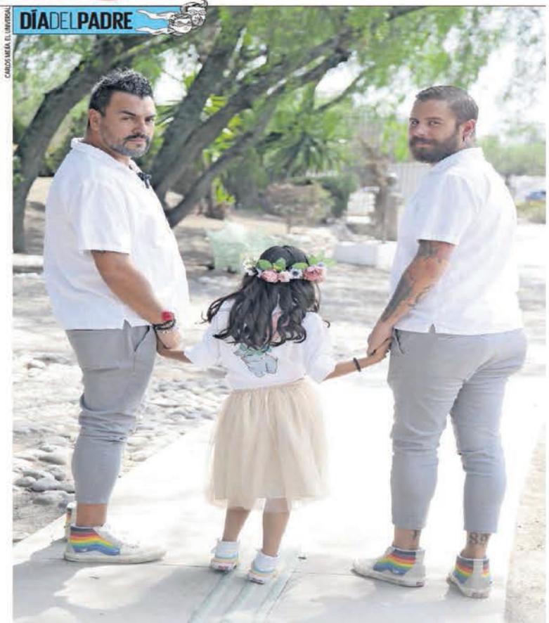
DÍA DEL PADRE