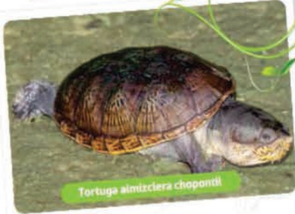
Tortuga almizclera chopontli