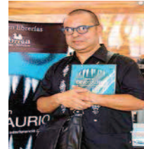
Fundador de la organización 1000 Pelotas para ti.