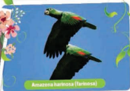
Amazona harinosa (farinosa)