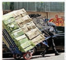
Decenas de cargadores llevan mercancía a las plazas.

A 400 metros de distancia está la Plaza de Izazaga 38, un edificio de 12 pisos sa-