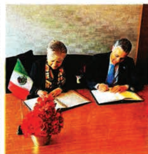
La canciller Alicia Bárcena informó que firmó un acuerdo de México con el gobierno de Suiza.

México presentó en abril una demanda contra Ecuador ante la Corte Internacional de Justicia en la que solicitó la suspensión de ese país de Naciones Unidas hasta que ofrezca una disculpa por sus actos, que consideró una “violación flagrante” al derecho internacional.