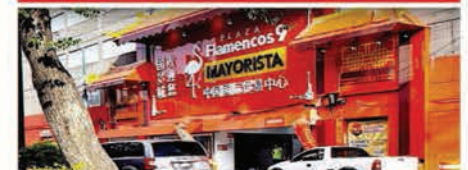
4 FLAMENCOS 9. "Centro de Comercio Internacional de China".

plenas condiciones de seguridad. Antes albergaba oficinas de la Tesorería de la Ciudad de México y de SACMEX.