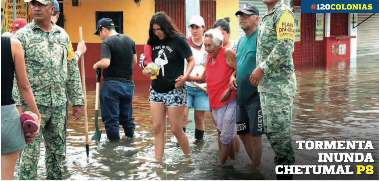
TORMENTA INUNDA CHETUMAL P8