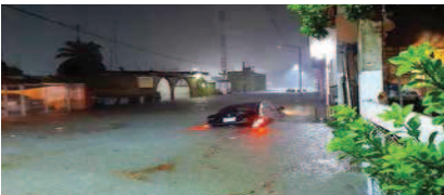
Colonias enteras de Chetumal amanecieron anegadas; al bajar el nivel del agua, autoridades iniciaron trabajos de desahozte.

que abastecen al Sistema Cutzamala, por lo que se espera una recuperación importante en sus niveles de almacenamiento. Actualmente, el sistema cuenta con 209 millones 661 mil metros cúbicos de agua; el llamado Día Cero será cuando tenga 155 millones de metros cúbicos y ya no pueda bombear agua hacia el Valle de México. En tanto, cientos de casas en Chetumal, Quintana Roo, amanecieron inundadas por las fuertes lluvias registradas en la madrugada de ayer, por lo que la Guardia Nacional y el Ejército activaron