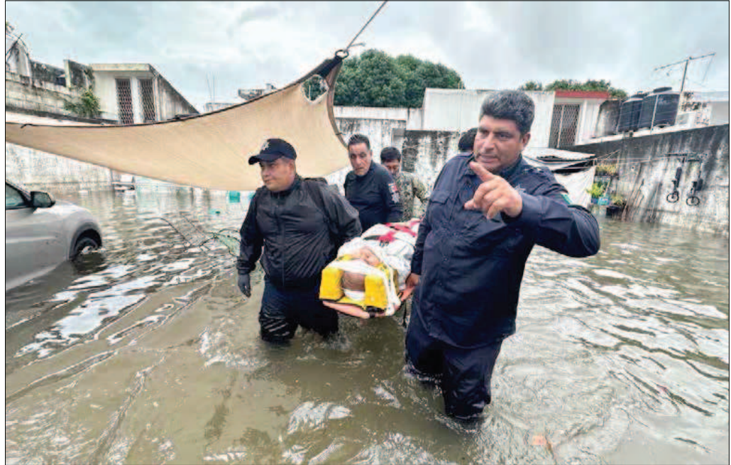
▲ La capital de Quintana Roo tuvo inundaciones hasta de 1.20 metros en algunas zonas por una intensa precipitación pluvial la noche del viernes y madrugada del sábado. Hubo unas mil 500 personas rescatadas y fueron habilitados tres refugios temporales. En Chiapas, Tamaulipas y Oaxaca declararon la alerta naranja por pronósticos de lluvias torrenciales. En tanto, Saúl Arciniega, especialista de la UNAM, explicó que la sequía es un fenómeno natural cíclico que ocurre tanto en regiones secas como húmedas. Preciso que en los recientes 14 años las más severas en el país fueron en 2011 y 2012. PATRICIA VÁZQUEZ Y VÍCTOR BALLINAS / P 20 Y 27