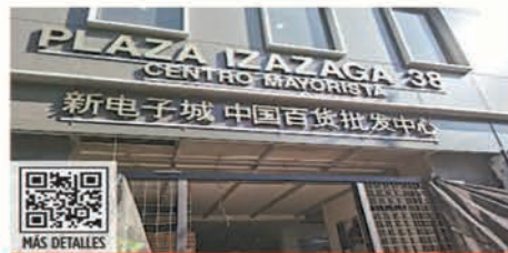
1 IZAZAGA 38. "Nuevo Centro Mayorista de Grandes Almacenes de Electronic City, China".

"Además, al final de cuentas, nunca quedó claro qué ofrecíamos, cuál era el perfil de Xóchitl Gálvez, qué representaba, qué ofrecía".