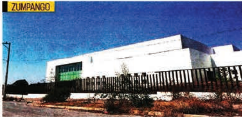
El hospital de San Juan Zitlaltepec, en Zumpango, reporta un avance de 45%. Este proyecto ha sido polémico, pues de acuerdo con vecinos, las tierras en donde se construye eran ejidales y no hay certeza de la compraventa.

El proyecto fue contemplado en la zona oriente del municipio, en la zona de Caracoles, debido al cierre