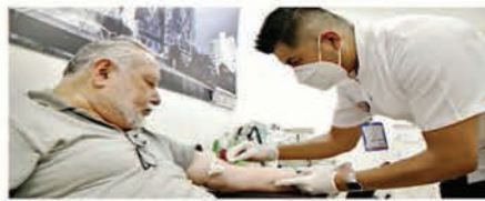
La Clínica de Geriatría Iztacalco atendió a 8 mil 257 personas.

“Este tipo de violencia constituye una violación de los Derechos Humanos y puede manifestarse en forma de maltrato físico, sexual, psicológico o emocional; económico o patrimonial, negligencia y abandono,