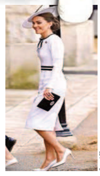
CELEBRA A CARLOS III