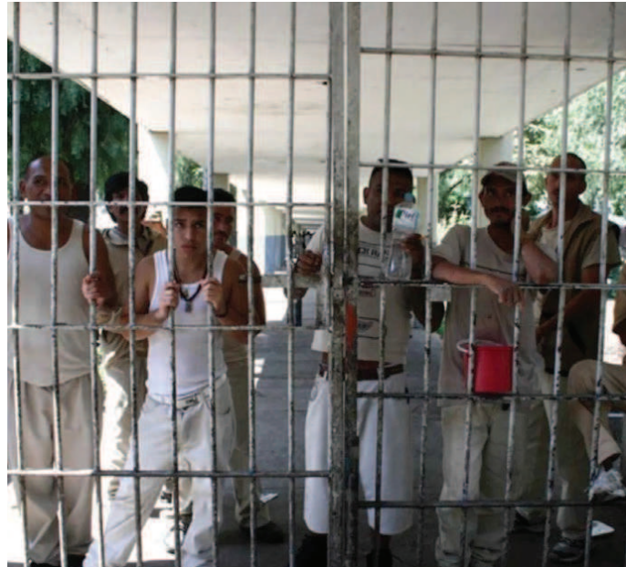
El Presidente de la República podrá exonerar de manera directa a presos que ayuden a esclarecer delitos importantes.

El cambio oficializado en el decreto publicado añade el artículo 9 en el que se establece que “Por determinación exclusiva de la persona titular del Poder Ejecutivo federal se podrá otorgar el beneficio de la amnistía de manera directa, sin sujetarse al procedimiento establecido en este ordenamiento”.