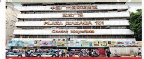
3 IZAZAGA 151. "Ciudad de Comercio Internacional de Guangzhou, China".