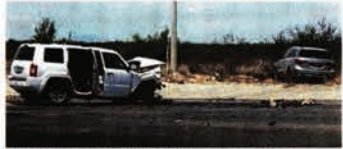
Un vehículo de la comitiva de Sheinbaum se impactó el viernes con una camioneta particular.

MONCLOVA.- La Jeep Patriot de color blanco, en la que murió una mujer que viajaba en el asiento de copiloto, fue la que impactó de frente el viernes a la camioneta Acura gris con placas de Nuevo León que transportaba al equipo de logística de la virtual Presidenta electa, Claudia Sheinbaum, señalan ayer fuentes policíacas.