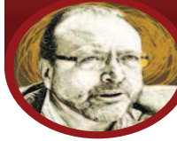
Ilustración: Jesús Sienitz

La nueva novela de William Ospina es sobre un personaje clave de la Segunda Guerra Mundial. / 18