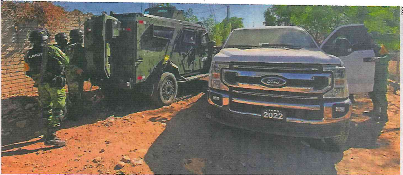
Integrantes del Ejército Mexicano resguardan la zona donde se logró la captura de Ovidio Guzmán, hijo de El Chapo , el 5 de enero de 2023 en Culiacán, Sinaloa.