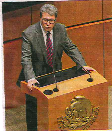
Ricardo Monreal, senador de Morena