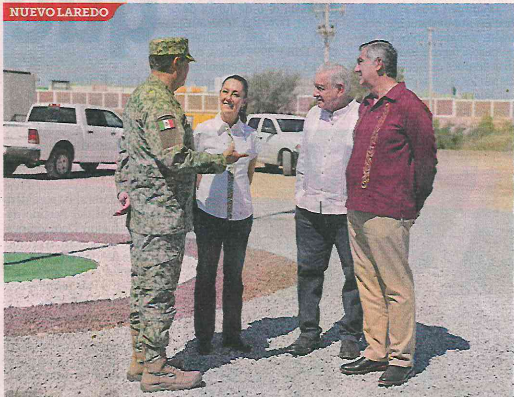
Sheinbaum realizó una visita junto con AMLO, el titular de la Sedena, Luis Crescencio Sandoval, y el Gobernador de Tamaulipas, Américo Villarreal, a la sede la Agencia Nacional de Aduanas.

impresionante que nos va a ayudar muchísimo para mejorar el comercio, pero también para seguir avanzando en acabar con la corrupción donde todavía se encuentre".