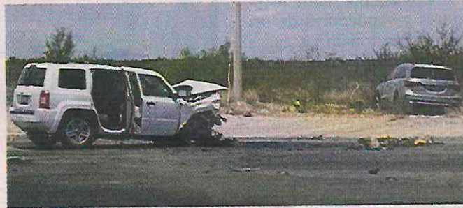
Un vehículo de la comitiva de Sheinbaum se impactó el viernes con una camioneta particular.