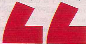
ANA LILIA RIVERA PRESIDENTA DEL SENADO

“Vamos a ejercer el poder, pero como mujeres no vamos a reproducir la cultura patriarcal, la soberbia, el abuso, la corrupción y el privilegio”