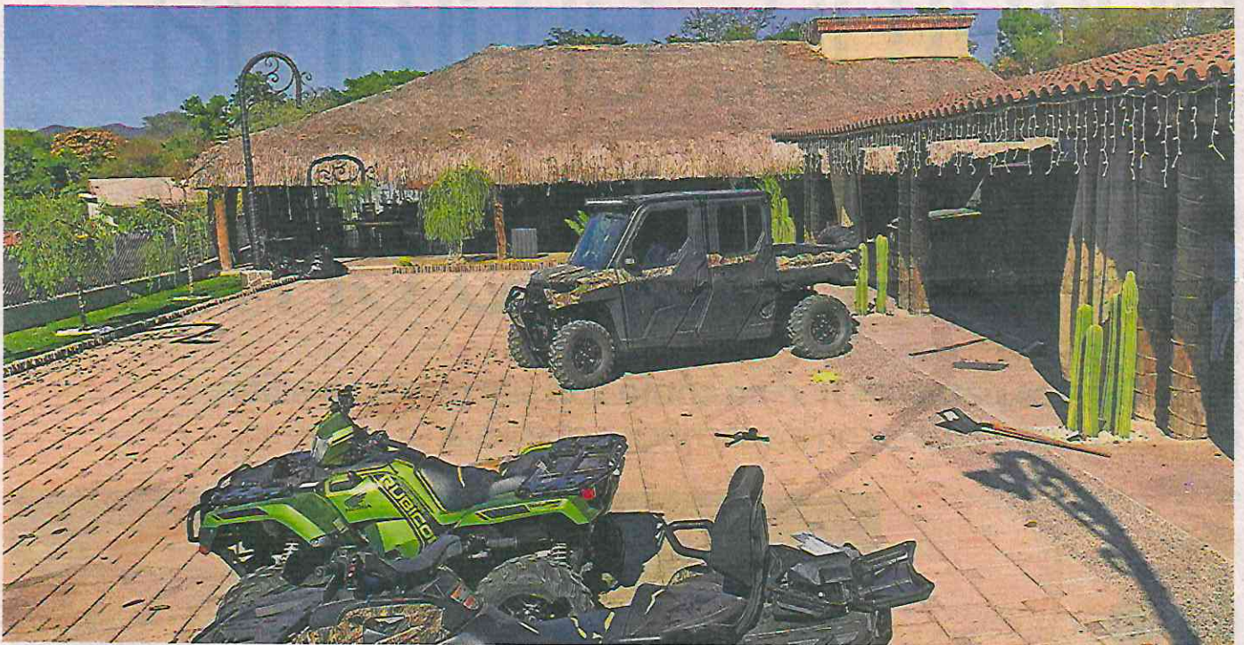
El interior de la casa donde fue capturado Ovidio Guzmán el 5 de enero de 2023 en Culiacán, Sinaloa.

La posibilidad de un acuerdo de cooperación con las autoridades se desvanece, mientras la extradición de El Nini apunta a que el destino de El Ratón está decidido y podría pasar el resto de su vida en prisión