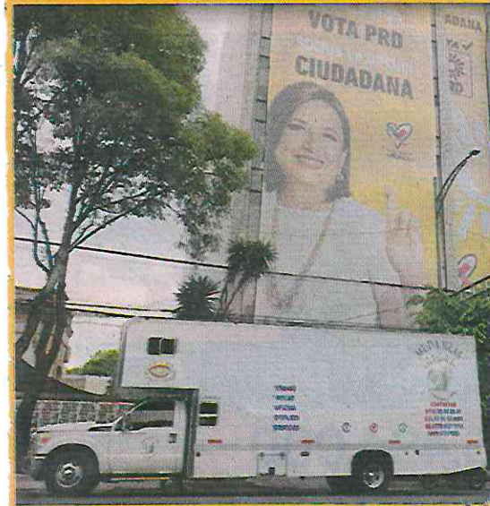
Desde el fin de semana pasado, la sede del PRD en la Colonia Escandón comenzó a ser desalojada.