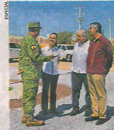
ESPECIAL Durante su gira, Claudia Sheinbaum y López Obrador visitaron la nueva sede de aduanas.

Al llegar a supervisar, en compañía del presidente López Obrador, las instalaciones del nuevo Hospital Regional de Alta Especialidad ISSSTE en Torreón, Coahuila, la próxima mandataria de México detalló que en la gira que realizan ambos ha podido platicar con él acerca de las obras y las acciones que se están haciendo y están pendientes de concluir. ●