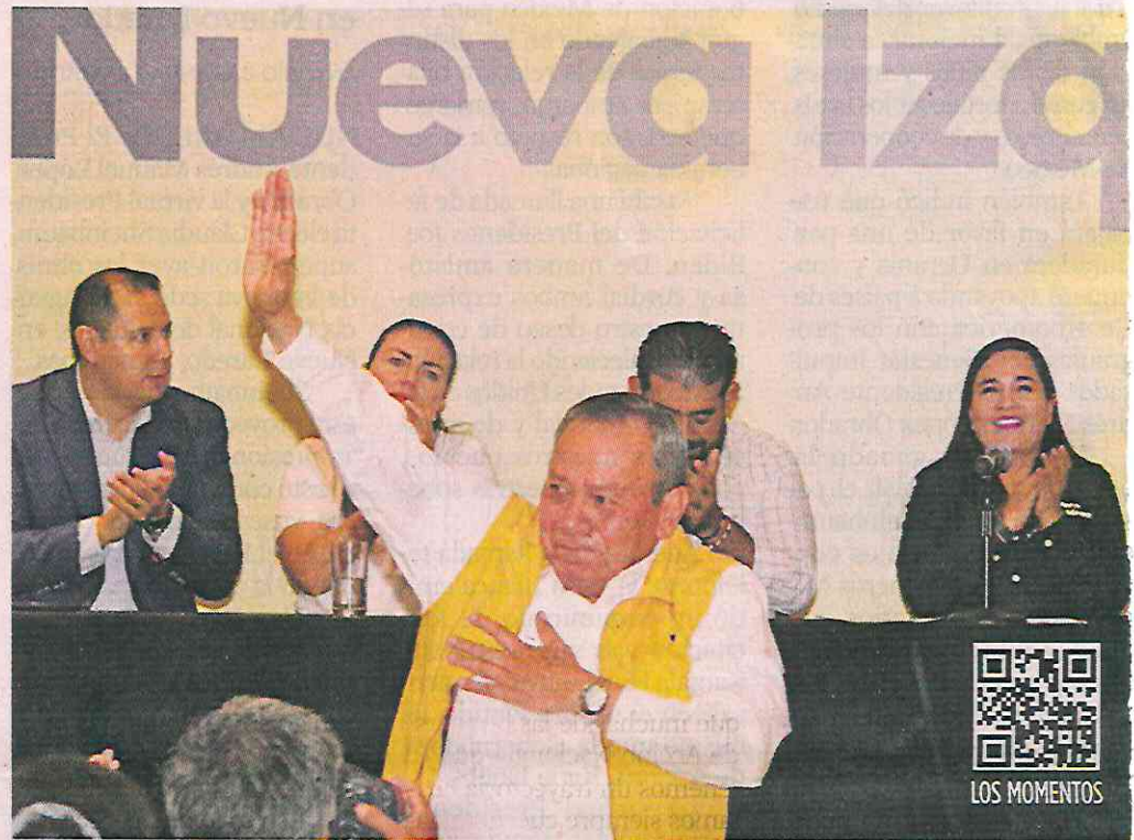
■ El líder del PRD, Jesús Zambrano, participó en una reunión de la corriente Nueva Izquierda.

“No puedo ocultar mi tristeza por lo que está pasando, pero hasta aquí llegamos para cerrar un ciclo y yo espero que con todo lo que significa todo este capital político que acumulamos y del que contribuimos a formar parte, tenemos con qué iniciar un nuevo ciclo”, expresó Zambrano conmovido, con vivas al partido, a México y a la democracia.