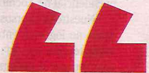
MARCELA GUERRA CASTILLO PRESIDENTA DE LA CÁMARA DE DIPUTADOS

“Vamos a ejercer el poder, pero como mujeres no vamos a reproducir la cultura patriarcal, la soberbia, el abuso, la corrupción y el privilegio”