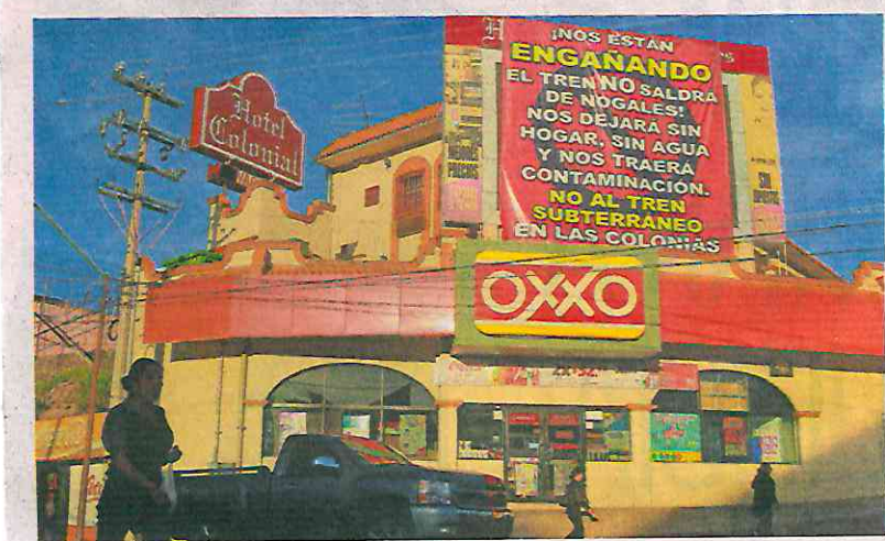
En la parte superior de una tienda de conveniencia, en el terreno del Hotel Colonial, se halla una lona en protesta por las obras del tren de Sonora.