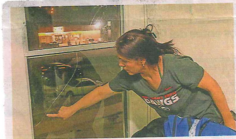
La señora Jade muestra un vidrio roto de su vivienda. Asegura que sucedió por las explosiones en la obra. También tiene paredes resquebrajadas.

Uno de los pocos documentos que se han podido conseguir por medio de la ley de transparencia es el contrato de la obra en Nogales. La empresa que está a cargo se llama Prodemex. La Sedena le asignó un trabajo de mil 977 millones de pesos. Están obligados a realizar el túnel y una lumbrera, un agujero a la mitad del subterráneo que sirve para la en-