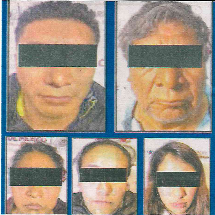
Los detenidos quedaron a disposición del agente del MP, quien definirá su situación jurídica