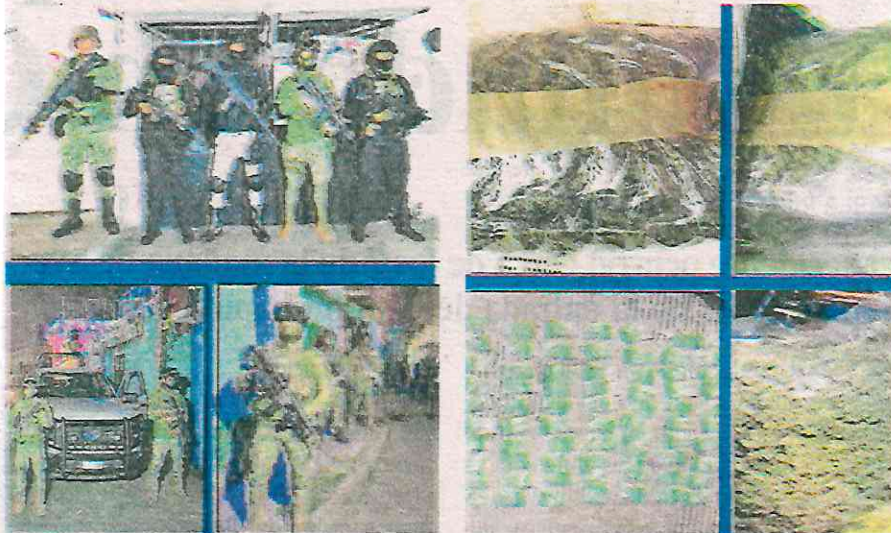
Los predios fueron sellados y se encuentran bajo resguardo policial mientras continúan las indagatorias