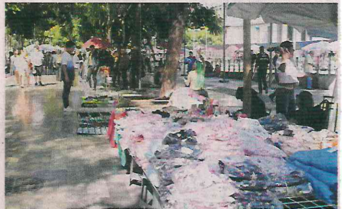
■ Informales extienden puestos y mantas.