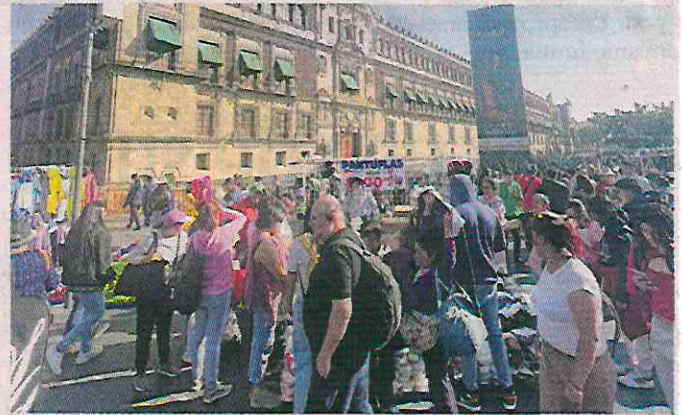
■ Pantuflas y pijamas se venden en el Zócalo.

“Se han retirado varias veces, con las obras peatonales, con los operativos, siempre que hay marchas o eventos, pero siempre regresan; el problema es que no todos son artesanos, ellos tenían su