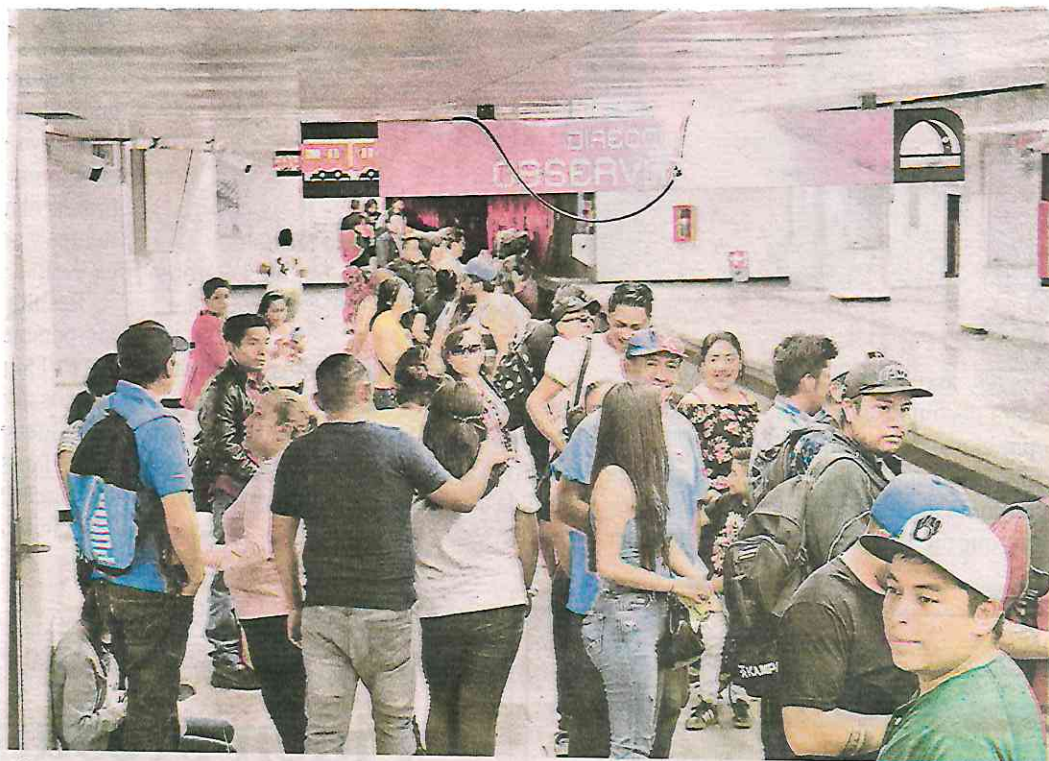
El proyecto de modernización abarca, entre otros, la sustitución de vías, actualización de sistemas eléctricos y electrónicos y adquisición de nuevos trenes

Mencionó que después de 52 años será una gran noticia entregar estas obras prioritarias para la capital, porque es la única forma de garantizar un transporte eficiente y seguro de movilidad para la ciudadanía, por lo que acompañará cualquier propuesta para la modernización de la Línea 1 del Metro.