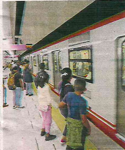
La Línea 1 operará en 2025