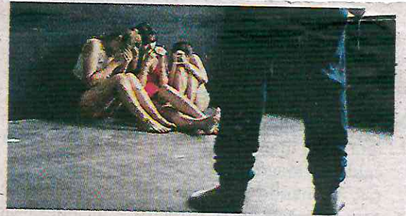
Quintana Roo, Edomex y CDMX con más víctimas

Las entidades en las que se han registrado más víctimas de trata de personas de entre cero y 17 años de enero a abril de 2024 han sido Ciudad de México (24), Quintana Roo (24) y Estado de México (22). “En México no hay datos claros sobre las ganancias económicas en la trata de personas con diversos fines incluida la explotación sexual, en un foro que se realizó en 2021, el titular de la Unidad de Inteligencia Financiera (UIF) señaló que por posibles actividades de trata