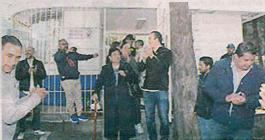
Pese a limitaciones de presupuesto reinaugaron al menos dos módulos pintados

CIUDAD DE MÉXICO. — En el eje de seguridad del gobierno de Carlos Orvañanos en la alcaldía Cuajimalpa de Morelos, arrancó una jornada de recuperación de los módulos de seguridad que se han encontrado en el abandono, pero los únicos trabajos que recibió este tipo de infraestructura, fue la aplicación de pintura para incluir la imagen institucional de la demarca-