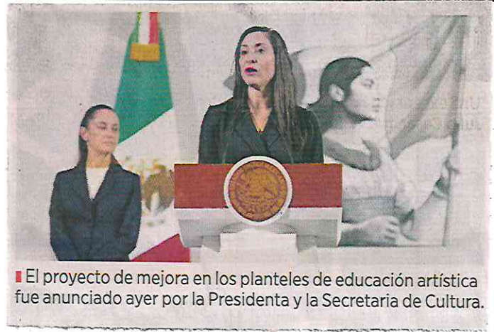
El proyecto de mejora en los planteles de educación artística fue anunciado ayer por la Presidenta y la Secretaria de Cultura.

El Sistema de Educación Artística, enumeró, está integrado por 4 escuelas de iniciación artística, 12 centros de educación artística media superior (CEDART), 24 escuelas de educación superior, 65 escuelas de iniciación en los estados y 4 centros de investigación artística dependientes del INBAL. Además, el INAH cuenta con 4 escuelas.