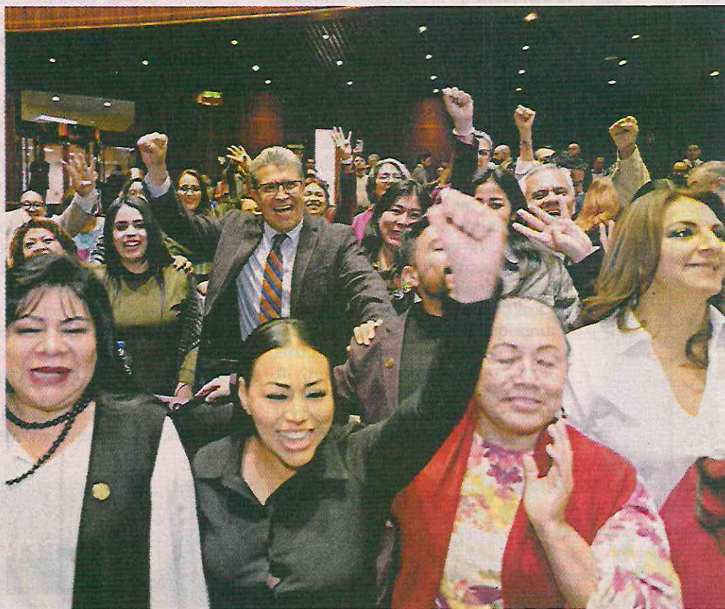
El Presupuesto de Egresos de la Federación fue aprobado en la madrugada del pasado jueves por Morena y sus aliados en la Cámara de diputados.

Por eso, afirmaron, existe un "compromiso de palabra", para que los recursos necesarios para liquidar al personal