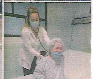
Un grupo de 199 médicos cubanos arribó el pasado 25 de noviembre al País.