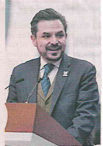
■ Zoé Robledo, director del Seguro Social.

También indicó que continuará la rotación de personal que está en la primera línea, desgastada por el contacto directo y permanente con los pacientes, además de agendar más citas de for-