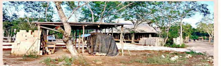
REPROBADOS. El predio donado para construir la Universidad del Bienestar en Valladolid, Yucatán, no registra avances.

y fue liberada alrededor de las 21:00, luego de que firmó un documento en el que se comprometió a entregar los títulos que faltaron.