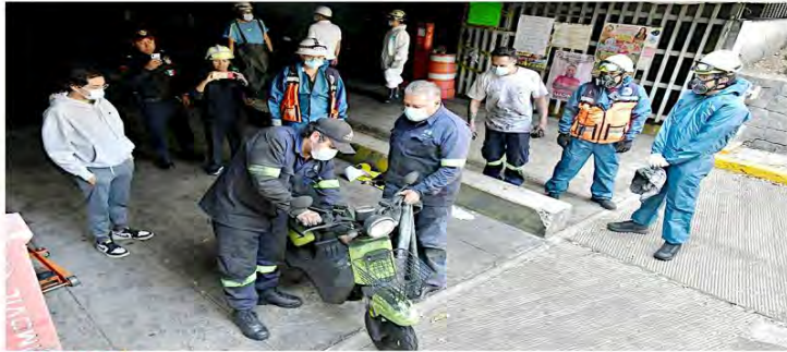
DAN SALIDA. Vehículos oficiales y particulares que estaban estacionados en el lugar siniestrado comenzaron a ser retirados ayer.