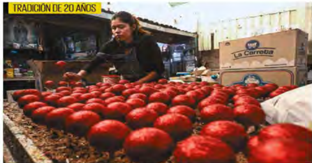
CAROL RINGO, EL UNIVERSAL