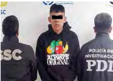
• ESFUERZO. Fue capturado en la colonia Obrera, alcaldía Cuauhtémoc.

• DESCENTRALIZAR. La jefa de Gobierno dijo que llegará la Navidad a toda la capital.