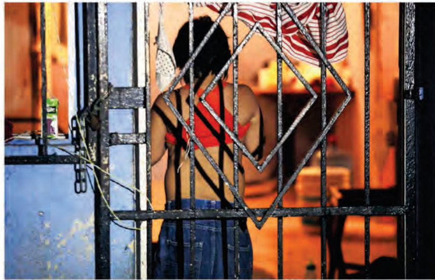
El mayor número de casos de agresiones contra la infancia y la adolescencia se concentró en el Estado de México durante el primer semestre de este año.

Comenta que "si hablamos de 10 denuncias, probablemente dos tienen carpetas y una de ellas tiene un plan de restitución de derechos. Eso para mí es como un mensaje muy