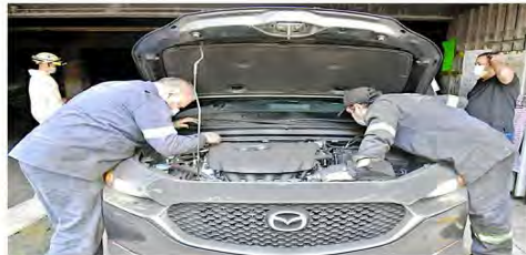
Las unidades eran sometidas a inspección para descartar fugas en las mangueras.

Los que están en las bodegas del sótano son de este último y la mayoría es documentación relacionada con recursos humanos, a veces hasta de hace 30 años. Los relacionados con trámites también son de procesos no vigentes.