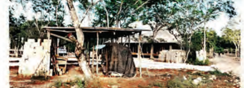
REPROBADOS. El predio donado para construir la Universidad del Bienestar en Valladolid, Yucatán, no registra avances.

y fue liberada alrededor de las 21:00, luego de que firmó un documento en el que se comprometió a entregar los títulos que faltaron.