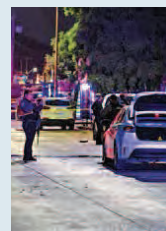
Tres muertos y cinco heridos durante una balacera.

El menor fue dado de alta, pero el resto de su familia continúa hospitalizada y su padre sigue en terapia intensiva, según la Secretaría de Salud.