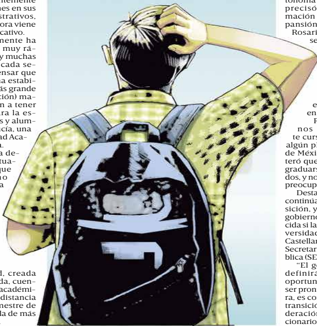
Ilustración: Horacio Sierra

ALUMNOS INDICARON que hay incertidumbre sobre qué pasará con los programas académicos; se respetarán trayectorias, afirma Sectei