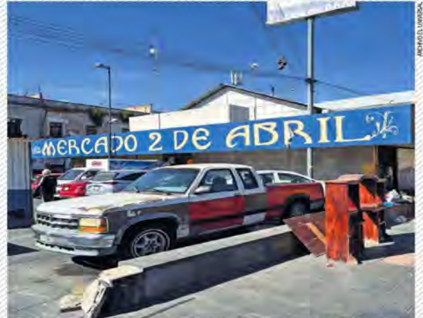
La Línea Antiextorsión se creó tras la ejecución de un carnicero en el Mercado 2 de Abril.

191 LLAMADAS de un total de 529 a la Línea Antiextorsión fueron para denunciar y 338 informativas.