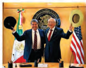
Ken Salazar, embajador de EU, destacó el trabajo que ha realizado junto a Ricardo Monreal en el Congreso.

Salazar calificó como un reto el fenómeno de la migración; sin embargo, dijo que ha habido avances en el tema.