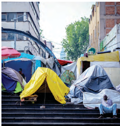
CAMPAMENTO en Plaza de la Soledad.

DANIEL y Darío habitan en cuartos de madera en Plaza de la Soledad; ahí, subsisten vendiendo comida de su país y se mueven entre puestos de dulces y barberías. pág. 6