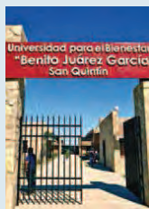
Una de las universidades Benito Juárez en San Quintín.

Agregó que el cuerpo docente brinda conocimientos a los alumnos a partir de una visión humanista, científica, de colectividad, para lograr una mejor sociedad.