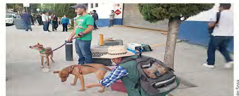
Tan pronto fueron devueltos por la Fiscalía, los canes fueron llevados a casas de familias adoptantes.

"Enrique" y "Beto", dos de los perros recuperados, fueron adoptados de inme-