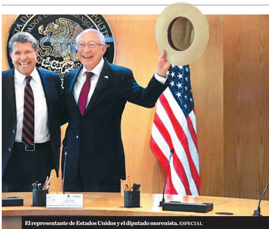
El representante de Estados Unidos y el diputado morenista.

Luego del dominio de los autócratas, queda un paisaje de destrucción y sufrimiento. Ya deberíamos de saberlo. Pero... ■