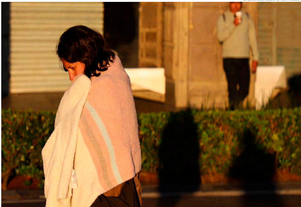
Se esperan 56 frentes fríos con temperaturas de los 4 a los 8 grados en la Ciudad de México

Familias realizan prácticas inseguras como la quema de leña y el uso de calentadores de gas con el objetivo de generar calor en sus hogares