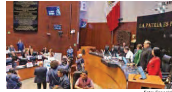
La Cámara alta aprobó las modificaciones constitucionales referentes al PJ, para establecer la supremacía de la Carta Magna.

Ante las diferencias, a través de un comunicado, el Grupo Parlamentario de Morena en la Cámara baja hizo un llamado fraterno a fortalecer la unidad como un acto de congruencia y lealtad al proyecto nacional que encabeza la presidenta Claudia Sheinbaum.