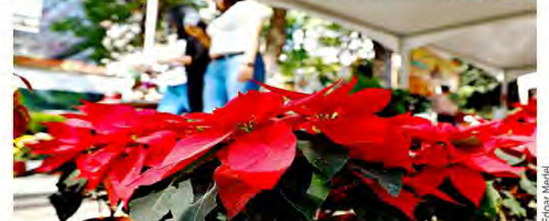
CON ALZA PAULATINA. De acuerdo con productores de nochebuena, las ventas de la flor han aumentado.

Aún así, floricultores agregaron que la ganancia neta será más baja respecto al año anterior, debido a los gastos realizados para la compra de abono y fungicida, utilizados en la recuperación de plantas.