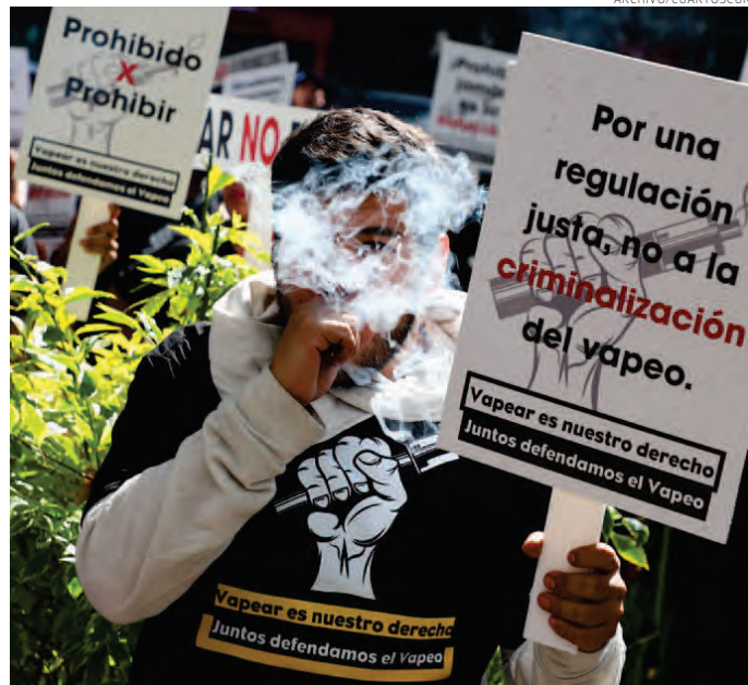
En la conferencia mañanera se advirtió de las sustancias nocivas a la salud que contienen los vapeadores y que se convierten en puerta de entrada a otro tipo de adicciones. En la imagen, manifestación en apoyo a su uso.

En la conferencia “La Mañanera del Pueblo”, encabezada por la Presidenta de