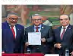
El titular de Finanzas mexiquense (centro) entregó al Congreso el Paquete Económico 2025.