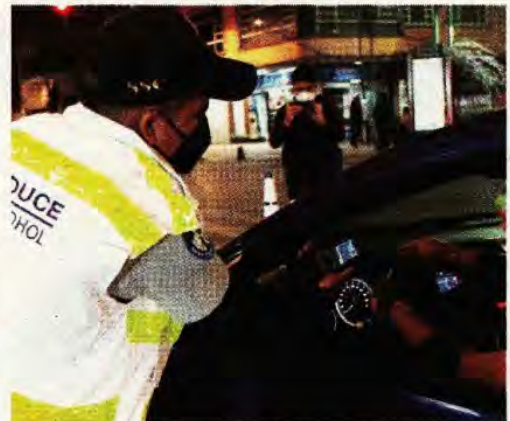
Las autoridades no se ajustan a recomendaciones internacionales

En el último reporte trimestral de la Semovi añadió que hubo 9 mil 128 lesionados, donde 3 mil 864 fueron motociclistas, 2 mil 96 pasajeros, mil 208 peatones, 630 ciclistas y mil 330 conductores