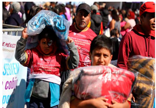
El GCDMX inició con la entrega de cobijas como parte del programa “La Ciudad te Cuida y en Invierno te Cobija”.

En 2018 se registraron más de 200 muertes por envenenamiento debido a la acumulación de monóxido de carbono o relacionadas con intoxicaciones por el uso de calentadores de gas mal instalados y la quema de leña.