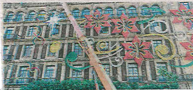
El Zócalo albergará una gran exposición y venta de artesanías mexicanas

Para consultar horarios y demás detalles, la ciudadanía puede ver la Cartelera de la Ciudad de México ( https://cartelera.cdmx.gob.mx/ ), así como las redes sociales de la Secretaría de Cultura: Facebook, Twitter, Instagram y YouTube.