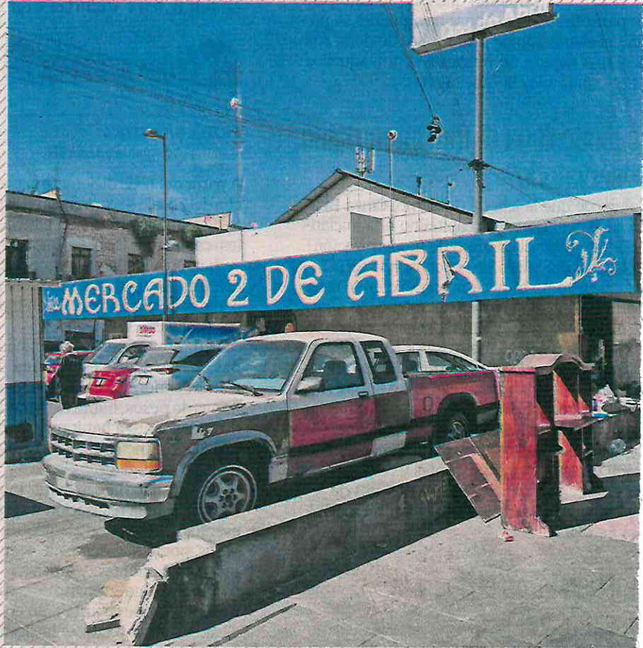
La Línea Antiextorsión se creó tras la ejecución de un carnicero en el Mercado 2 de Abril.

"La extorsión ha sido uno de los principales dolores del sector y en la Ciudad hay ciertas zonas que están identificadas como puntos rojos"