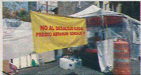
16 familias viven en el inmueble