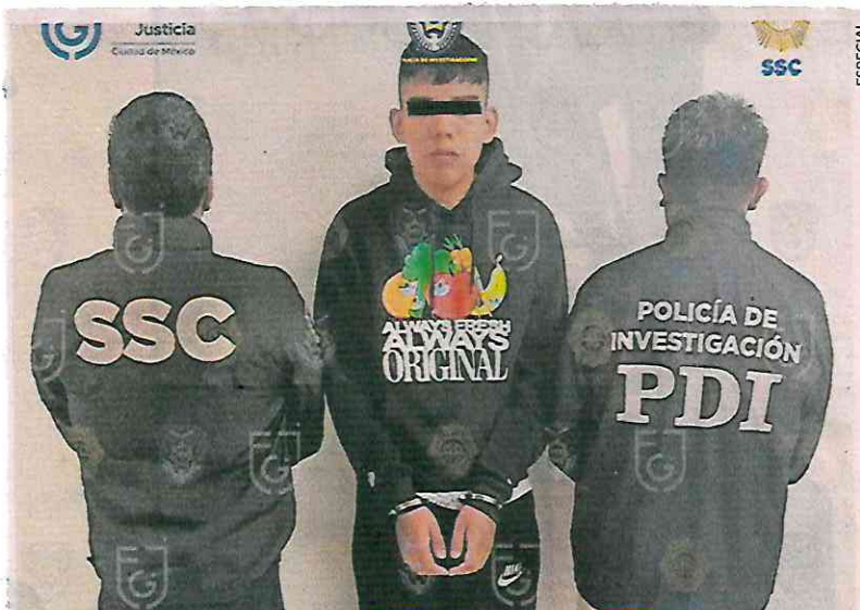
El sujeto fue ubicado en un inmueble en la colonia Obrera, por lo que se implementaron vigilancias fijas, móviles y discretas en el lugar.

"Pues falta y continúa la investigación de los autores intelectuales y de por qué se llevó a cabo... con esta detención se avanza en este caso, pero continúa la investigación", dijo, al reiterar que se investiga bajo el protocolo de feminicidio. ●