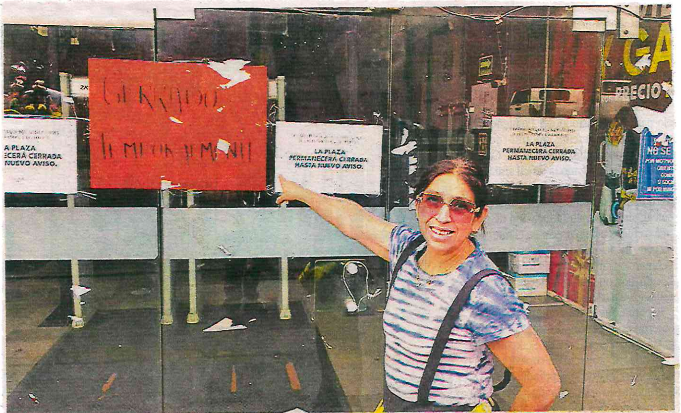
Mercedes dijo que sí le afecta el cierre de la plaza