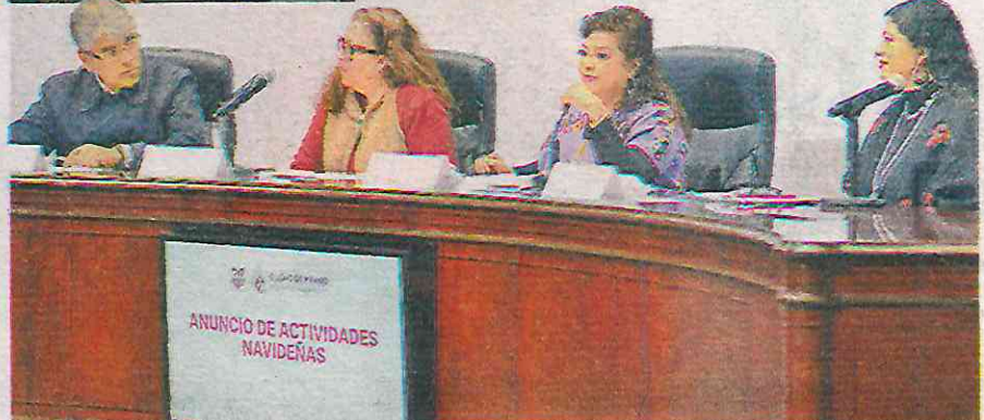
ANUNCIO DE ACTIVIDADES NAVIDEÑAS

Se destinarán 25 millones de pesos para la instalación de los escenarios e infraestructura de los distintos evento