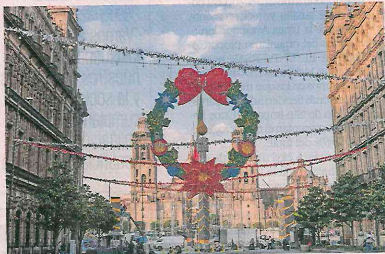
El 17 de diciembre se encenderá el tradicional alumbrado decorativo de los edificios de Gobierno, que enmarcará las distintas actividades en el Zócalo.

Durante estas fiestas navideñas, en las que se espera una derrama económica de 7 mil 420 millones de pesos, habrá actividades dirigidas tanto a habitantes como turistas, anunció la jefa de Gobierno, Clara Brugada.