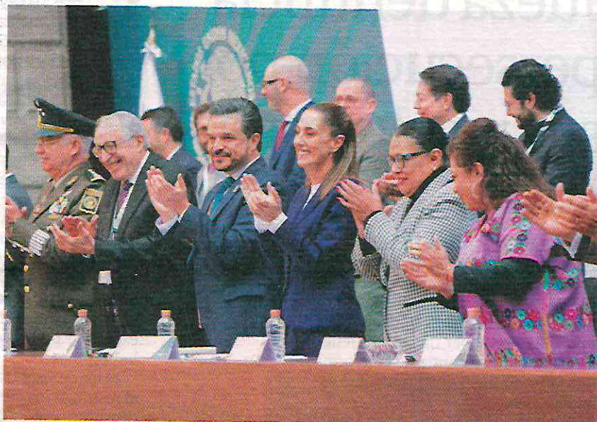
LA PRESIDENTA Claudia Sheinbaum, flanqueada por la secretaria de Gobernación, Rosa Icela Rodríguez, y el titular del IMSS, Zoé Robledo, ayer, en Palacio Nacional.

LA PRESIDENTA Claudia Sheinbaum asegura que la prioridad de su Gobierno será fortalecer la seguridad social y el acceso a la salud; reconoce complicaciones y retos para el instituto