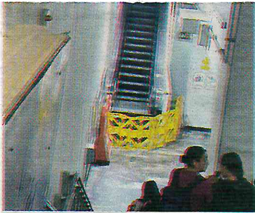
Los usuarios se quejan del mal servicio