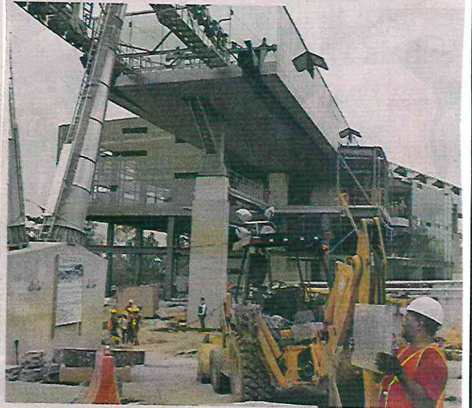
El puente peatonal que cruza Avenida Constituyentes fue cerrado temporalmente por obras del Cablebús.

En el cruce de Observatorio y Constituyentes, frente al Panteón de Dolores, policías permanecen ante el riesgo de asaltos a los automovilistas atrapados en el tráfico lento.