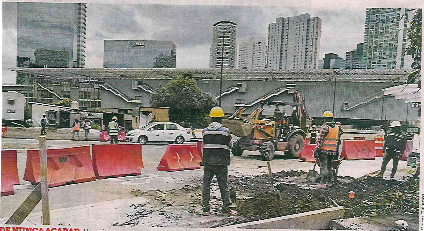
DE NUNCA ACABAR. Usuarios se encuentran con trabajos tanto al interior como en las inmediaciones de la estación.