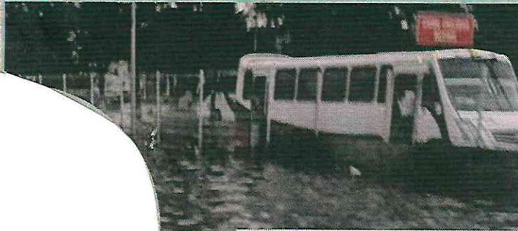
■ Ni el transporte público podía pasar.

Se pidió no resguardarse de la lluvia debajo de árboles y cargar con impermeable si se tiene previsto estar en exteriores.