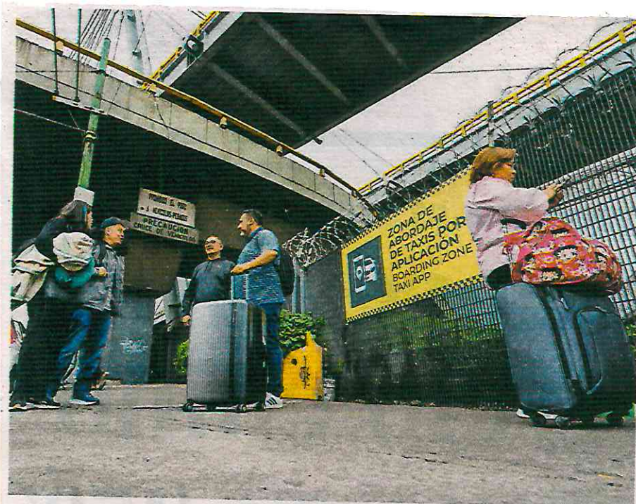
Viajeros que salían de la Terminal 1 esperaron sobre Circuito Interior