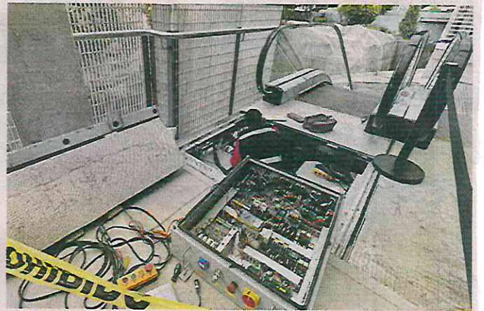
■ De las 16 escaleras, sólo cuatro están abiertas actualmente.

Actualmente, el Interurbano recorre un trayecto de 49 kilómetros, de los 58 que deberá tener cuando llegue a la terminal Observatorio, que aún está en construcción y