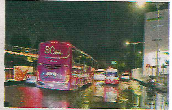
Un autobús quedó atrapado en medio de la inundación que alcanzó el metro y medio de altura