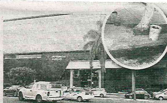
Ubicada en la Avenida Universidad de la alcaldía

Lo que hizo la agencia de autos es considerado un deli-