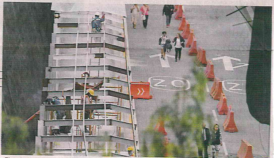
El andador peatonal que dará acceso a la estación aún es intervenido

La infraestructura cuenta con 3 mil 400 metros cuadrados y está construida en tres niveles, con grandes columnas asentadas sobre una hondonada, dentro de la cual se