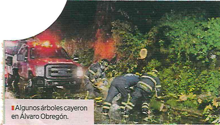
■ Algunos árboles cayeron en Álvaro Obregón.