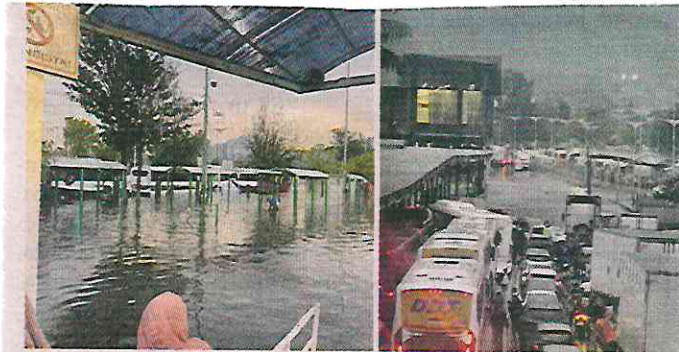
■ El Cetrám Indios Verdes quedó colapsado por las inundaciones que se registraron en plena hora pico.

Las lluvias fuertes podrían estar acompañadas de actividad eléctrica y rachas de viento de hasta 40 kilómetros por hora.