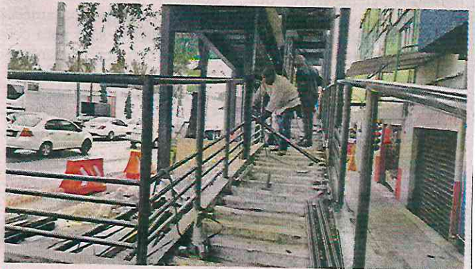
Personal de la CDMX realiza obras de reforzamiento en la estructura de acero del puente.