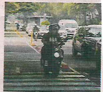
Motociclistas también invaden la vía, sin recibir sanción alguna.

En agosto, cuando las obras de rehabilitación se llevaban a cabo, REFORMA publicó que los usuarios de la cicloavía se veían obligados a sortear obstáculos que afectan la seguridad de los