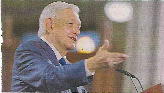
Andrés Manuel López Obrador, Presidente

/// También ellos (los narcos) deben de actuar con un mínimo de responsabilidad, es su familia, son sus paisanos, es su municipio, es su estado, es su País. Esto se desajusta a partir de la detención o del secuestro del señor Zambada".