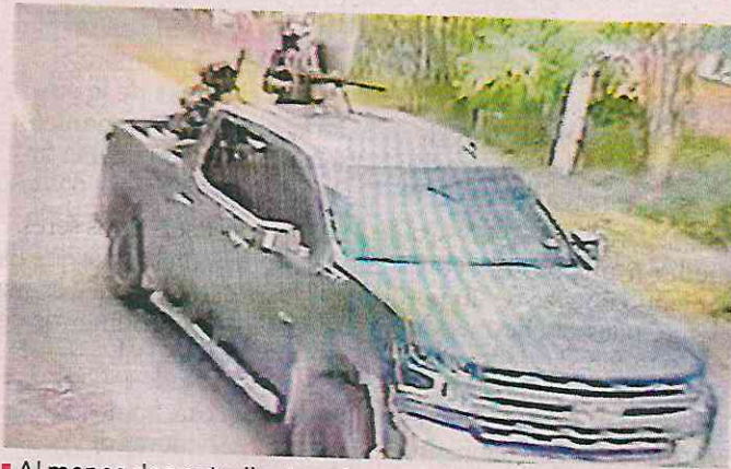
Al menos dos patrullas terminaron rafagueadas por narcos.

la Independencia, automovilistas fueron afectados por narcobloqueos y ponchallantas en tramos de la Carretera Nacional.