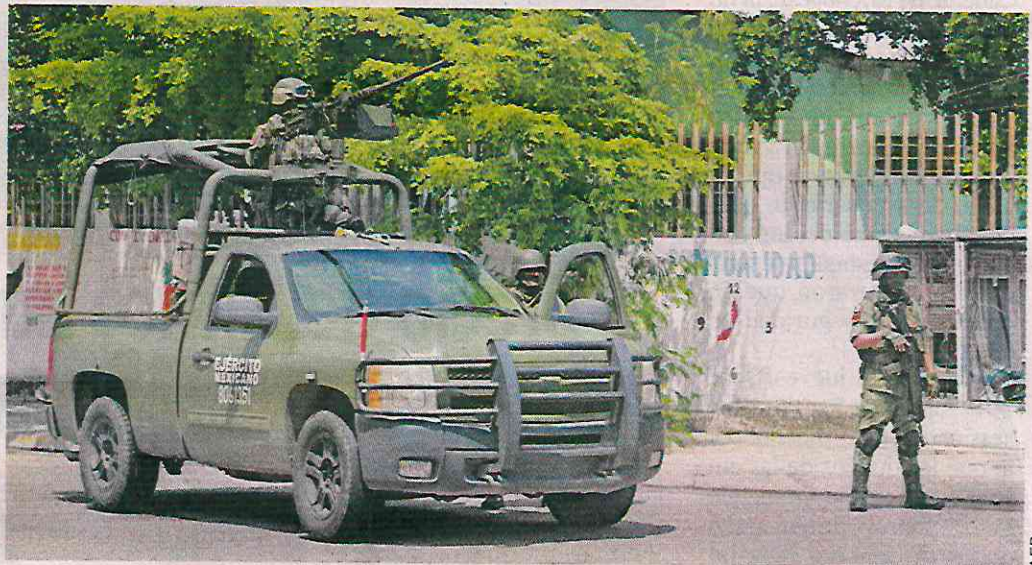
Ante el recrudecimiento de la violencia, militares patrullan diversas zonas de Culiacán.

Dos horas y media después se confirmó su localiza-