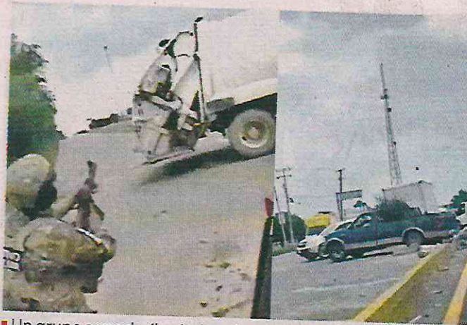
Un grupo armado (izq.) abandonó un camión en la Carretera Nacional y gritó consignas en apoyo a un cártel, causando un atorón en la vialidad durante varias horas.

A su vez, en pleno inicio del fin de semana largo por