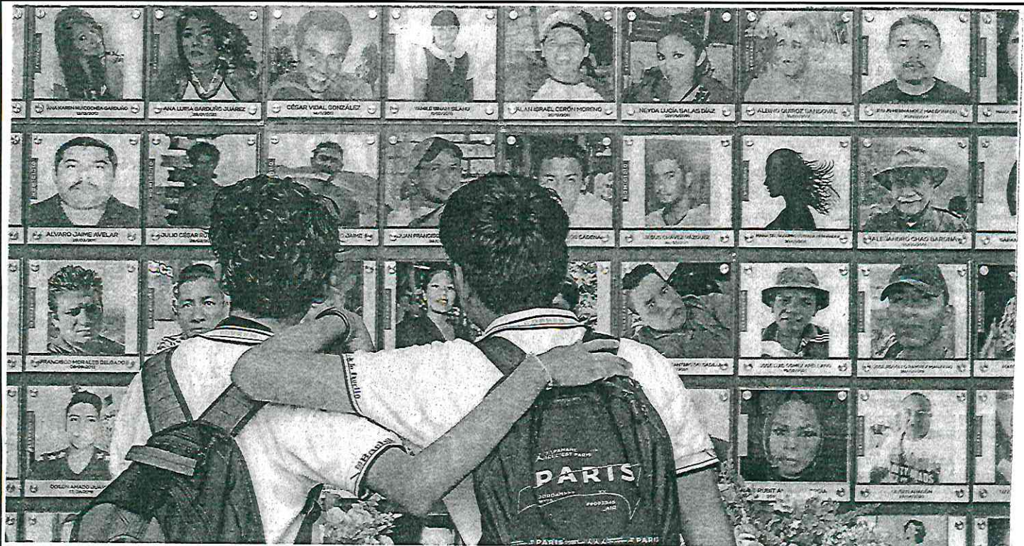
Gobierno de Cuernavaca, Morelos, se encuentra un memorial de víctimas que fue instalado por colectivos de buscadoras.