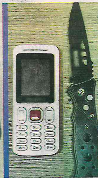
Es detenido al momento de tener secuestrado a un hombre dentro de su automóvil

ron una herida en la pierna con un objeto punzocortante.