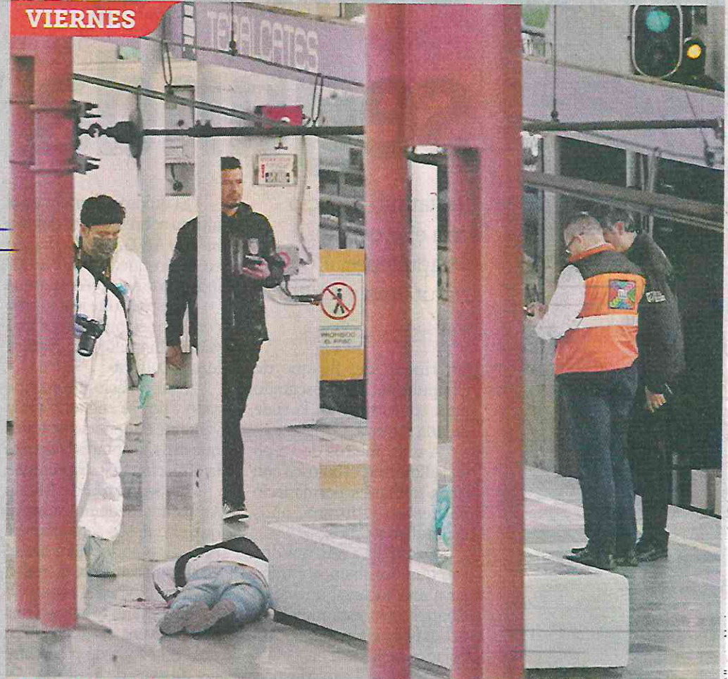
EN PLENO ANDÉN. De acuerdo con las indagatorias, el homicida esperaba desde minutos antes del ataque a la víctima en el interior de la estación Tepalcates de la Línea A del Metro.

“Se tiene un seguimiento ya de las personas, hay buena información y esta-