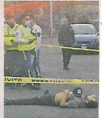
■ Ambos motociclistas no portaban casco de seguridad.

Pasadas las 19:00 horas, los elementos de la Fiscalía capitalina concluyeron sus diligencias y levantaron los cuerpos para trasladarlos al anfiteatro.