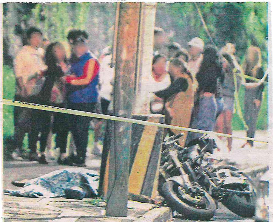
Aquí, la motocicleta de color negro impactada contra un poste de luz y una de las víctimas

Luego de que Paramédicos del Escuadrón de Rescate y Urgencias Médicas (ERUM) que acudieron al lugar, diagnosticaron a los hombres de 35 y 40 años de edad aproximadamente, sin signos vitales llamaron a los servicios forenses de la Ciudad de México. Además, del hecho se informó al agente del Ministerio Público correspondiente, quien iniciará la carpeta de investigación correspondiente.