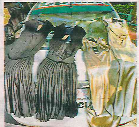
La mujer, junto con lo asegurado, fue trasladada al MP

didias quien les informó que una joven intentó cruzar la salida sin realizar el pago correspondiente de las prendas.