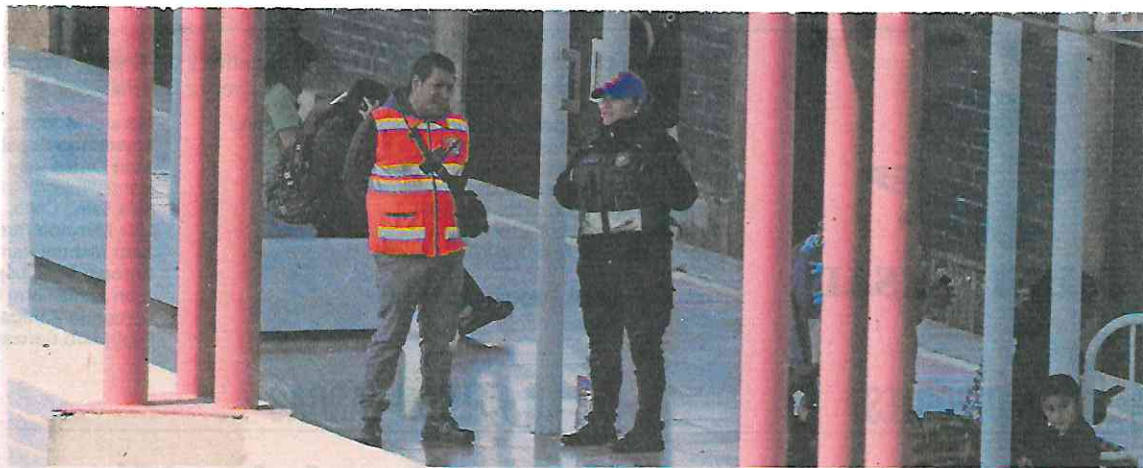
Durante un recorrido por la estación Tepalcates sólo se observó a un elemento de la Policía Auxiliar.