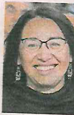
Azucena Cisneros Coss

::::: Nos dicen que la alcaldesa electa de Ecatepec, la morenista Azucena Cisneros Coss , tiene prácticamente conformado el gabinete con el que comenzará su gestión el 1 de enero de 2025. Uno de los integrantes será el exdiputado local guinda Faustino de la Cruz , quien además de ser de Ecatepec, es uno de sus más cercanos colaboradores desde hace años. Nos comentan que habrá una combinación de gente joven con experiencia en su ayuntamiento, porque la responsabilidad que enfrentarán no será nada fácil, pues se trata del municipio mexiquense más poblado y con diversos problemas por resolver. Pronto sabremos si la designación de su equipo fue la acertada.