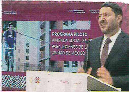
Anunció el 1er Proyecto de Vivienda Social