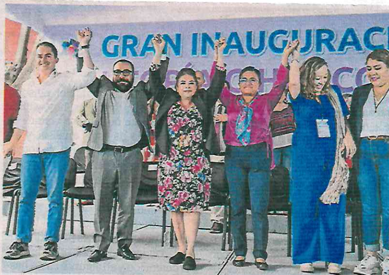
La jefa de Gobierno electa, Clara Brugada, asistió como invitada especial a la inauguración de la Utopía Cihuacóatl, en Iztapalapa.

“Abro la puerta para que las mujeres salgan y nos digan qué quieren que haya en las Utopías, de qué manera quieren ejercer su derecho a poder disfrutar la Ciudad. A las secretarías y secretarios aquí presentes, a la creatividad, de qué manera vamos a promover que este sea el