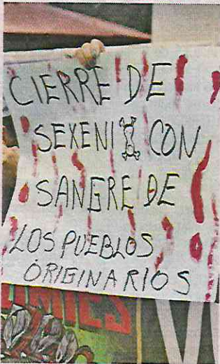
Integrantes de pueblos originarios se manifestaron en la FGJ.