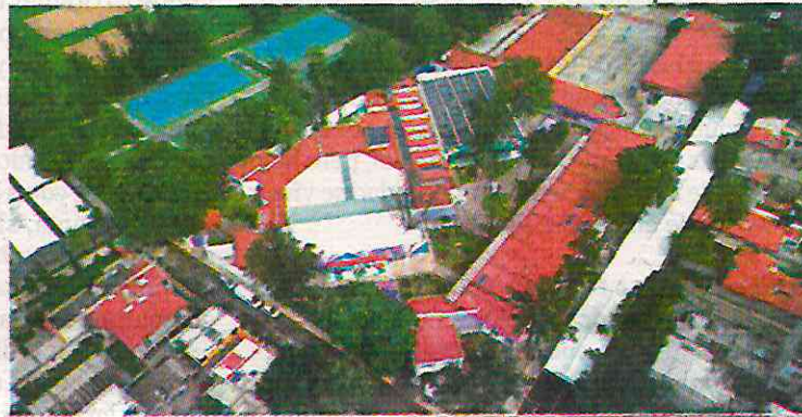
Toma aérea de la Utopía Cihuacóatl.

Resaltó que la creación de las Utopías ha permitido que el Estado asuma la responsabilidad de los cuidados, lo que libera tiempo para que las mujeres puedan enfocarse en su desarrollo personal y bienestar” •