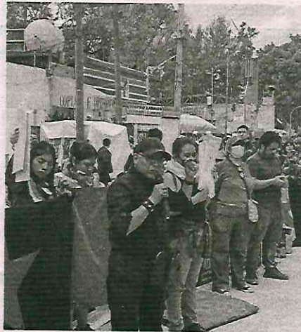
La manifestación duró cuatro horas