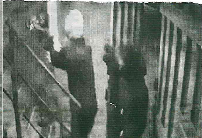
Dentro del departamento se hallaron restos de drogas