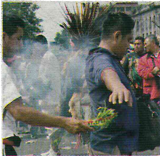
· Aprovechan sus creencias supersticiosas