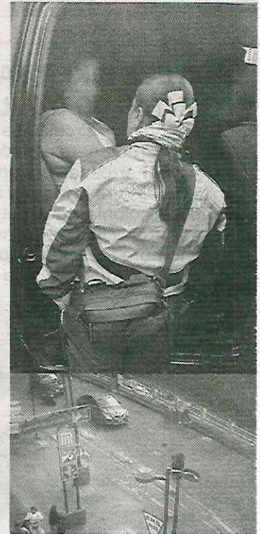
Momentos de gran tensión

En el video del caso se observó a otra chica que le prestó su celular para darle aviso a sus consanguíneos