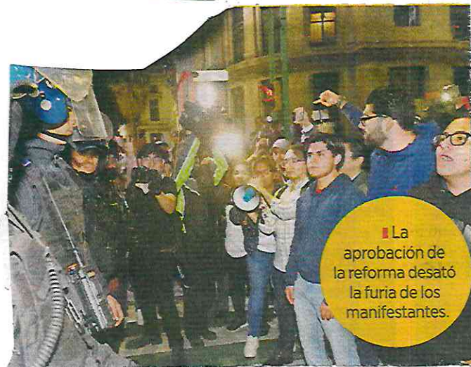
La aprobación de la reforma desató la furia de los manifestantes.