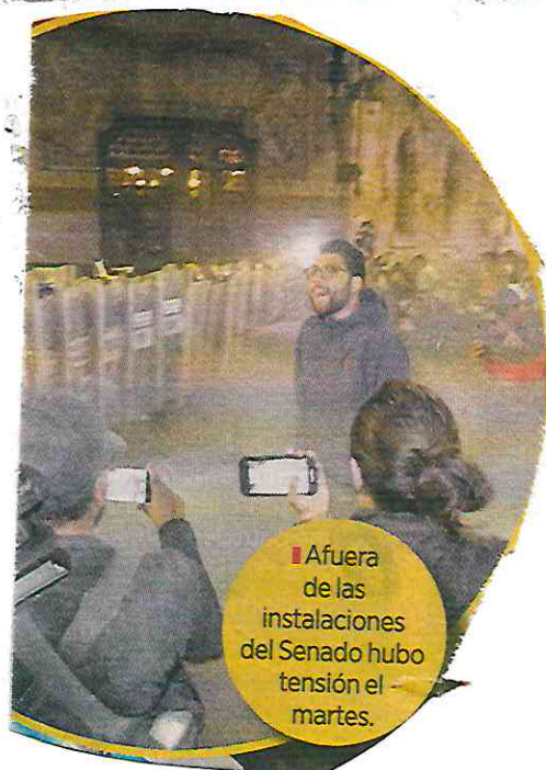
Afuera de las instalaciones del Senado hubo tensión el martes.

El martes, un grupo de opositores a la reforma entró violentamente a la sede del Senado en Reforma, lo que obligó a los legisladores a seguir la sesión en la sede de Xicoténcatl, que también fue asediada por los manifestantes.