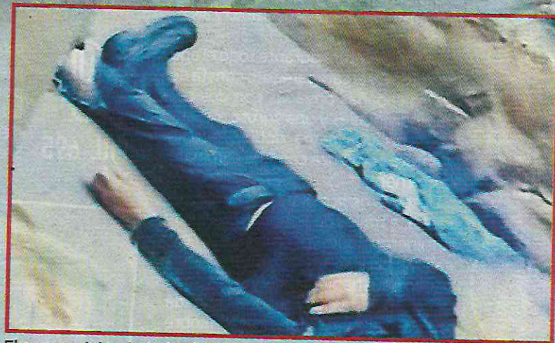
El cuerpo del trabajador fue llevado a la superficie, pero había muerto.

Junto con elementos de la Secretaría de Seguridad Ciudadana (SSC) adscritos a la seguridad y vigilancia del lugar lo sacaron del agua y lo llevaron a la superficie. Enseguida, solicitaron los servi-