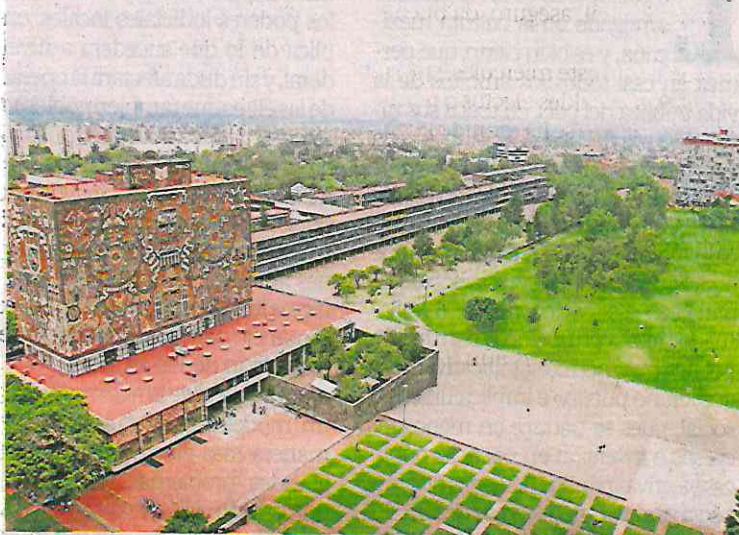
Autoridades han realizado operativos para inhibir la venta de droga en facultades de Ciudad Universitaria.

Personal de la Subsecretaría de Inteligencia e Investigación Policial identificaron que el dinero de la venta de las drogas era depositado principalmente en dos cuentas bancarias, una a su nombre y otra propiedad de su madre. ● Con información de Kevin Ruiz