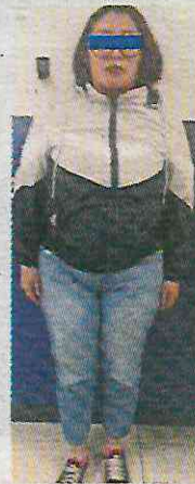
El director y la maestra fueron llevados al MP.