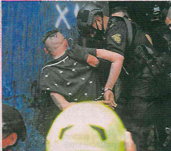
En seis años tres delitos sumaron 103 mil 98 detenciones en la Ciudad de México.