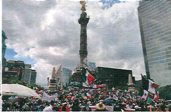
MANIFESTANTES contra la reforma al PJ se reunieron ayer en el Ángel de la Independencia.