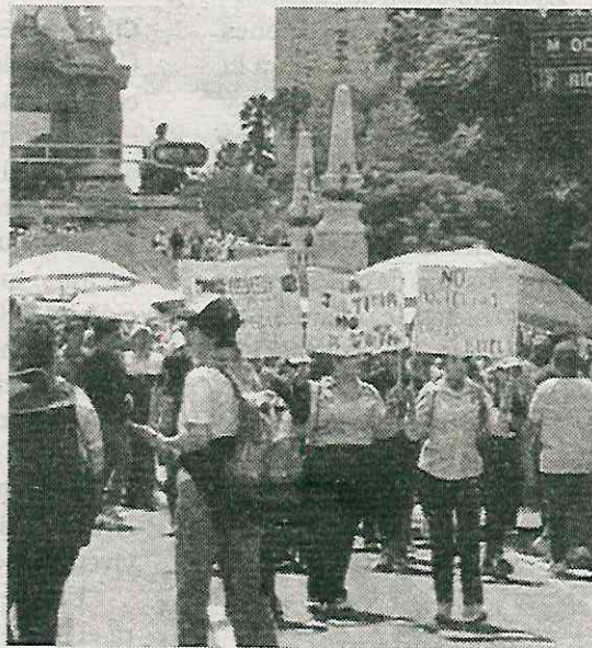
Permanecieron indefinidamente en la explanada

En el área cercana al Congreso de la CDMX y al Zócalo, la Secretaría de Seguridad Ciudadana (SSC) desplegó un importante operativo para prevenir la toma de las instalaciones por parte de trabajadores del Poder Judicial, quienes buscaban in-