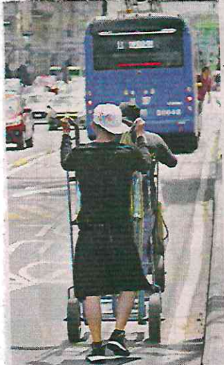
■ En Eje Central la obstrucción es mayor. Al comercio informal se suman los 'diablitos'.