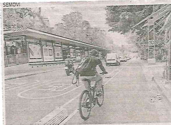
El nuevo espacio ciclista busca fomentar el uso de la bicicleta y mejorar la movilidad de las y los habitantes

También tendrá conexión con distintas rutas de infraestructura ciclista existentes, como las ciclovías Revolución y Patriotismo, Avenida Nuevo León y los ciclocariles en las calles Agricultura y Minería.