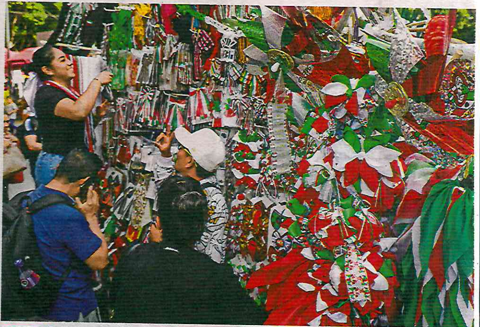
VARIEDAD. Diademas, silbatos, tambores, trompetas, playeras, máscaras, banderas y todo tipo de adornos, son algunos productos que se venden en estos icónicos carritos.

“Son productos artesanales y nacionales, hay puestecitos que utilizan materiales chinos y se puede distinguir demasiado, pero nosotros no, nosotros utilizamos material na-