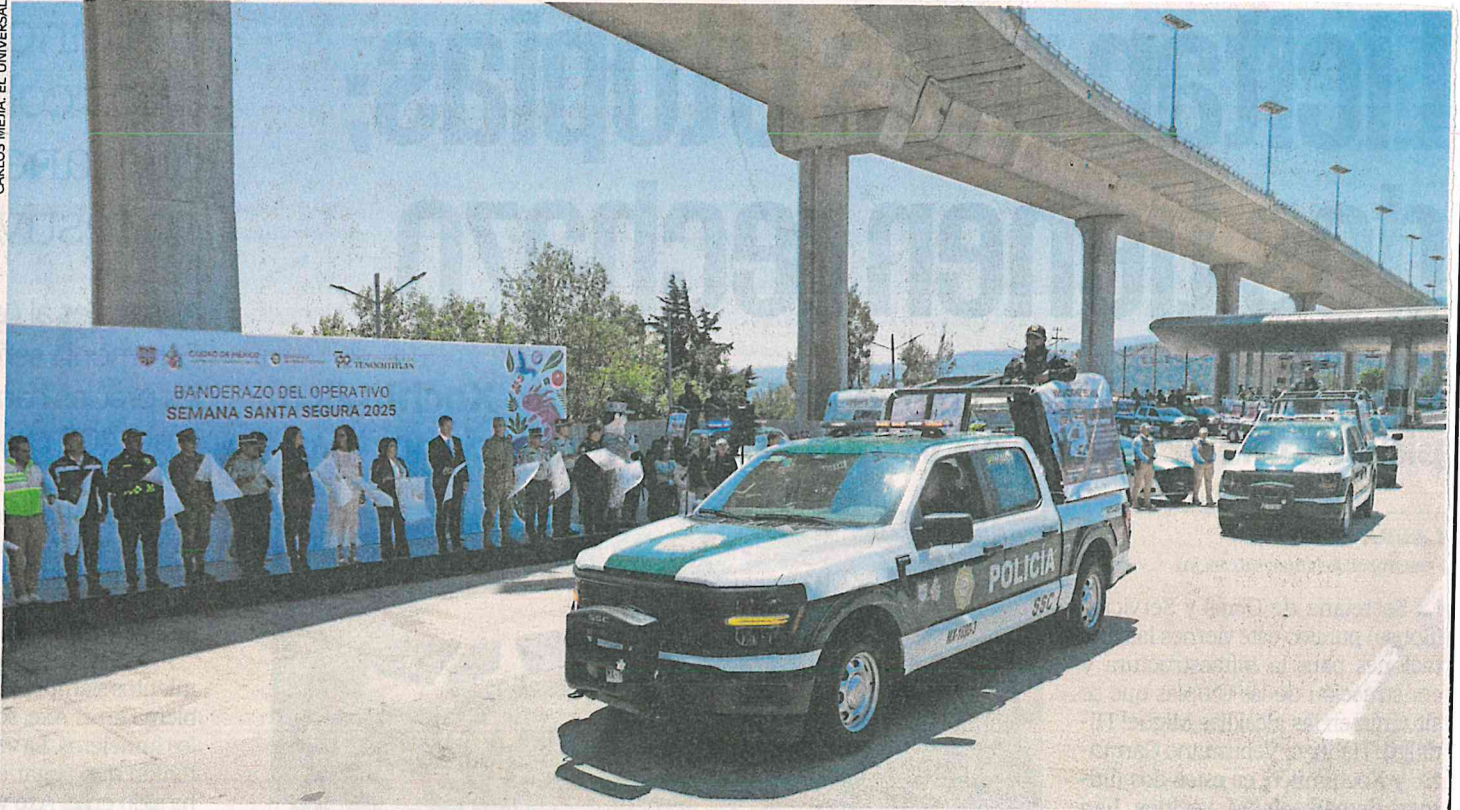
En la caseta de cobro ubicada en Tlalpan, la jefa de Gobierno llamó a los policías capitalinos a resguardar la Ciudad durante la Semana Santa.