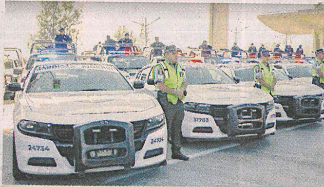
■ Ayer se dio el banderazo de salida en la caseta de Tlalpan de la Autopista México-Cuernavaca.