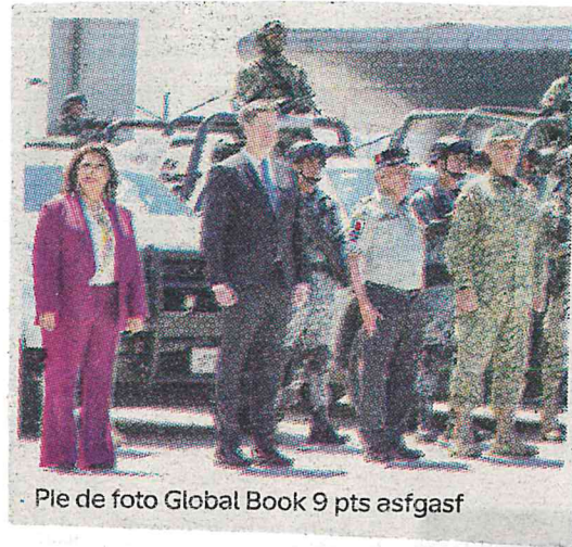
Pie de foto Global Book 9 pts asfgasf