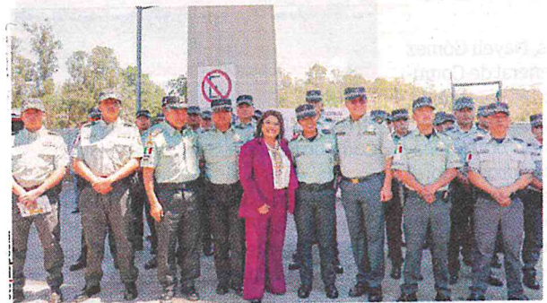
LA JEFA de Gobierno de la Ciudad de México, Clara Brugada, ayer, en compañía de elementos de la GN.

CLARA BRUGADA Jefa de Gobierno de la Ciudad de México