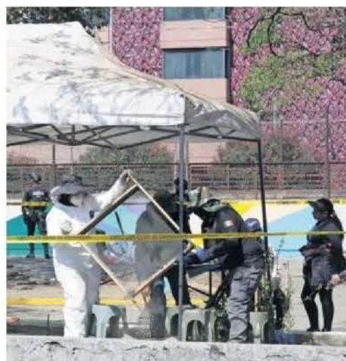
Elementos de diversas corporaciones arribaron a la zona con maquinaria y binomios caninos.

Derivado de una carpeta de investigación por la desaparición de una persona de origen extranjero, cerca de las 11:00 horas del viernes agentes de la Policía de Investigación (PDI), elementos del Grupo Especializado de Apoyo a la Búsqueda Inmediata, policías del Agrupamiento Fuerza de Tareas y paramédicos del Escuadrón de Rescate y Urgencias Médicas (ERUM), estos últimos de la Secre-