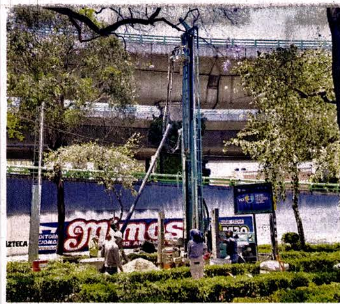
La información captada por los sensores será transmitida a una oficina en la UNAM.