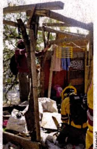
En total fueron recuperadas 15 hectáreas del Cerro Vicente Guerrero, en la GAM.

Acudió personal de la Secretaría de Obras y Servicios (Sobse) para limpiar el área, así como visitantes de la Comisión de Derechos Humanos de la Ciudad de México (CDH) y de la Brigada de Vigilancia Animal (BVA).