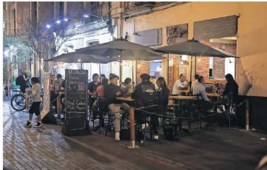
Los restaurantes tienen permitido operar bajo la venta de alcohol hasta las 2:00 horas del día siguiente; mientras que los clubes privados hasta las tres de la mañana, explicó la PAOT.

La titular de la PAOT explicó que al recibir las denuncias se lleva a cabo una visita en la que se