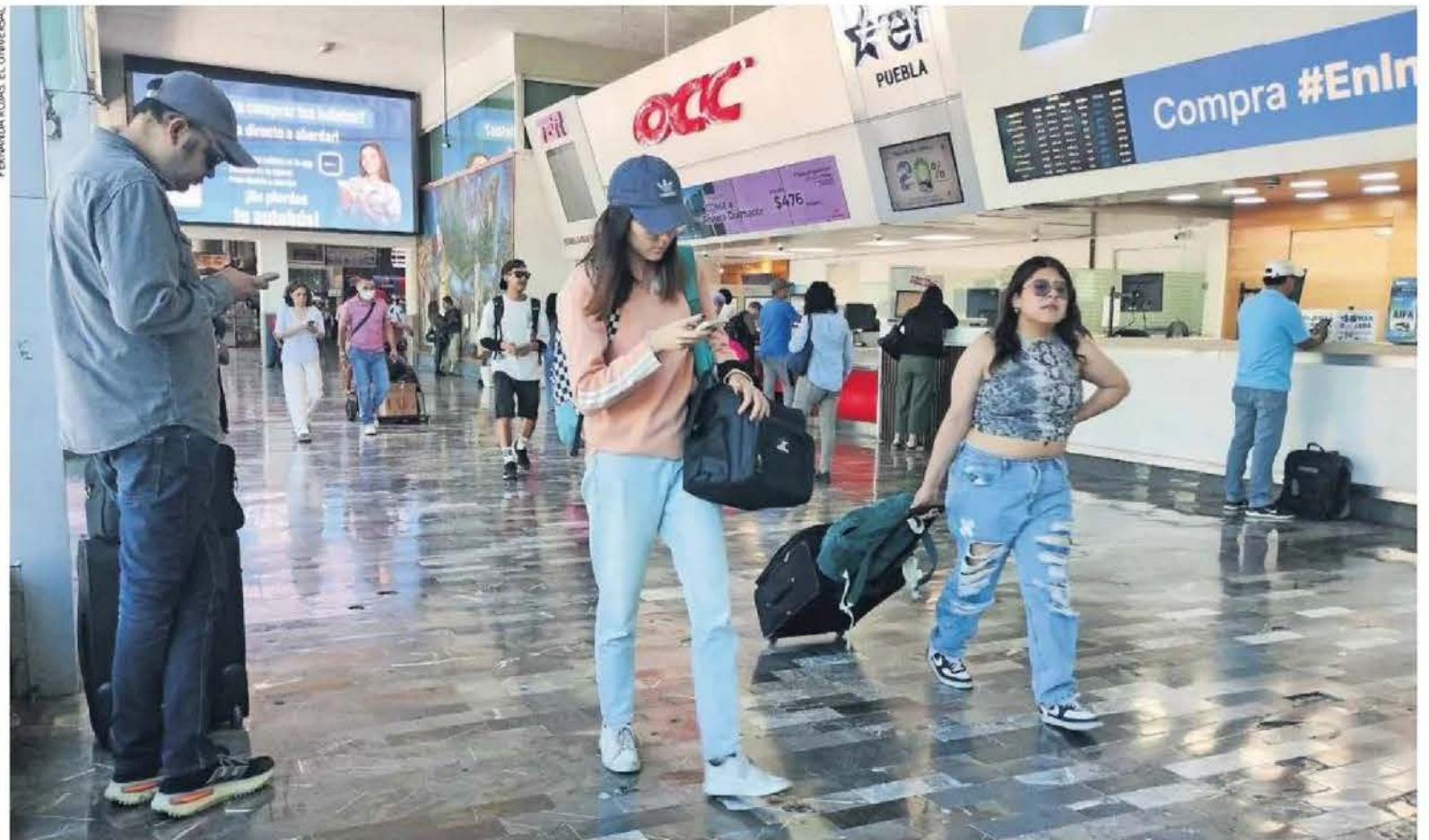
IMAGEN DEL DÍA | A18

Ayer viernes comenzó la salida de capitalinos hacia los distintos destinos del país con motivo de las vacaciones de Semana Santa. En centrales camioneras, como la del norte, se observó a decenas de personas haciendo filas para la compra de boletos de autobús, así como salas de espera llenas. De acuerdo con el calendario escolar de la Secretaría de Educación Pública (SEP), este período de asueto comienza formalmente el lunes 14 y concluye el viernes 25 de abril. Para garantizar la seguridad de quienes se quedan y salen de la Ciudad fueron desplegados más de 14 mil elementos.