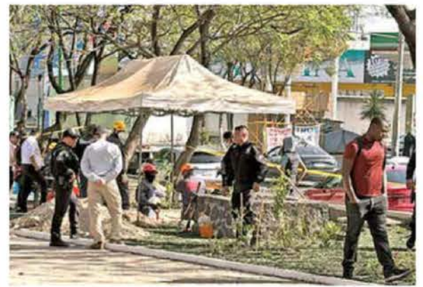
Por más de seis horas realizaron excavaciones de búsqueda, hasta que encontraron lo que parece es un cuerpo.

El director del C5 agregó que "también es conveniente automatizar la iluminación (de los hogares) con temporizadores en horarios variables y siempre asegurarse de que puertas y ventanas estén bien cerradas, así como dejar las prácticas que ya son inoperantes e inútiles, como dejar encendida la luz, pues dejarla encendida quiere decir que no estás".