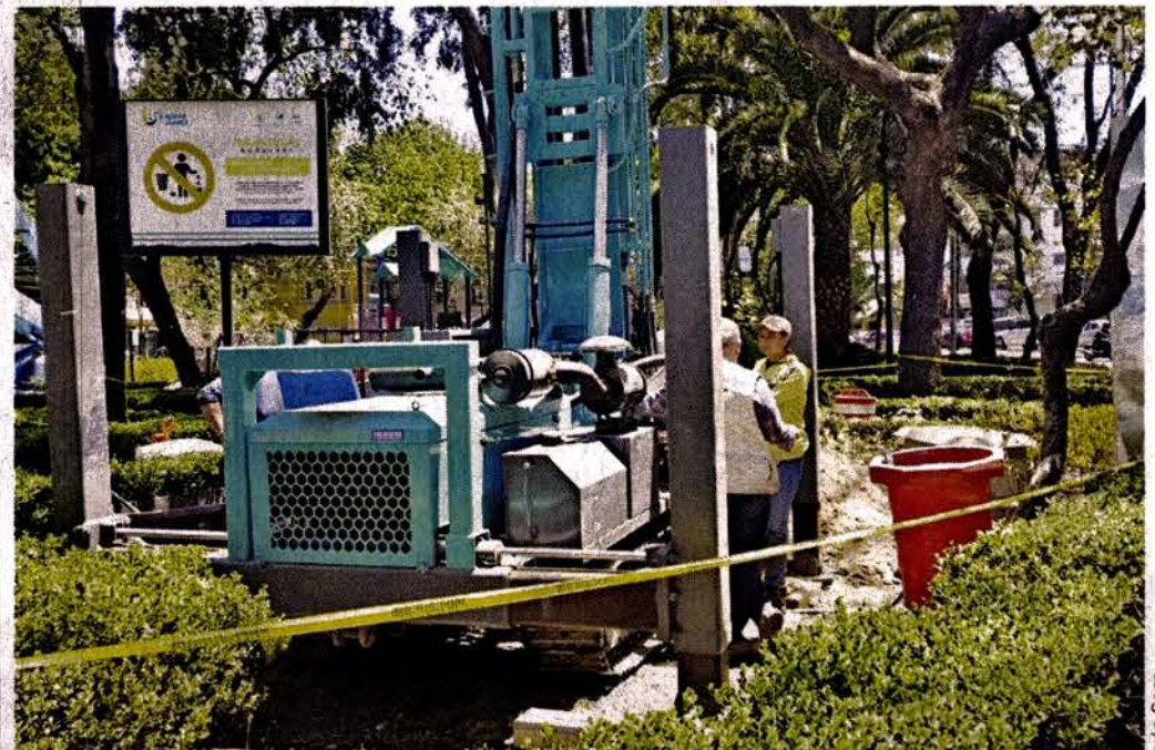
ESTUDIO BAJO LA TIERRA. Una perforadora realizó esta semana maniobras para instalar un sensor a 100 metros de profundidad, en la zona de Mixcoac.

"Los investigadores han tenido la paciencia de explicar a toda persona que se acerca a preguntarles qué son