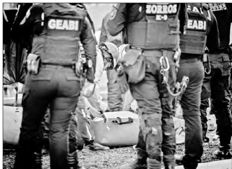
◀ Los peritos hallaron restos que serán analizados para saber si pertenecen a la persona desaparecida.

En el lugar se realizó un operativo por la desaparición de un ciudadano colombiano