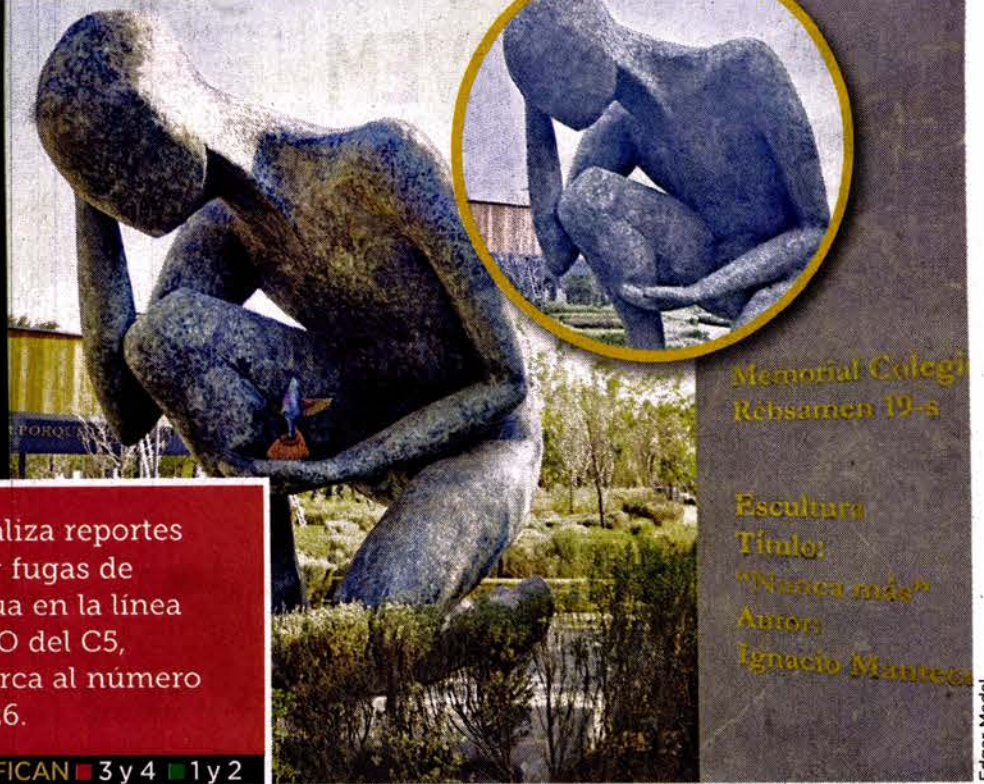
Memorial Colegio Rébsamen 19-s

Una figura de ave que había sido robada del Memorial del Colegio Rébsamen, en Coyoacán, fue recuperada. La sustracción ocurrió en septiembre de 2024; desde entonces, no se reportaron detenciones por este hecho.