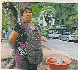
YARETZY M. OSNAYA. EL UNIVERSAL

“Para Starbucks, la seguridad de nuestros colaboradores, clientes y comunidades a las que servimos es nuestra máxima prioridad”, dijo el establecimiento. ●