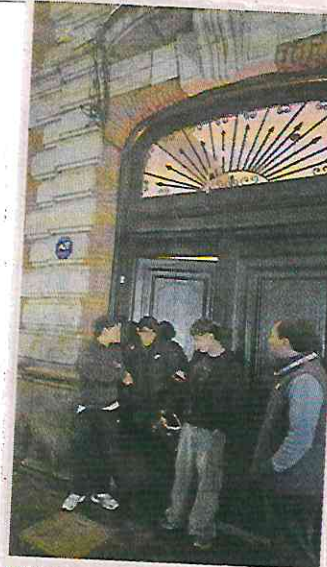
■ Ayer, personal de la Alcaldía acudió a Versalles 94 ante los reportes vecinales.

“Las fiestas privadas empezaron desde la pandemia, en donde, en pleno encierro