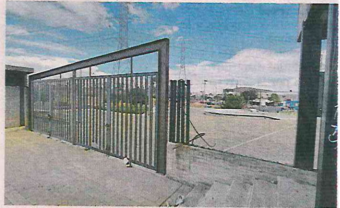
■ Los accesos al lugar están cerrados, por lo que vecinos optan por ingresar a través de los huecos en las bardas.