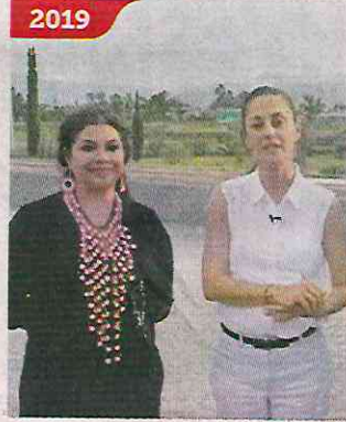
2019 ■ Brugada y Sheinbaum visitaron el parque para anunciar su renovación.

A cinco años, los accesos al parque, el más grande en el oriente de la Capital, se encuentran clausurados y vecinos optan por ingresar