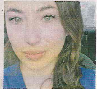
La doctora no presentaba signos de violencia.

La anestesióloga sería originaria de Chihuahua.