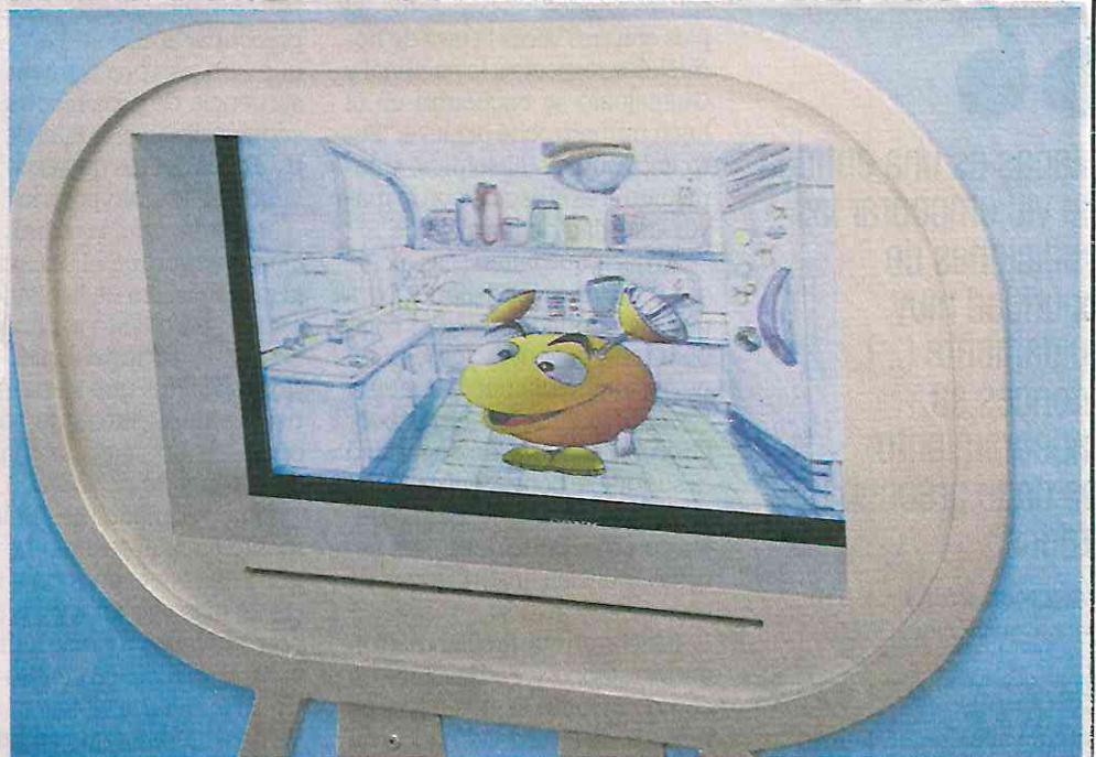
Este personaje de color amarillo, procedente del planeta Antenopolis, es controlado por especialistas y no habla con adultos, por lo que crea confianza en los niños.

De cada 10 niños que hablan con Antenas, ocho dan una declaración sustancial”