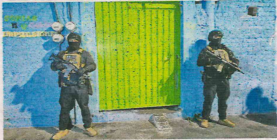
Capturan a cuatro hombres y una mujer con 853 dosis de aparente droga, celulares y dinero en efectivo

Luego de intenso trabajo de investigación elementos de la Secretaría de Seguridad Ciudadana de la Ciudad de México llevaron a cabo dos ordenes de cateo en domicilios ubicados en la alcaldía Iztapalapa, donde se logró la detención de cuatro hombres y una mujer, además de 853 dosis de aparente droga, teléfonos celulares y dinero en efectivo.