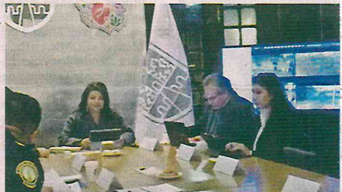
La funcionaria acudió por primera vez al Gabinete de Seguridad y Justicia en el Antiguo Palacio del Ayuntamiento.

“A la población capitalina quiero reiterar nuestro compromiso de trabajar con todo nuestro empeño, conocimiento y entusiasmo para garantizar el acceso a la justicia en igualdad de condiciones”.