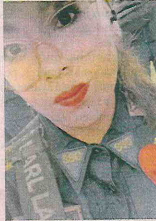
Una agente de la SSC murió en un accidente en moto.