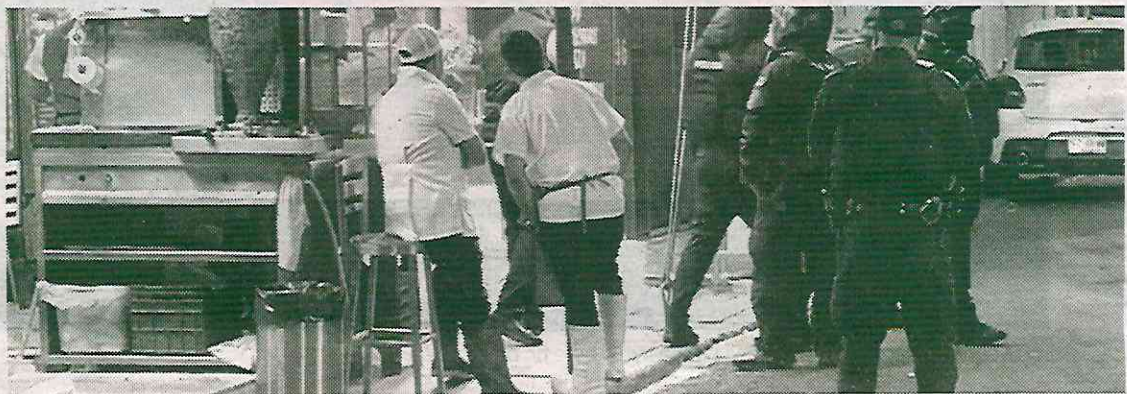
Le despacharon una lluvia de balas

Finalmente, la Fiscalía capitalina inició una carpeta de investigación para dar con los agresores para que rindan cuenta con las autoridades y que este delito no quede impune.