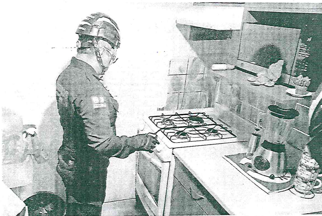
El jefe vulcano señaló que las personas pueden agendar una cita para que los bomberos acudan a los hogares a verificar la instalación de gas.

El director de Bomberos agregó que de los 55 mil 329 servicios totales que realizaron los bomberos, 4 mil 838 fueron incendios urbanos y 955 forestales. ●