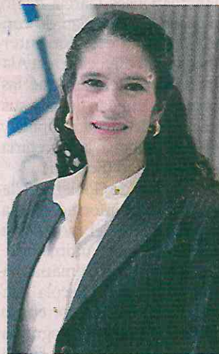
Bertha María Alcalde, Fiscal de la CDMX

Ha sido servidora pública con distintos puestos en la Secretaría de Seguridad y Protección Ciudadana, la Comisión Federal para la Pro-