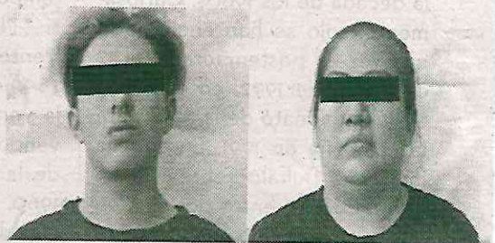
Todas unas fichitas

Además, se les incautaron 11 cargadores para armas largas, 16 cartuchos de diferentes calibres, un silenciador, un inhibidor de señal con 25 antenas y fajos de billetes.