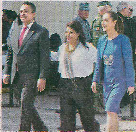
Para erradicar la violencia