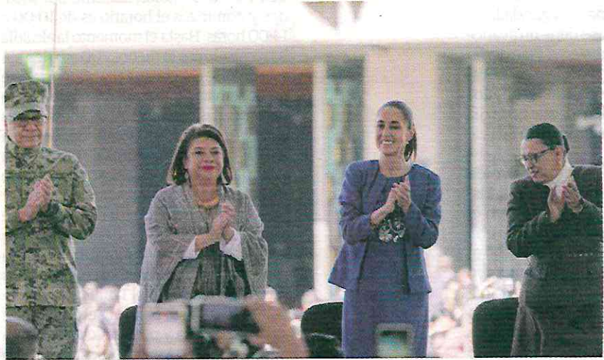
LA PRESIDENTA con la Jefa de Gobierno y los titulares de Marina y Segob, ayer.

LA PRESIDENTA ratifica su compromiso con la construcción de la paz en nuestro país; con artefactos bélicos "no se resuelven conflictos, se agravan", dice la Secretaria de Gobernación