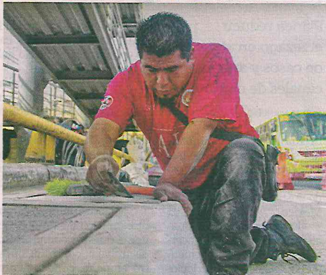
■ La construcción de la estación se encuentra en su última fase.

derable, y en próximos días la inauguraremos junto con ustedes”.