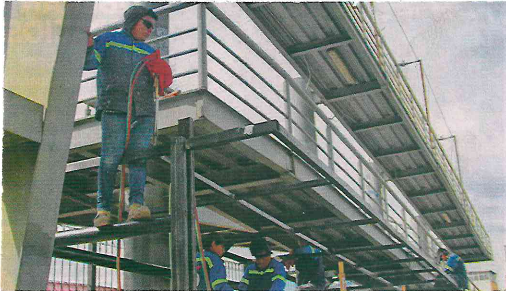
1 La estación atenderá a 25 mil usuarios que habitan en la zona.