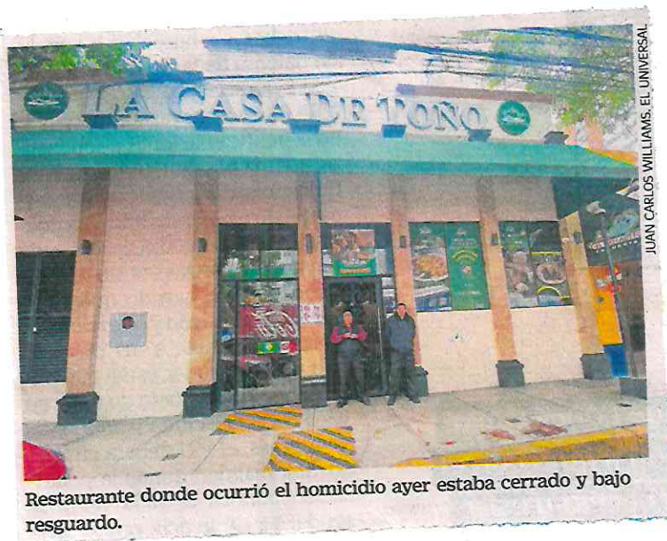
Restaurante donde ocurrió el homicidio ayer estaba cerrado y bajo resguardo.

El ministerio público de la Fiscalía capitalina lo presentó ante un juez, sin embargo, logró su libertad, hasta que el jueves que sicarios lo ejecutaron en la colonia Anáhuac. ●