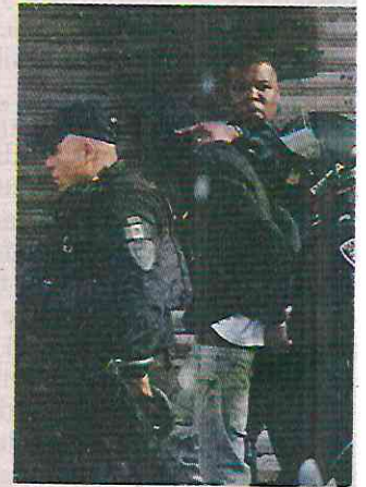
■ Los sospechosos fueron llevados al Ministerio Público.

Dos sujetos, quienes presuntamente se dedicaban al narcomenudeo, fueron detenidos en la Colonia San Pedro Apóstol, en Tlalpan.