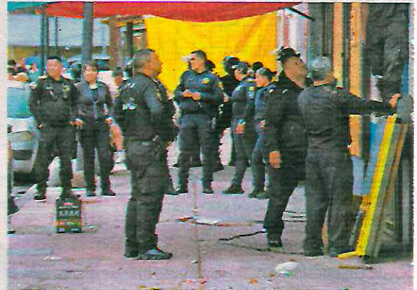
Se reportó un tiroteo y una persecución de los presuntos implicados; hallan presunta droga y armas

Se llevó a cabo un operativo en varias vecindades, tras el reporte de personas armadas; nueve fueron detenidas, entre ellas una mujer, quien es hermana del presunto jefe de Los Sinaloa