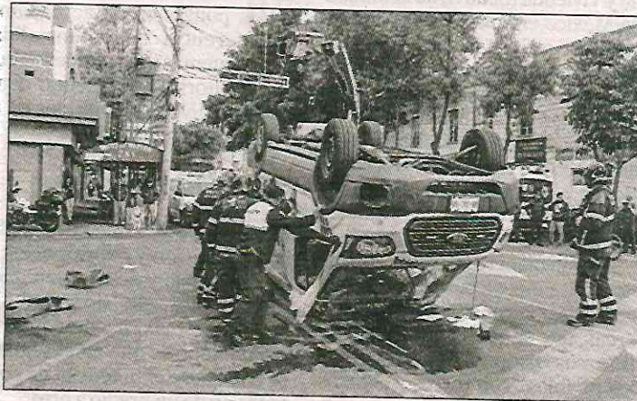
▲ La ambulancia quedó sobre el asfalto en el cruce de las calles José T. Cuéllar y 5 de Febrero.

Al chofer de la camioneta que se encontraba dentro de la unidad lo diagnosticaron con contusión simple, sin embargo, fue atendido en el lugar.