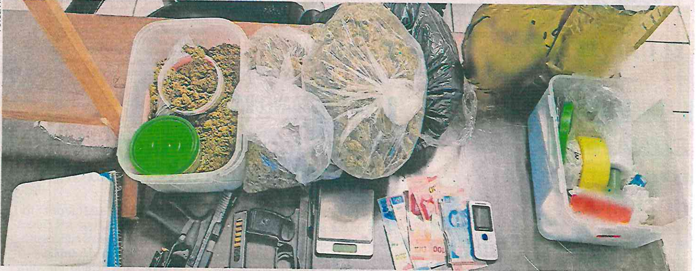
La SSC aseguró armas de fuego y bolsas de marihuana mediante un operativo realizado por tierra y aire en la colonia Morelos.