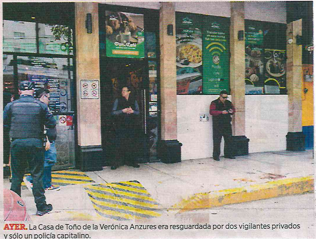
AYER. La Casa de Toño de la Verónica Anzures era resguardada por dos vigilantes privados y sólo un policía capitalino.

El venezolano se desvaneció con medio cuerpo