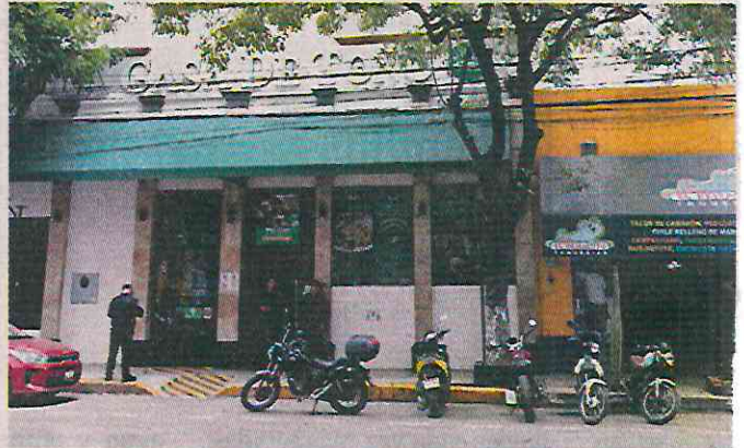
■ Los clientes que llegaban se quedaron con el antojo.