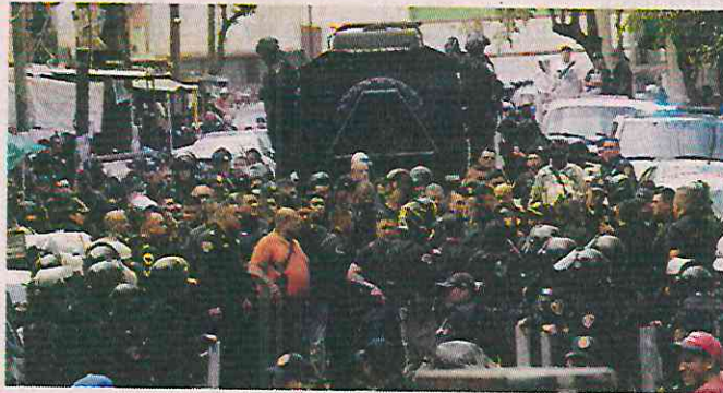
■ Cientos de policías capitalinos ingresaron a tres inmuebles ubicados en distintos puntos de la Colonia Morelos.

Como resultado, cinco personas fueron sometidas, entre ellas una mujer, y se decomisaron dos armas, 12