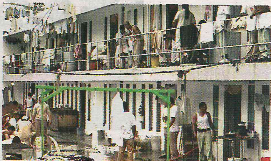
El aumento de espacio no ha sido constante

CIUDAD DE MÉXICO. - Las cárceles federales en la Ciudad de México están al borde del colapso, pues en los últimos seis años han estado de un 13 a 5 por ciento de llenar su capacidad. De acuerdo con la Información Estadística Penitenciaria Nacional, 2018 cerró a un 6.6 por ciento de abarcar toda la capacidad para la que fueron diseñados estos centros penitenciarios, y para junio pasado dicho porcentaje fue de