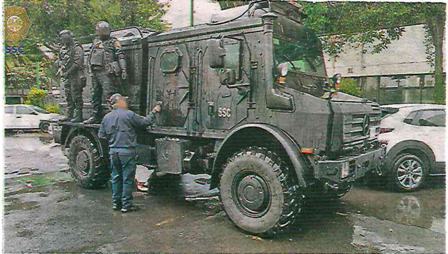
Intensa movilización por parte de elementos de la Secretaría de Seguridad Ciudadana (SSC) se dio en el barrio bravo

Por lo anterior, los hombres de 16, 18, 19, 21, 24, 39, 41 y la mujer de 34 años de edad, fueron detenidos, informados de sus derechos de ley y, junto con lo asegurado, fueron puestos a disposición del agente del Ministerio Público correspondiente, quien definirá su situación jurídica e integrará la carpeta de investigación del caso, para realizar las indagatorias subsecuentes.