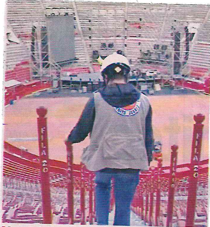
■ De acuerdo con la demarcación, el establecimiento tendrá revisiones constantes de las autoridades capitalinas.

Mendoza detalló que los inmuebles deben contar obligatoriamente con un programa de Protección Civil y que los vecinos también pidieron que se vigile la actividad de franeleros en la zona, así co-