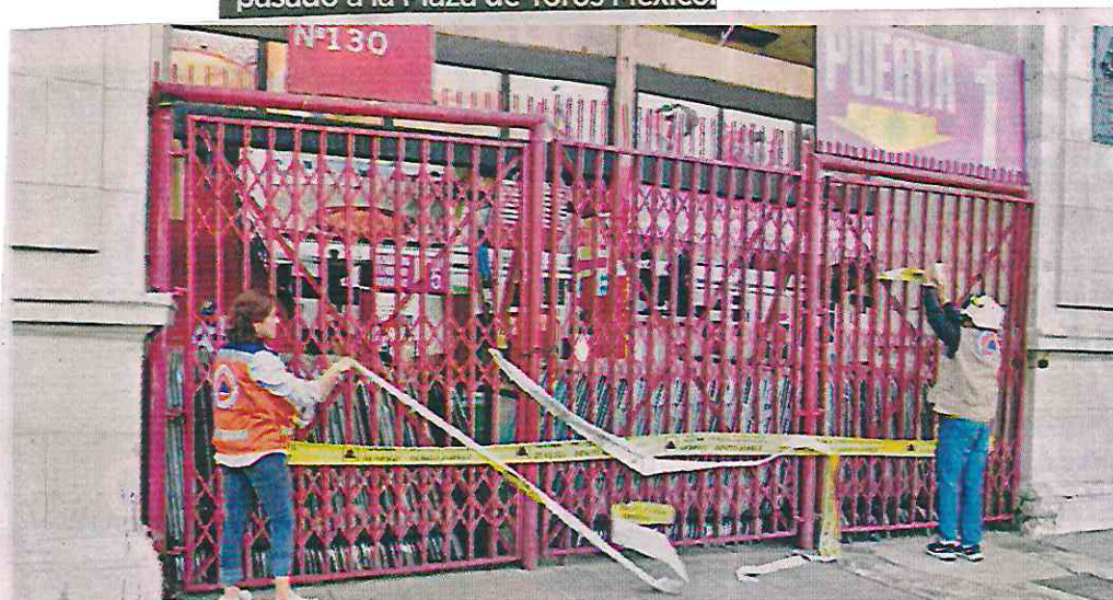
Personal de la Alcaldía Benito Juárez retiró ayer los sellos de clausura en la Plaza de Toros.

Personal de la Alcaldía Benito Juárez retiró los sellos de suspensión impuestos el fin de semana pasado a la Plaza de Toros México.