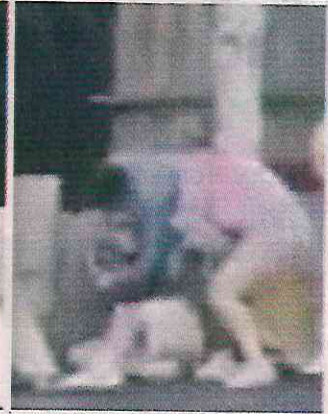
EN VIDEO. El joven primero golpea varias veces a un vendedor. Al final, su compañera lo ayuda.