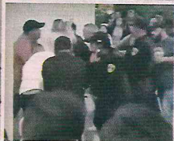
Cuando entre cuatro lo tundieron hasta dejarlo en el suelo, la alumna lo cubrió con su cuerpo.