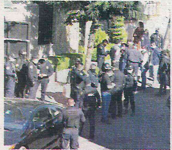
La alcaldía no ha intervenido en estos delitos

NO SON LOS PRIMEROS Sin embargo, comerciantes del