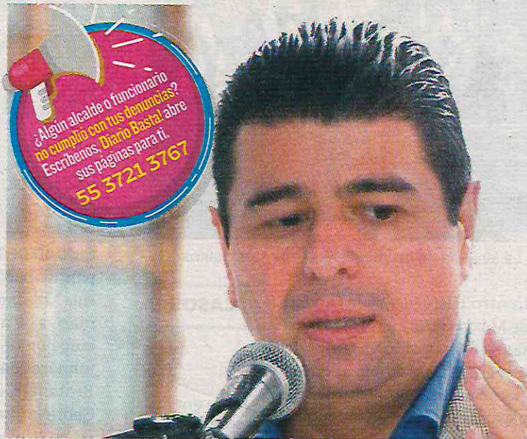
El dirigente enfrenta varios escándalos en su cargo público