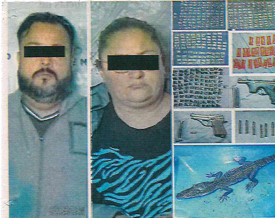
El hombre de 41 años de edad y la mujer de 46 fueron informados de sus derechos y, junto con lo asegurado, quedaron a disposición