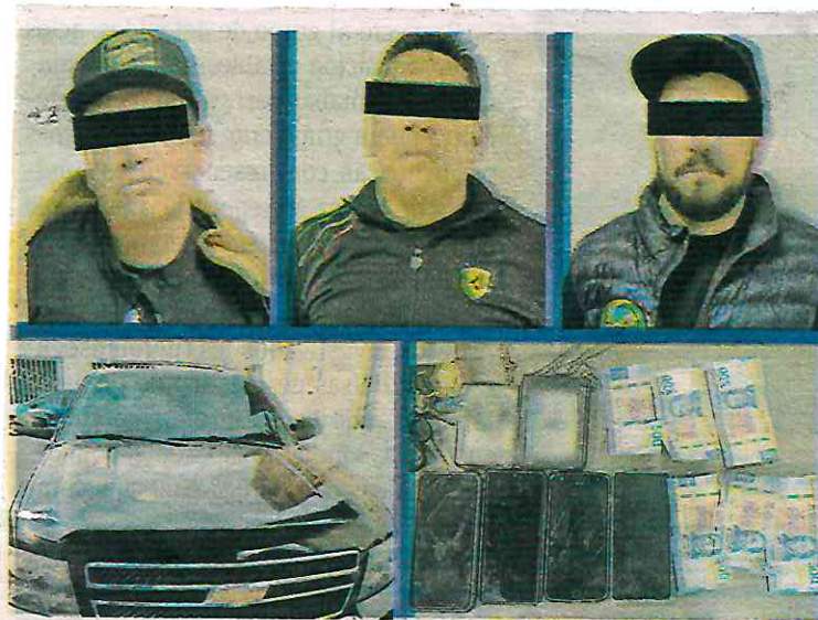
A los acusados les aseguraron celulares, dos porta credenciales con insignias de una institución de justicia y dinero /CORTESÍA: SSC, CDMX.

Los detenidos se identificaron con credenciales de una institución de procuración de justicia, pero fueron reconocidos plenamente por los denunciantes