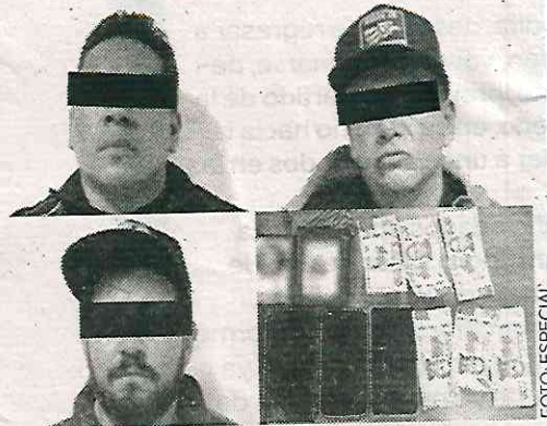
Les cayó la voladora

Tras una revisión, se les hallaron 4 teléfonos celulares, dos porta credenciales con insignias de una institución de justicia y el dinero en efectivo.