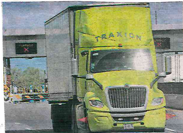
Actualmente se ha visto un incremento de vehículos eléctricos e híbridos en la industria logística para transporte de carga

En 2021, los combustibles utilizados en actividades de transporte representaron 32 por ciento de las emisiones de dióxido de carbono