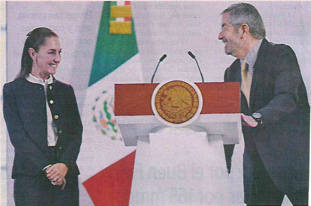
En la mañana de la Presidenta Claudia Sheinbaum, el Canciller Juan Ramón de la Fuente explicó que el modelo humanitario de migración es perfectible, pero funciona.

“Este dato es realmente muy importante porque demuestra que el modelo