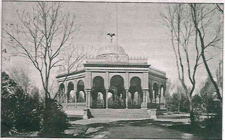
► El kiosco Morisco en la alameda de Santa María la Ribera, en 1912.