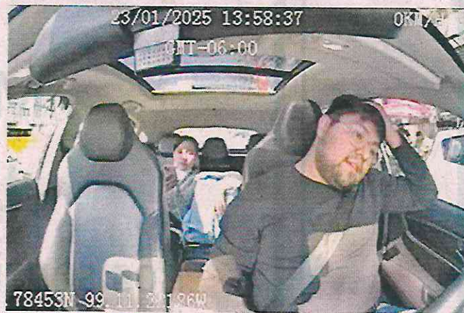
SIN RETORNO. La cámara instalada en el auto del chofer grabó la falsa acusación que hizo la pasajera, de unos 35 años.