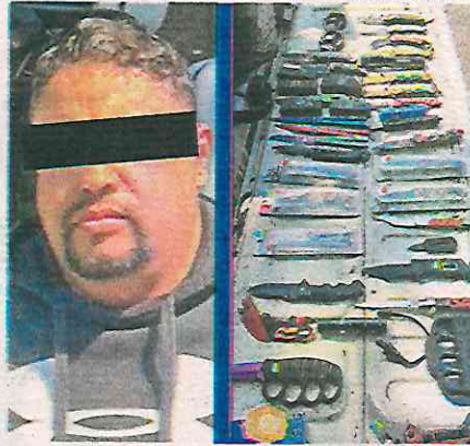
Detenido por comercializar objetos para agredir

Por tal motivo, el sujeto fue detenido y en apego a los protocolos de actuación policial, le realizaron una revisión preventiva, tras la cual le aseguraron 28 cuchillos de diferentes tamaños, ocho dispositivos para descarga eléctrica conocidos como taser y tres puños de hierro también conocidos como bóxer, los cuales manifestó