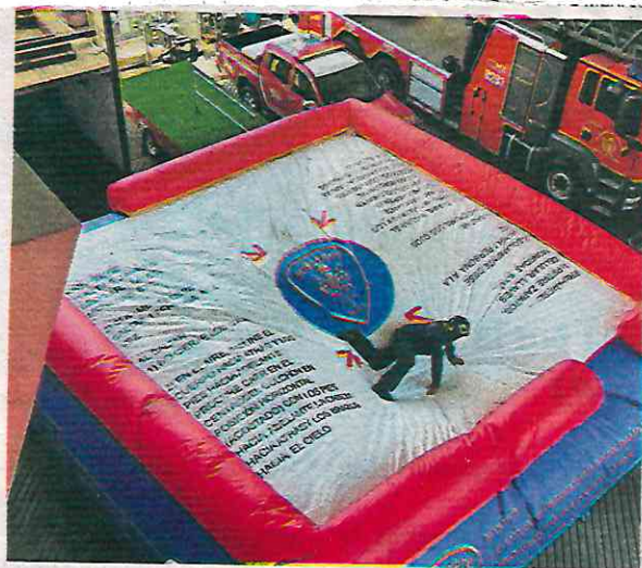
Este colchón resiste caídas de hasta 21 metros

En febrero otro hombre de alrededor de 40 años intentó aventarse en plena Plaza de la Constitución. En minutos elementos de la Secretaría de Seguridad Ciudadana y el Cuerpo de bomberos atendieron el rescate para evitar que se quitara la vida. En junio, un hombre murió, tras arrojararse de un sexto piso.