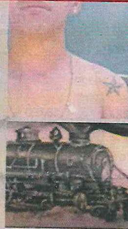
■ Tatuajes usados por el Tren de Aragua.