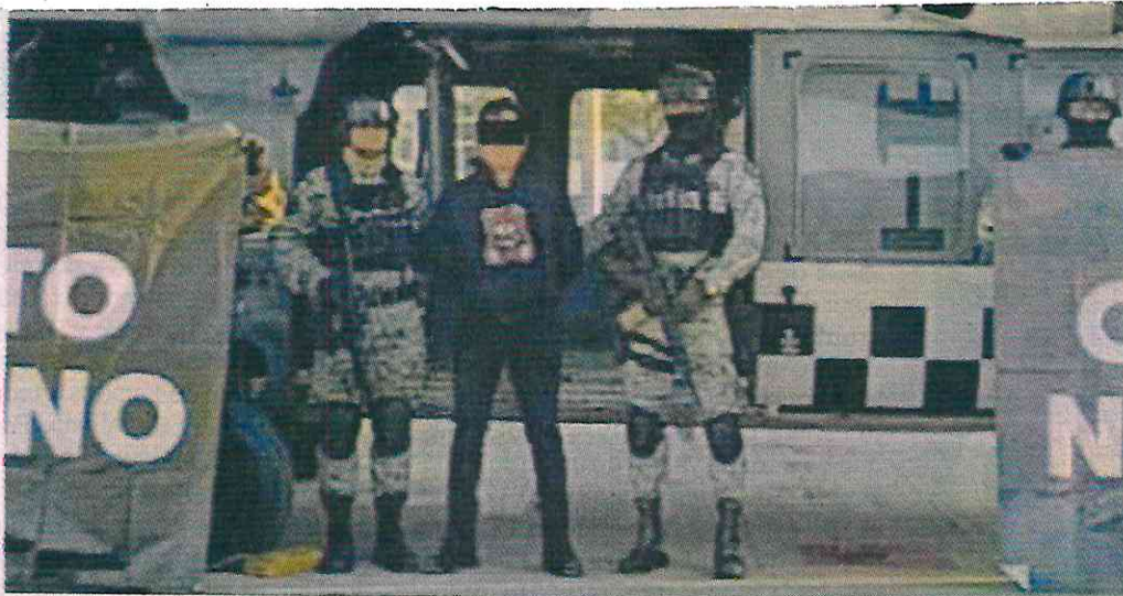
■ Elementos del Ejército y de la Guardia Nacional capturaron a un mandó de "Los Chapitos" en un operativo desplegado en el poblado de Jesús María, en Culiacán.

"Los Chapitos" mantienen desde septiembre pasado una cruenta narcoguerra contra la facción de "La Mayiza" en busca de hacerse del control del Cártel de Sinaloa, la cual ha dejado cientos de muertos, constantes ataques armados y narcobloqueos, y ha afectado la economía de la entidad.