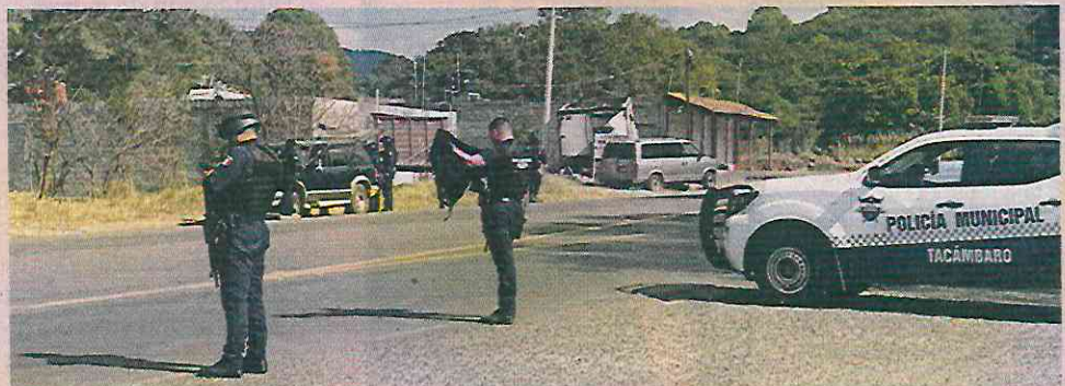
Se registró una balacera en la carretera Morelia-Quiroga, a 40 kilómetros de Zirahuén.