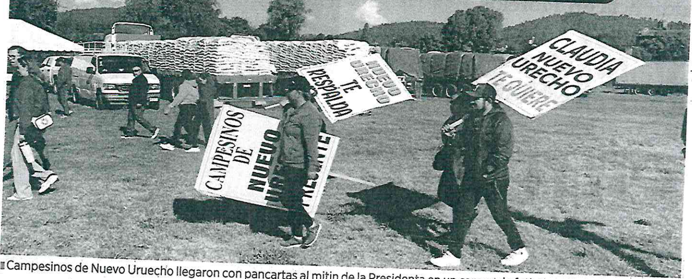
■ Campesinos de Nuevo Urecho llegaron con pancartas al mitin de la Presidenta en un campo de fútbol en Zirahuén, Michoacán.

CRÓNICA: 'NO QUERÍAN QUE NOS QUEJÁRAMOS'