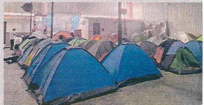
En el albergue ‘Juventud 2000, ubicado en el centro de Tijuana, los migrantes no tienen claro qué harán.

“Nos pagan poco, nos contratan para recoger basura o en la albañilería, pe-