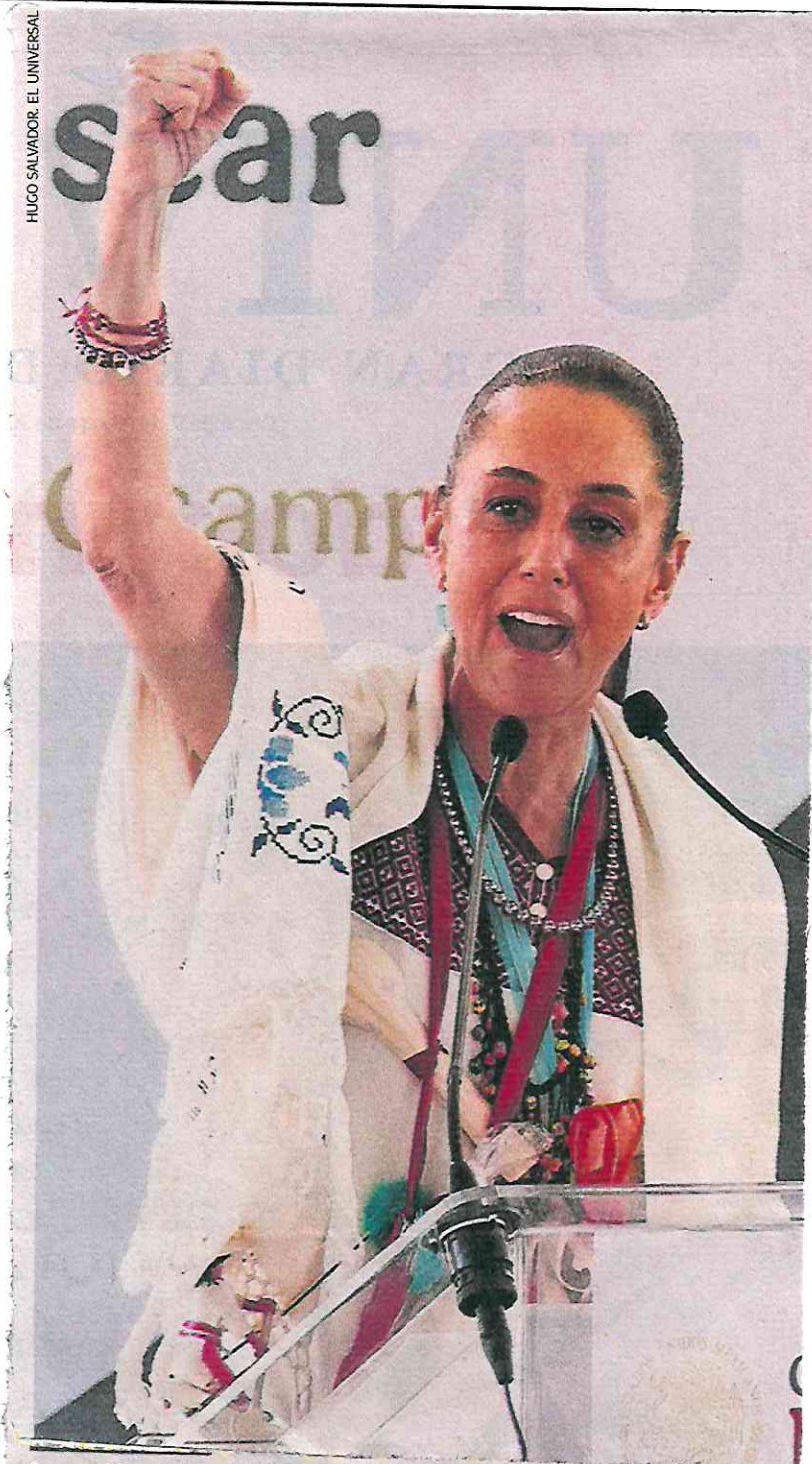
La presidenta Claudia Sheinbaum encabezó el arranque del programa nacional de Fertilizantes para el Bienestar, en Salvador Escalante, Michoacán.