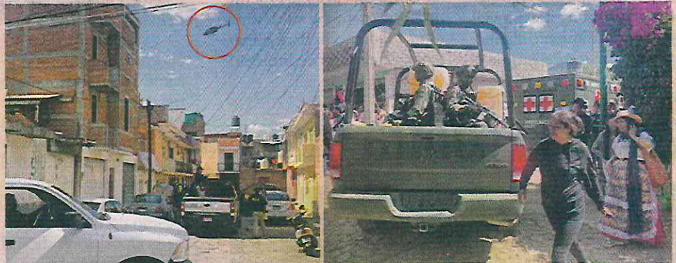
Agentes de la Fiscalía de Michoacán con armas largas realizaron una búsqueda en una calle cerrada de Zirahuén. Además, un avión sobrevoló la zona.

Estos fueron algunos de los eventos que se registraron luego de la visita presidencial en Zirahuén y alrededores: