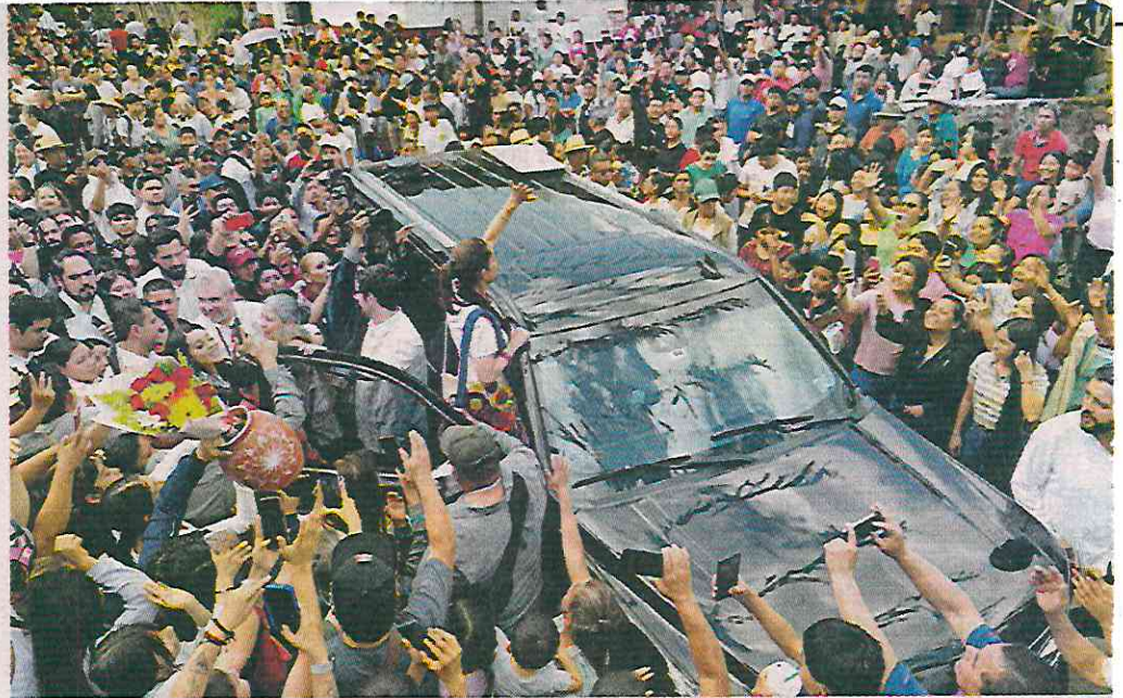
La Mandataria se detuvo a saludar a los asistentes que le tomaron fotografías.

Contra su estómago apretaba un paquete de folios amarillos con peticiones y denuncias que pensaba entregar a Sheinbaum: el lago de Zirahuén le descar-