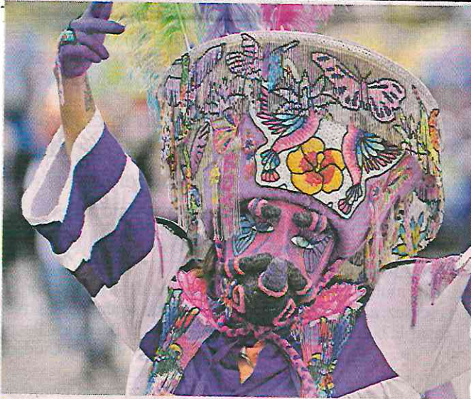
■ Más de 4 mil 500 artistas y 74 comparsas recorrieron una parte de Paseo de la Reforma, hasta llegar al Zócalo.