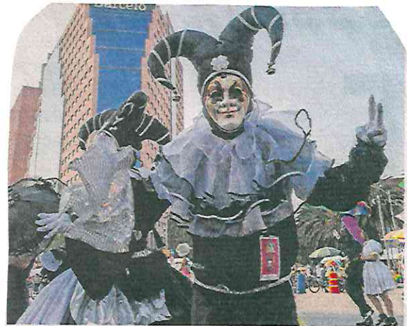
Entre colores y vestuarios llamativos los contingentes marcharon durante una hora y media para llegar al Zócalo.