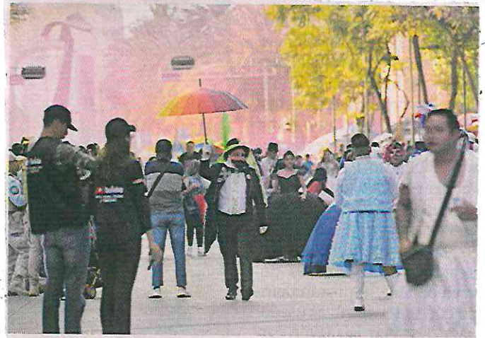
■ Este fue el segundo año que se llevó a cabo el Carnaval de Carnavales, organizado por pueblos y barrios originarios.