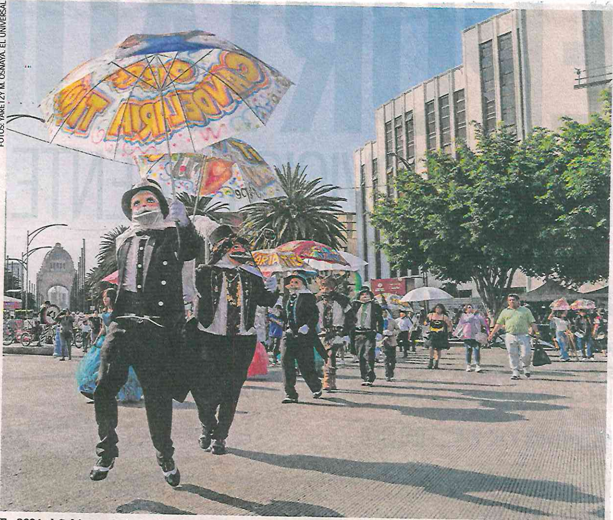
En 2024 el Gobierno de la Ciudad de México consideró a los carnavales como Patrimonio Cultural Inmaterial; son eventos que enamoran y llenan de alegría a los habitantes.