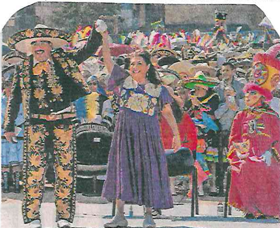
La jefa de Gobierno, Clara Brugada, afirmó que los pueblos originarios "llevan años resistiendo".