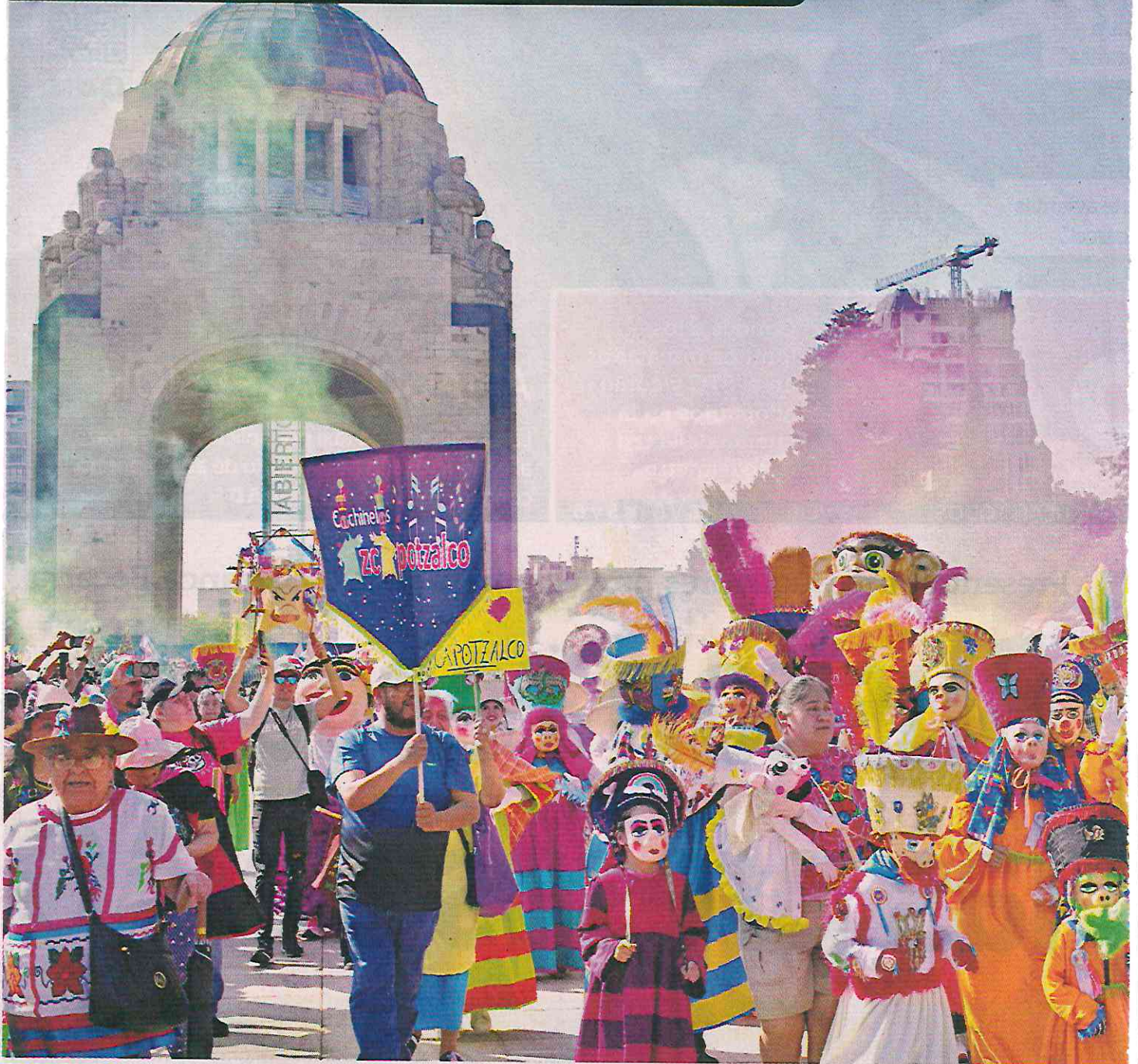
EL EVENTO. De la Plaza de la Revolución partieron miles de artistas y músicos que compartieron sus tradiciones.