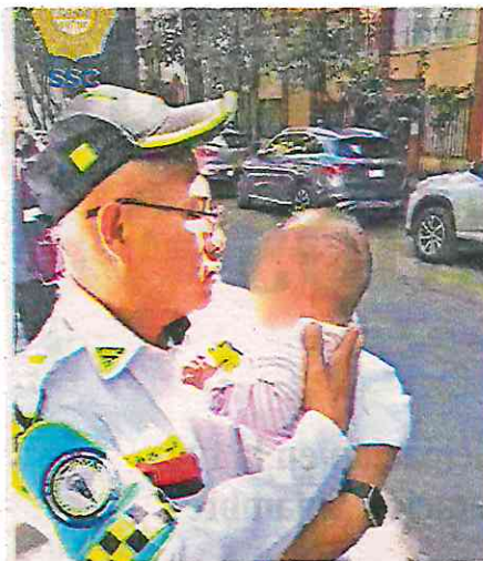
Los policías atendieron el llamado de una ciudadana quien vio al bebé solo