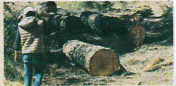
· Sin autorización por la autoridad correspondiente

Sin embargo, cabe precisar que, no será sancionado el uso de leña o de material leñoso proveniente de vegetación forestal sin ningún pro-