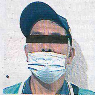
Los detenidos amagaban con rayar autos si no les pagaban.

semana que la remisión de franeleros ante el juez cívico se ha incrementado en más de 500% y que se ha detectado que muchos de los infractores tienen antecedentes penales o están vinculados a delitos y casos en curso.