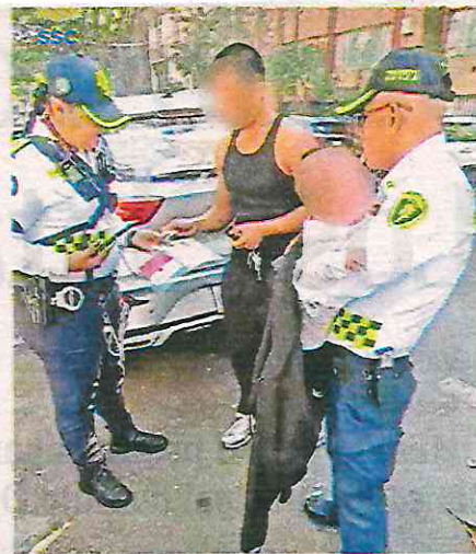
El hombre acreditó la paternidad del bebé y se pudo retirar con su hijo