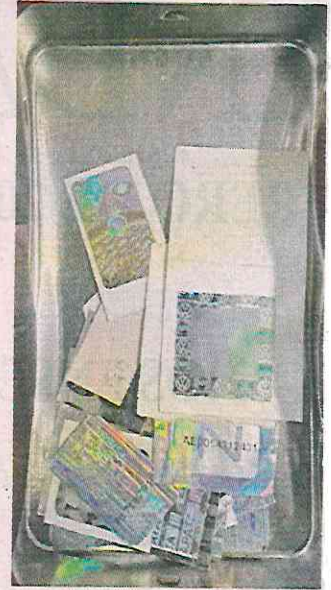
■ También encontraron credenciales del INE y cédulas profesionales falsas.

También se decomisó el equipo de cómputo y oficina con el que se elaboraba la documentación apócrifa, además de tres celulares.