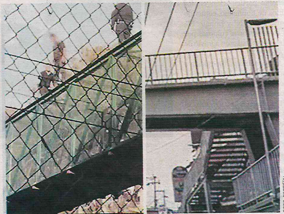
Los elementos convencieron al hombre de no tirarse al vacío

Había decidido colgar los tenis y dejar este mundo por problemas familiares y económicos