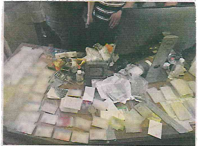
■ En un inmueble de la Calle Palma, en el Centro Histórico, se falsificaban tarjetas de circulación, hologramas, entre otros.