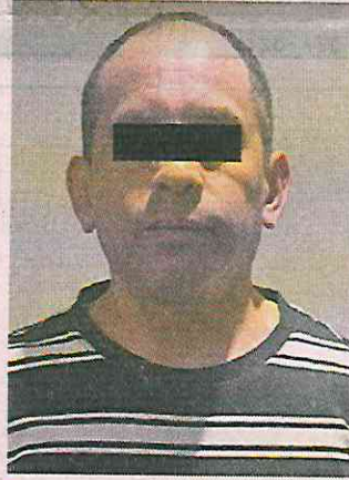
■ Tres sospechosos fueron detenidos durante el cateo.

marca de agua para la portación de arma de fuego, 200 paquetes de micas con logos de diferentes instituciones, 30 acetatos de hologramas de la Ciudad, 100 diferentes hologramas, 200 impresiones de sellos de la SEP y 55 micas para identificaciones oficiales.