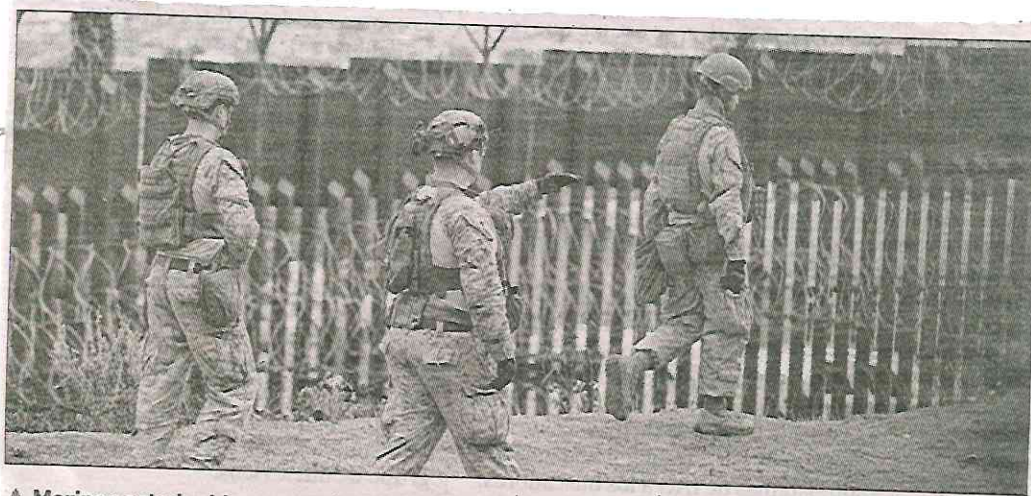
▲ Marines estadounidenses se despliegan a lo largo de la frontera entre Estados Unidos y