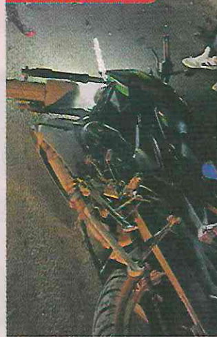
El piloto de una motocicleta fue embestido por un tráiler.

alrededor de 30 años, circulaba por Calle Olivos, en la Colonia Sauces 2, cuando el conductor de un camión pesado, presuntamente, no advirtió su presencia y la atropelló, pasando las llantas por la cabeza de la mujer, de quien se desconoce su identidad. El camionero se dio a la fuga.