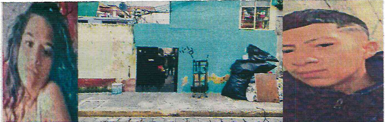
En esta vivienda, donde vivía la pareja, encontraron el cadáver de Amanda