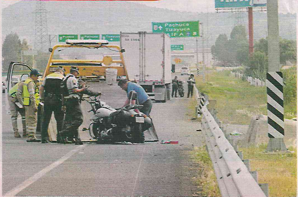
Un tráiler arrolló con todo y su moto a un hombre, de entre 30 y 35 años, en Tecámac.