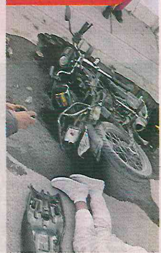
Un vehículo pesado atropelló a una joven motociclista.

sobre la carretera Lechería- Texcoco, en la Colonia Jardines de Morelos, en Ecatepec.