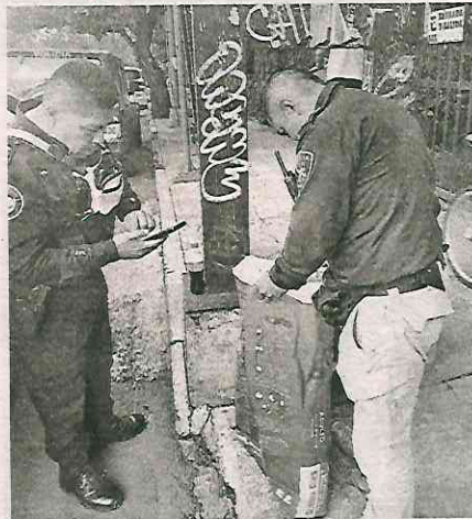
Una serpiente cincuate quedó resguardada en un costal

22/pol el manejo de fauna silvestre, quienes recibieron una serpiente cincuate a la que resguardaron en un costal y la trasladaron a sus instalaciones, ubicadas en la alcaldía Xochimilco, donde será valorada por un médico veterinario zootecnista para su posterior liberación en su hábitat natural.