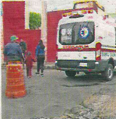
Paramédicos atendieron a la niña de 5 años; sus lesiones fueron leves.

Del automovilista involucrado en los hechos no se dio a conocer si permaneció en el sitio o escapó.