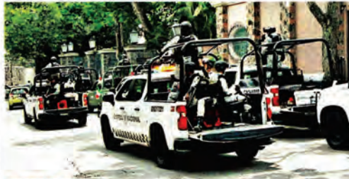
ATAQUE EN MORELOS. Personal de la Guardia Nacional fue atacado ayer por sujetos armados, a unos metros del Colegio de Bachilleres número 2, en Jiutepec, Morelos.

Las reclamaciones fueron turnadas ayer al Ministerio Al-