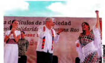
ANDRÉS Manuel López Obrador, Claudia Sheinbaum y Mara Lezama, ayer.

PRESENTA 2.º informe; destaca impulso en turismo con tren que conectará con AIFA; se someterá a revocación, adelanta. pág. 12