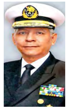
RAYMUNDO PEDRO MORALES ANGELES SECRETARÍA DE MARINA