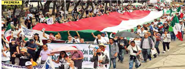
PRIMERA REFORMA AL PODER JUDICIAL DE LA FEDERACIÓN