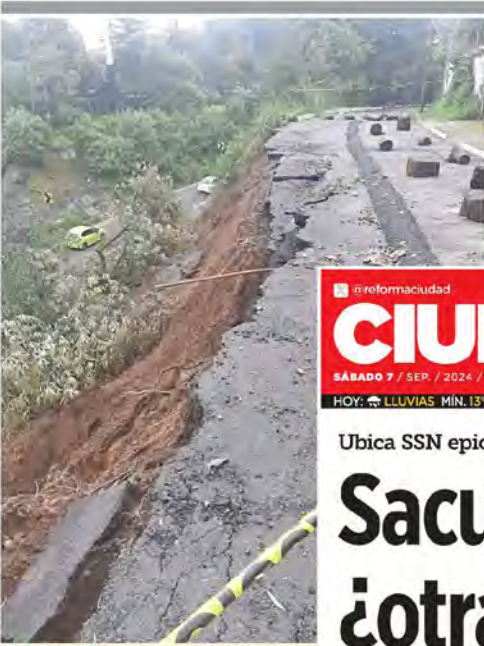
EMERGENCIA. El deslave se registró la noche del jueves, durante las lluvias.