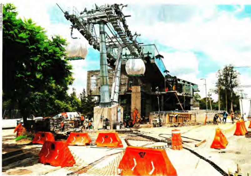
En las seis estaciones de la Línea 3 del Cablebús continúan los trabajos a marchas forzadas para entregar la obra antes de que termine septiembre.

Editora: Johana Robles Coeditora: Phénixlope Aldaz Tel: 55 5709 133 Ext: 4561 y 4526