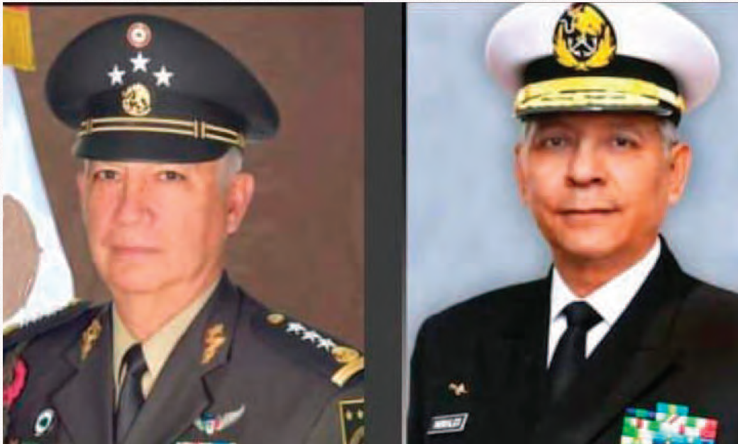
El general de división Ricardo Trevilla Trejo será el secretario de la Sedena y el general Raymundo Pedro Morales dirigirá la Semar.

La presidenta electa indicó que el general de división Ricardo Trevilla ocupará la titularidad de la Secretaría de la Defensa Nacional, en tanto que el general Raymundo Pedro Morales encabezará la Secretaría de la Marina