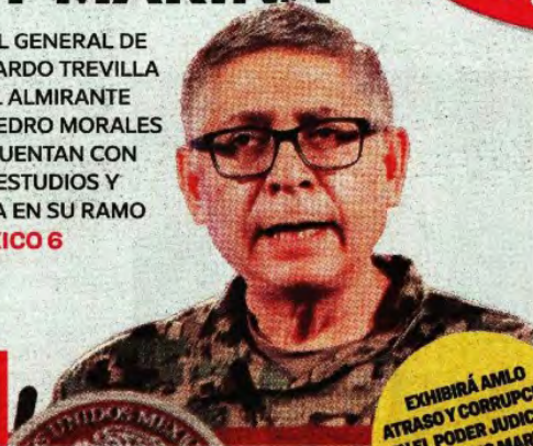
RICARDO SEVILLA LA CORTE DE LOS INCOMPETENTES MÉXICO 3

EXHIBIRÁ AMLO ATRASO Y CORRUPCIÓN EN EL PODER JUDICIAL. EL PRÓXIMO MARTES EN LA "MAÑANERA" MÉXICO 2