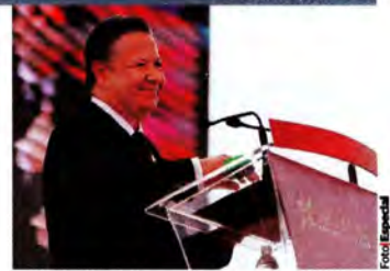
EL GOBERNADOR, ayer, durante su informe.

En 2019 fue liberado y se convirtió en testigo clave del caso bajo el alias de Juan ; en 2020 señaló a mandos del Ejército con la desaparición de normalistas, pero nunca aportó pruebas