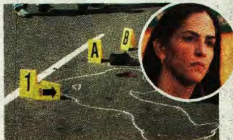
Presumió seguridad, pero no les cumplió a los habitantes