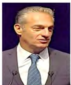
Carlos Slim Domit, ayer en el foro con becarios.

detonar crecimiento. "Nos encontramos en un momento histórico en el que la relocalización de empresas, la integración económica con América del Norte y el fortalecimiento de las cadenas de suministro están creando un entorno favorable para el crecimiento acelerado de México. "Con unidad nacional y Estado de derecho, estas dinámicas tienen un potencial enorme para generar un crecimiento fuerte y sostenido", afirmó.