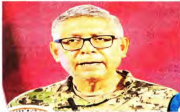
Con un perfil más administrativo que operativo, el almirante Raymundo Morales encabezará la Marina.