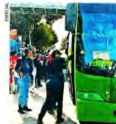
Para apoyar a usuarios, se estableció el servicio de RTP.

En apoyo a los usuarios se estableció servicio provisional de Pantitlán a Guadalupe y de La Par a Santa Marta y se habilitaron unidades de RTP.