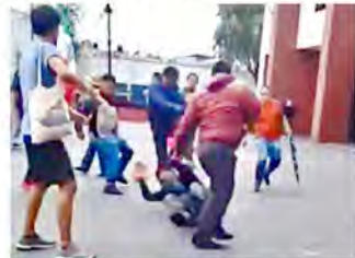
LA AGRESIÓN. Un grupo de activistas se enfrentaba en las inmediaciones de la sede de la Alcaldía cuando fue atacado.

"Habrá sanciones contra los policías", se le preguntó. "Lo que se derive de la reconstrucción de los hechos, muy minuciosa, finalmente