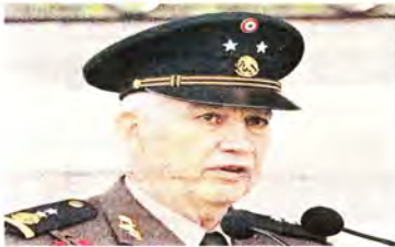
El general Ricardo Trevilla, próximo secretario de la Defensa, es cercano al actual titular del Ejército.