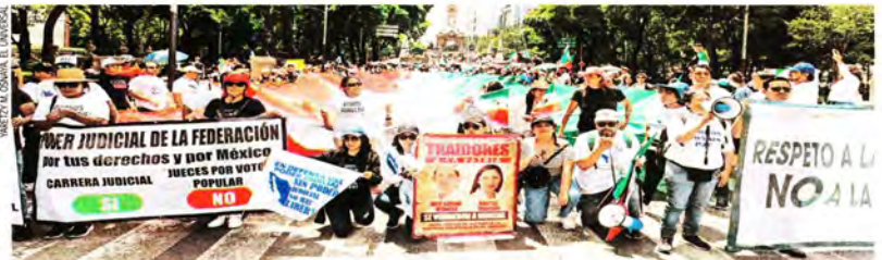
Con el despliegue de la Bandera Nacional, opositores a la reforma judicial marcharon hacia el Senado.