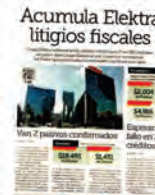
LAS DEUDAS. Grupo Elektra enfrenta ocho créditos fiscales.

El Presidente Andrés Manuel López Obrador ha presionado a la Corte en sus conferencias matutinas para agilizar la resolución de los juicios de Elektra.