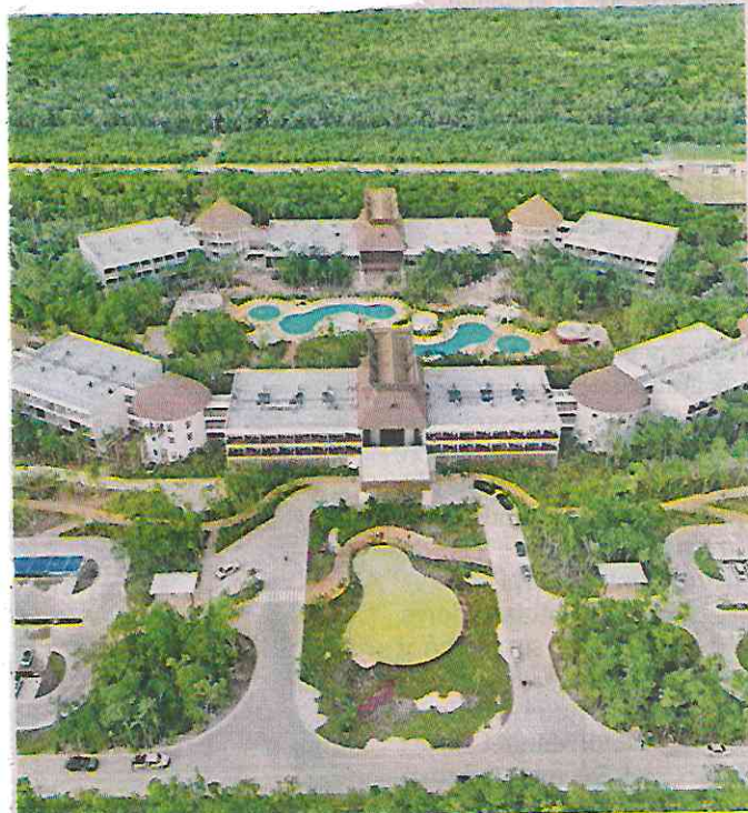
AMLO y Sheinbaum inauguraron el Hotel Tren Maya Tulum en QR que abarca 13 hectáreas y consta de 352 habitaciones.

Hasta ahora, el recorrido por el Tramo 5 Sur, impugnado varias veces por ambientalistas, había sido aéreo. Sin embargo, aún no está abierto al público.