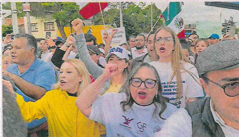
La ministra presidenta de la Suprema Corte, Norma Piña, marchó desde la avenida Eduardo Molina hasta la entrada de la Cámara de Diputados.

Dijo que todos sus votos y los fallos que ha emitido han sido a favor del pueblo. ●