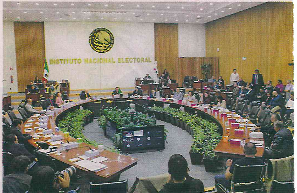
■ Durante la Sesión Extraordinaria del Consejo General, se aprobó la integración y presidencias de las comisiones permanentes y temporales para las elecciones del próximo año.

Los integrantes de estas comisiones estarán hasta septiembre de 2027, aunque la presidencia será rotativa en cada año.