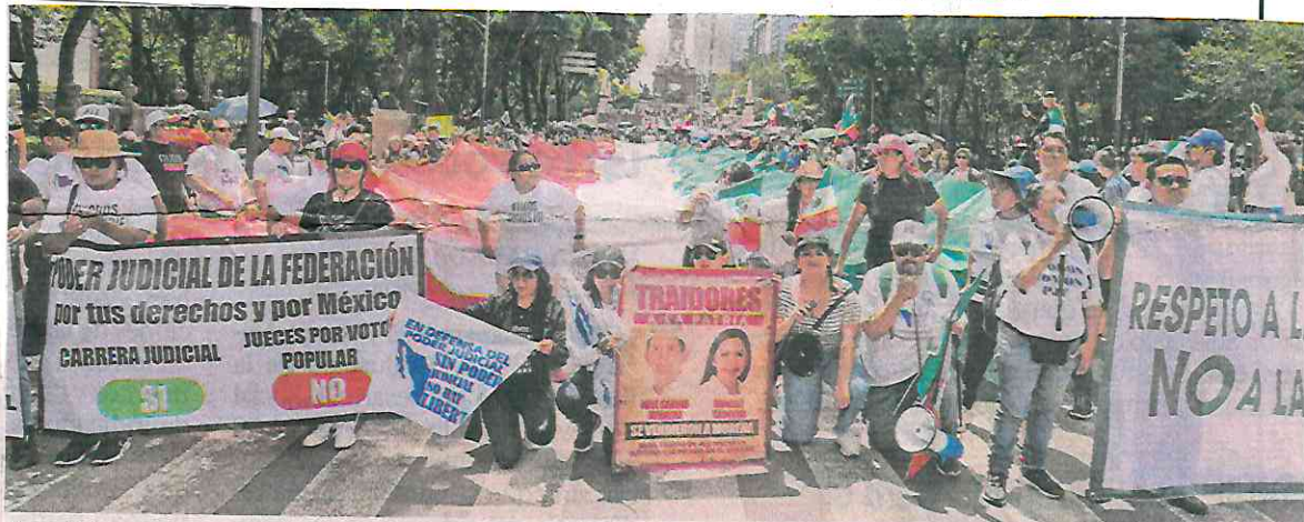
Con el despliegue de la Bandera Nacional, opositores a la reforma judicial marcharon hacia el Senado.

Magistrados, jueces y la base trabajadora del PJF intensificaron la presión para que los legisladores de oposición voten en contra de la reforma judicial del presidente Andrés Manuel López Obrador, que en los próximos días será discutida por la Cámara Alta.