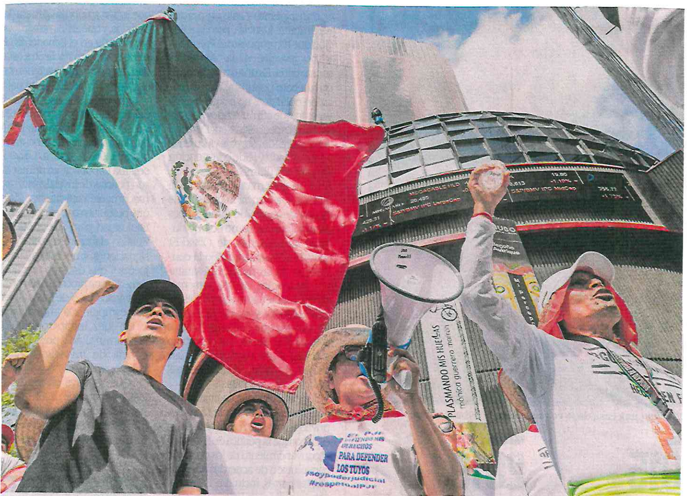
Más de 300 trabajadores de la Suprema Corte de Justicia de la Nación y del Poder Judicial adscritos a los circuitos judiciales de Oaxaca, Durango y Coahuila realizaron un mitin ante la Bolsa Mexicana de Valores, donde sentenciaron "juez votado, peso devaluado!".

Magistrados, jueces y trabajadores del PJF ofrecen su respaldo a legisladores del PRI, PAN y MC; anuncian una megamarcha para mañana y no descartan bloqueos en la Cámara Alta