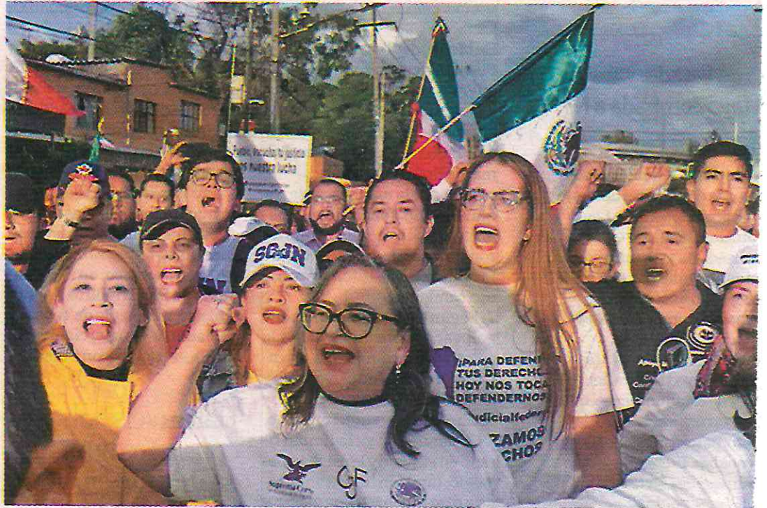
La ministra presidenta es arropada por manifestantes.

Asimismo, los trabajadores arrojaron a la ministra presidenta al unísono de “¡no estás sola!, ¡no estás sola!”.