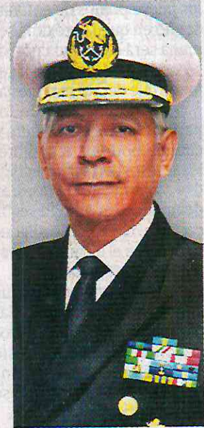
RAYMUNDO PEDRO MORALES ÁNGELES SECRETARÍA DE MARINA