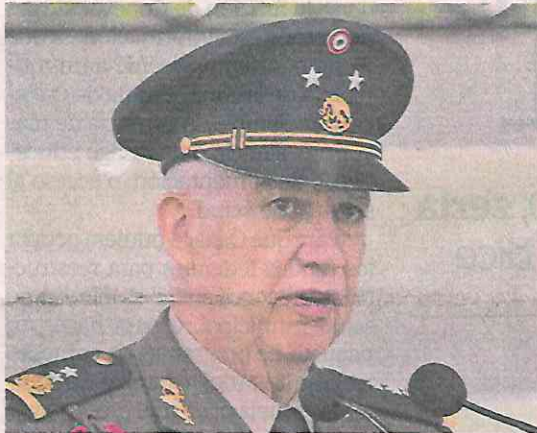
El general Ricardo Trevilla, próximo secretario de la Defensa, es cercano al actual titular del Ejército.