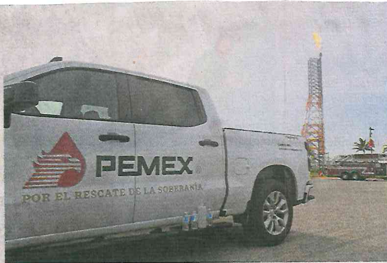
La excesiva deuda y el estancamiento en la producción han generado que degraden la calificación de la empresa, indicaron expertos.

con caer más conforme vence este año el equivalente a 64 mil 694 millones de pesos que tiene la petrolera en el mercado de deuda de la BMV, estimó la agencia.