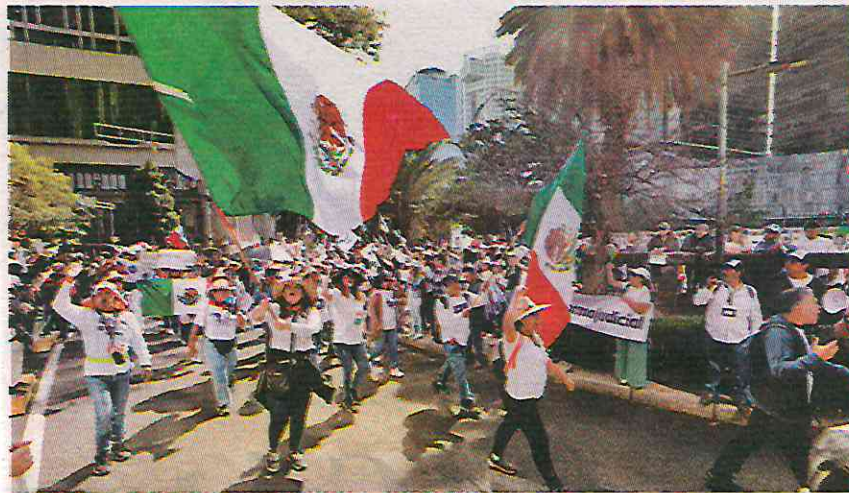
Protesta en CdMx contra la reforma judicial. JUAN C. BAUTISTA

E s probable que el ascendiente de Andrés Manuel López Obrador logre infligir a la Constitución el más grave golpe contra el régimen democrático. Tras la traición de los dos únicos senadores del PRD, ahora solo se requiere un voto opositor en el Senado para acabar con el régimen republicano de división de poderes. Pero, aunque se hiciera el milagro de la lealtad de los 43 senadores de oposición, la robusta mayoría legislativa de Morena da para ir sometiendo al Poder Judicial a través de la futura