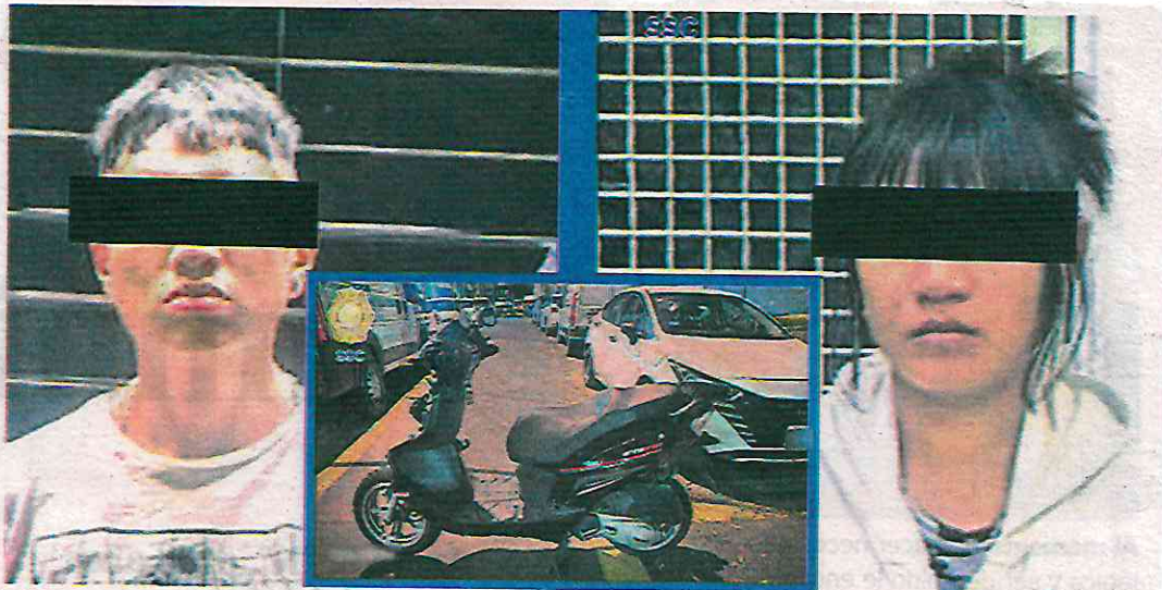
Al intentar huir tras presuntamente asaltar a un hombre fueron detenidos calles adelante