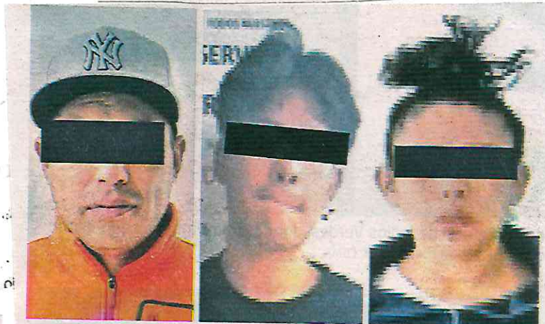
En diferentes operativos en la alcaldía Iztapalapa fueron detenidos con aparente droga

Por otra parte, policías sectoriales detuvieron a dos hombres más, el primero de ellos, un joven de 21 años, quien se encontraba al interior de un parque, ubicado en las calles 59 y 4, de la colonia Santa