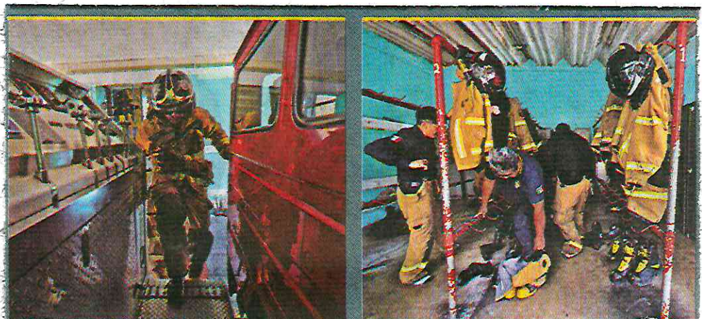
Los bomberos de la UNAM están listos para emergencias en menos de 20 segundos.

Los bomberos de la UNAM han estado presentes auxiliando a la población en emergencias como los sismos de septiembre de 1985 y 2017; la explosión en la antigua sede del Instituto de Investigaciones Biomédicas, y diversos incendios forestales en la Reserva Ecológica.