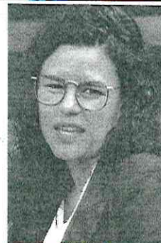
LUISA MARÍA ALCALDE PRESIDENTA DE MORENA