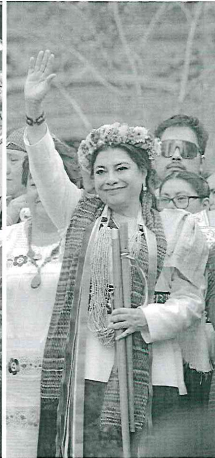
• RESPALDO. En su camino al Zócalo, fue cobijada por secretarios y capitalinos que le refrendaron su apoyo.