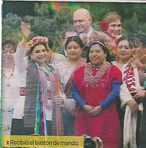
Recibió el bastón de mando.