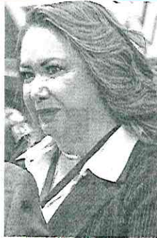
YASMÍN ESQUIVEL MINISTRA DE LA SCJN