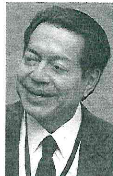
MARIO DELGADO SECRETARIO DE EDUCACIÓN PÚBLICA