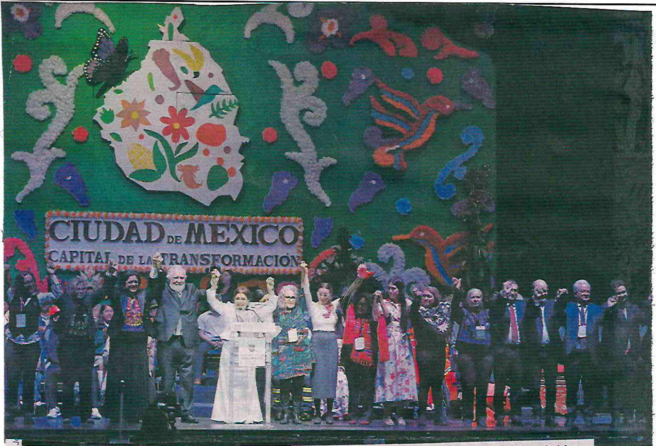
ARROPADA. En el Metropolitán (arriba), Brugada detalló las prioridades y primeras acciones de su Gobierno.