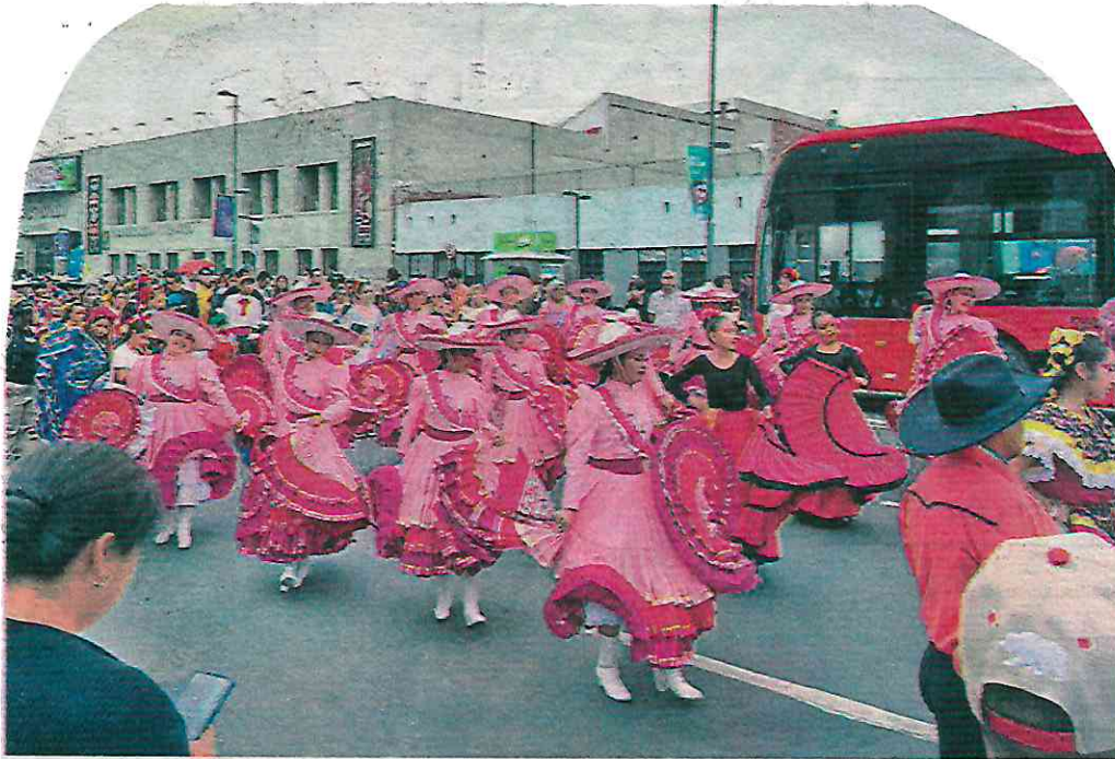
De diferentes formas, vecinos de las alcaldías Iztapalapa, Tláhuac y Azcapotzalco mostraron su apoyo a Brugada Molina