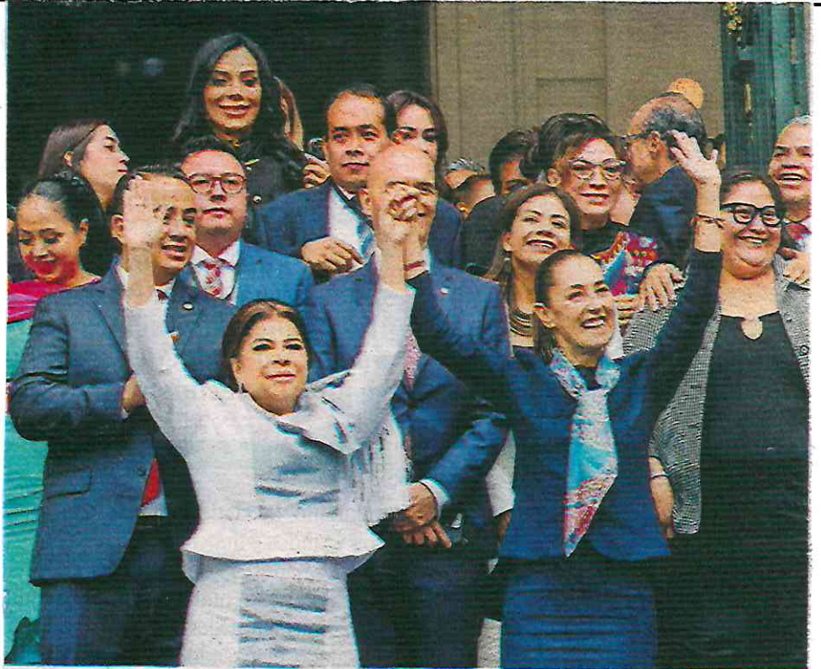
La presidenta, Claudia Sheinbaum, acompañó a Clara Brugada en el Congreso