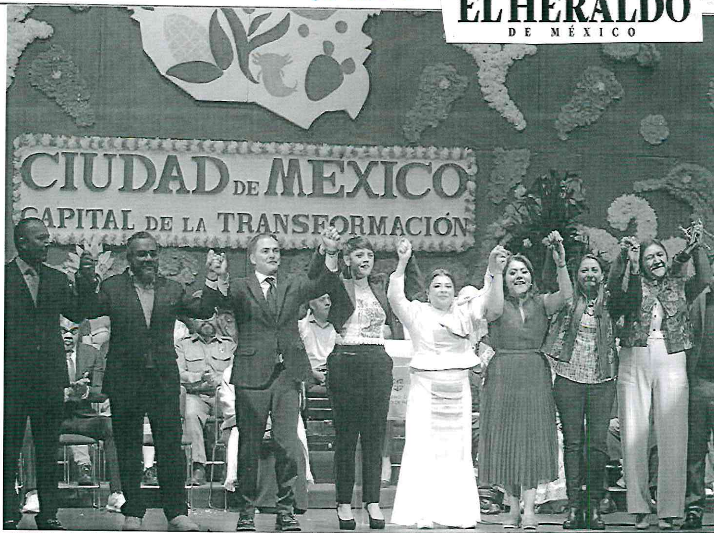
• UNIDAD. La jefa de Gobierno estuvo acompañada de 12 alcaldes y alcaldes, representantes de trabajadores, funcionarios y gobernadores electos; además, rindió protesta a su gabi-