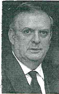
MARCELO EBRARD SECRETARIO DE ECONOMÍA

Trabajaré con mucha dignidad, pero también con firmeza; el gobierno será de puertas abiertas, de funcionarios que caminen y de acciones que mejoren la vida de las personas.