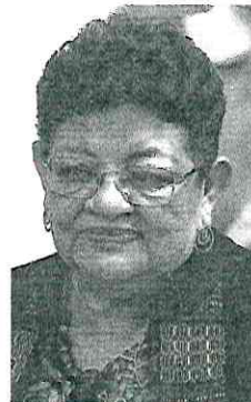
ERNESTINA GODOY CONSEJERA JURÍDICA