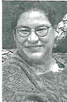
LENIA BATRES MINISTRA DE LA SCJN