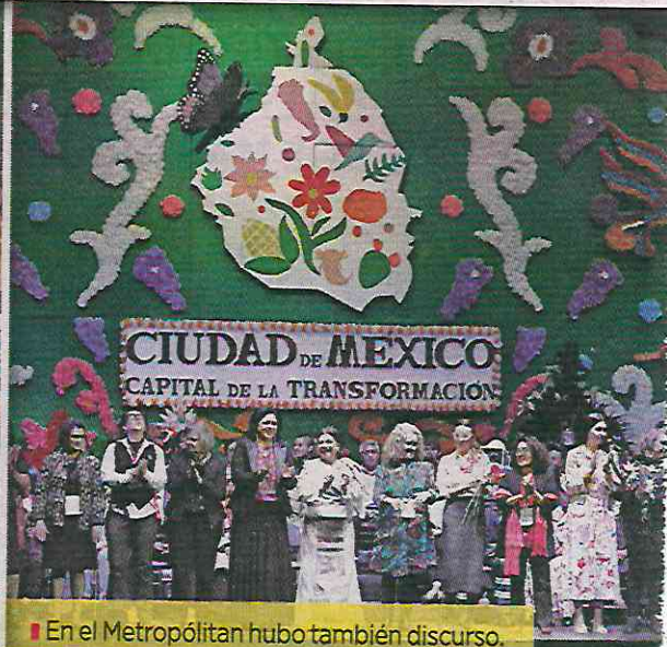
En el Metropolitano hubo también discurso.