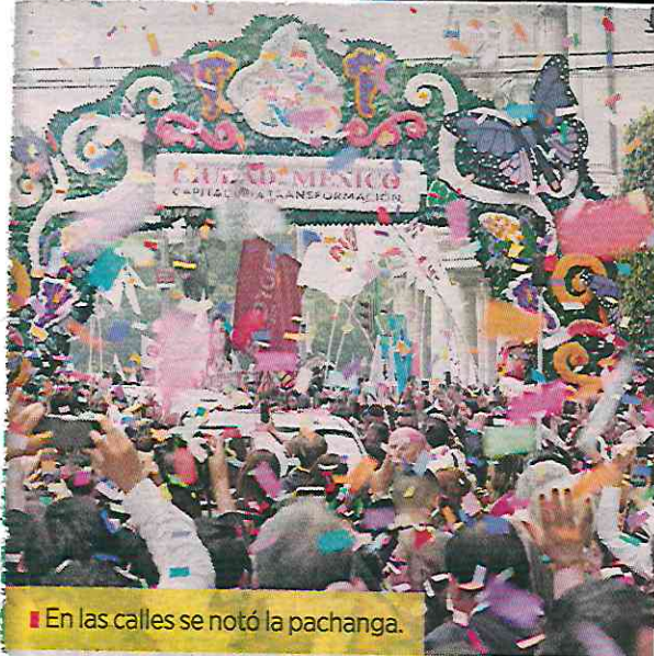
En las calles se notó la pachanga.