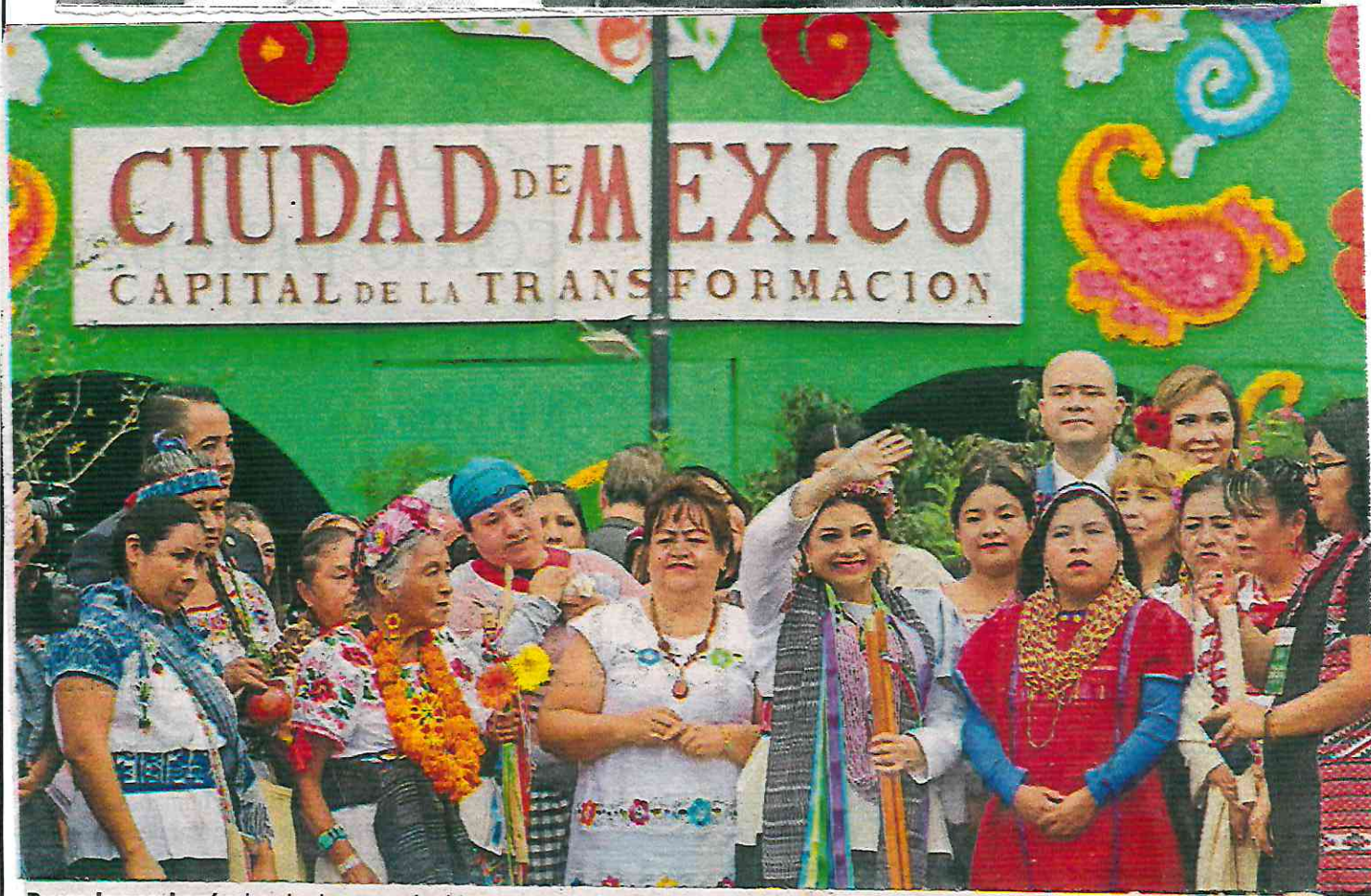
Brugada encabezó a bordo de un carrito la caravana de la capital de la transformación que inició en Eje Central y llegó al Zócalo

Al asumir como jefa de Gobierno de la Ciudad de México, Clara Brugada prometió acciones para los primeros 100 días de su gobierno: licitar cinco nuevas rutas de Cablebús, crear la línea H20 para reportar fugas de agua e iniciar la transformación de Calzada de Tlalpan, que tendrá un segundo piso verde, peatonal y ciclista sobre la línea 2 del Metro. Pág. 16 y 17