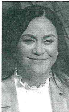
ARIADNA MONTIEL SECRETARIA DE BIENESTAR