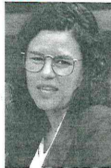
LUISA MARÍA ALCALDE PRESIDENTA DE MORENA