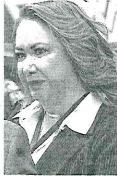
YASMÍN ESQUIVEL MINISTRA DE LA SCJN