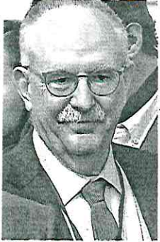
JULIO BERDEGUÉ SECRETARIO DE AGRICULTURA Y DESARROLLO RURAL