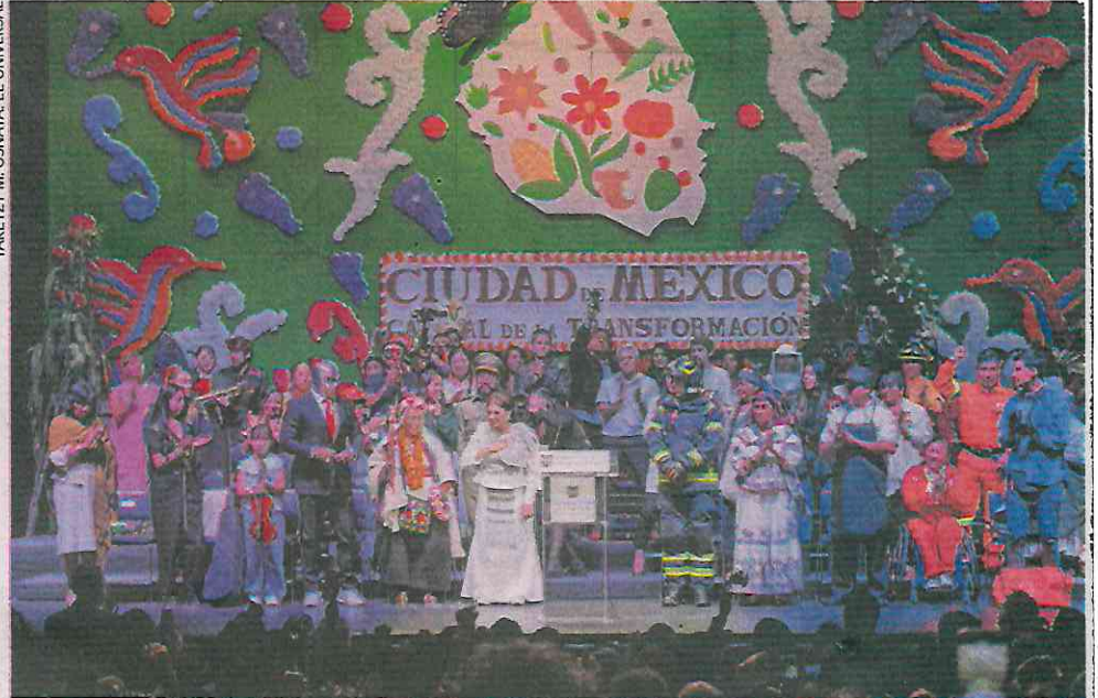
En el escenario del Teatro Metropolitano, la mandataria capitalina estuvo acompañada por personas que desempeñan diversos oficios en la Ciudad.

lebración, con quienes se comprometió a trabajar coordinadamente, por el bien de la ciudadanía.