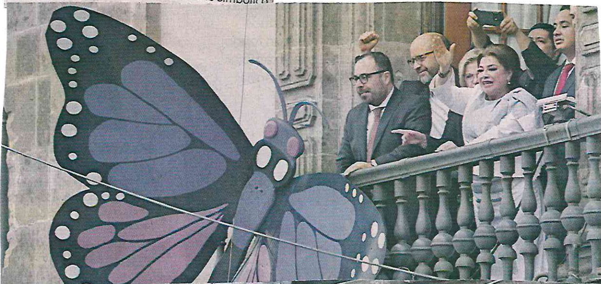
El último momento de la jornada de posesión fue desde uno de los balcones del Antiguo Palacio del Ayuntamiento.