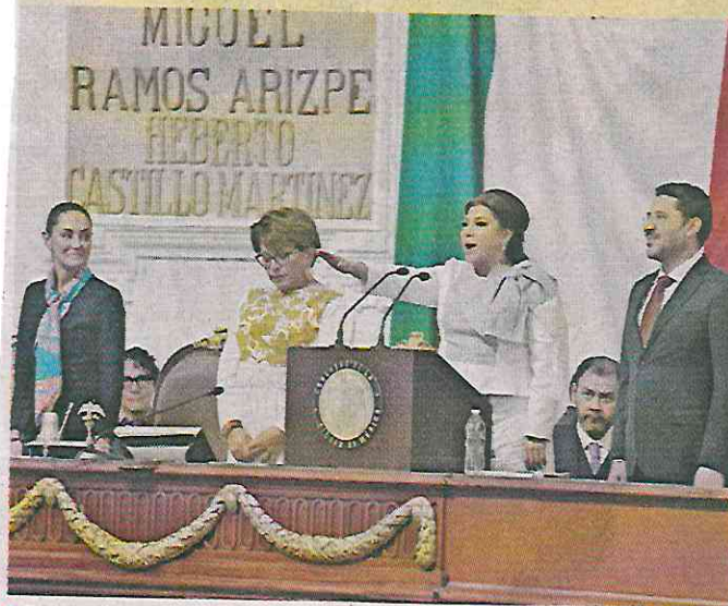
Brugada estuvo acompañada por la Presidenta Claudia Sheinbaum y el ex Jefe de Gobierno, Martí Batres.

“Propondré a las alcaldías la sustitución los vehículos de recolección de residuos de limpia; para ello, vamos a crear un fondo de miles millones de pesos (...) para cambiar los vehículos que están fuera de la norma”.