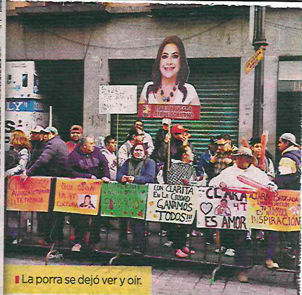
La porra se dejó ver y oír.