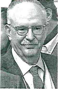
JULIO BERDEGUÉ SECRETARIO DE AGRICULTURA Y DESARROLLO RURAL