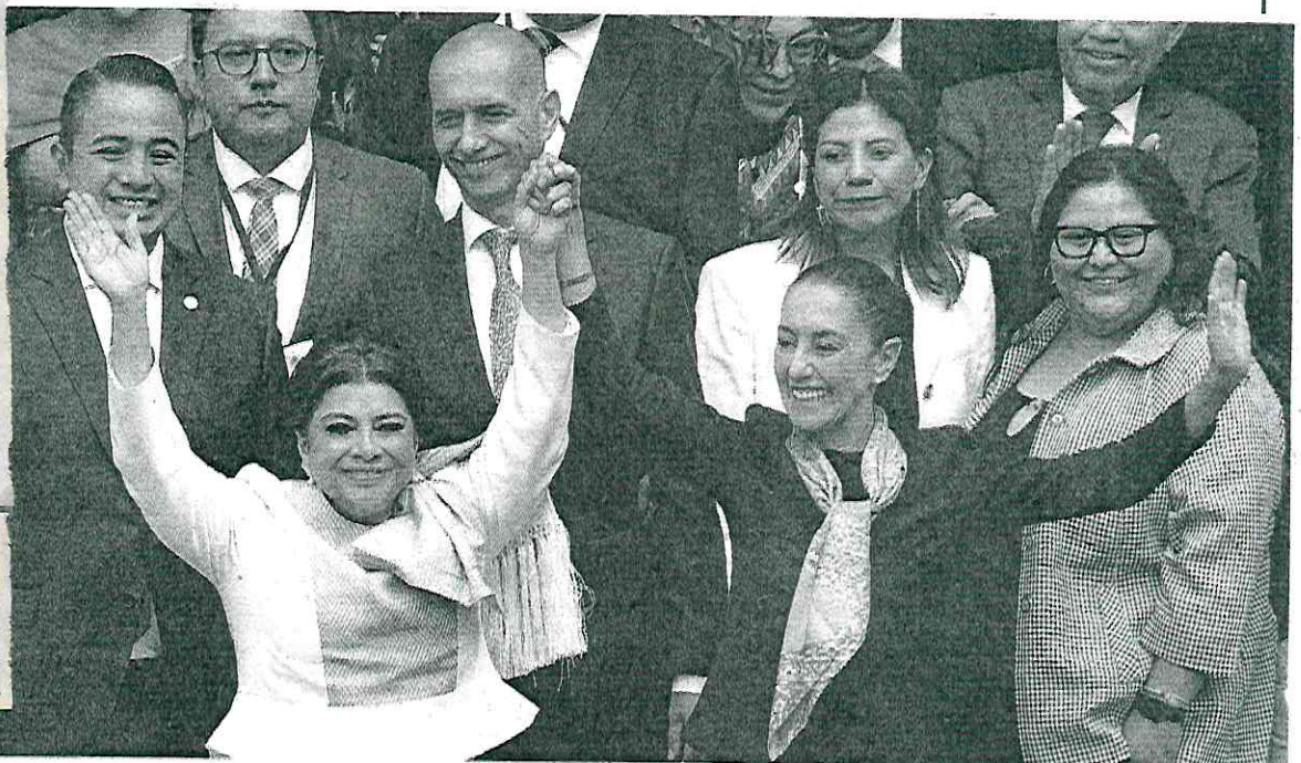
Tras rendir protesta en el pleno, Clara Brugada salió a las escalinatas del Congreso de la Ciudad de México acompañada por la Presidenta, Claudia Sheinbaum.