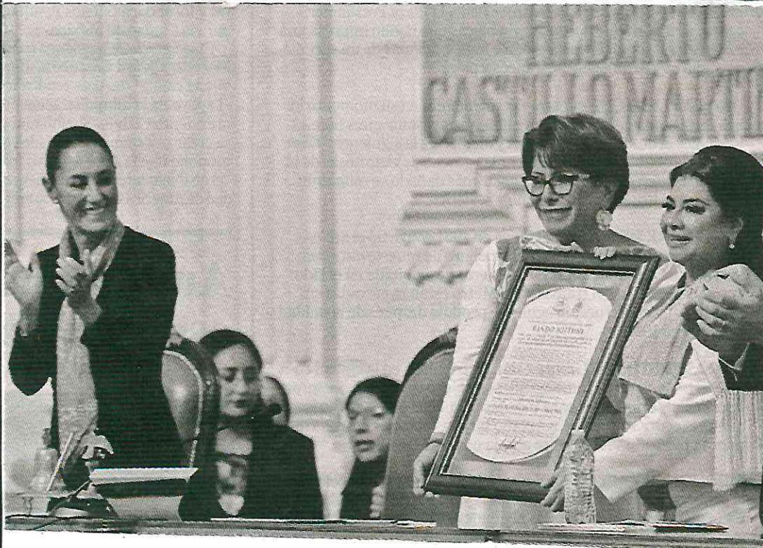
► Con la presencia de la presidenta Claudia Sheinbaum, la nueva jefa de Gobierno rindió protesta en el Congreso local, donde planteó un panorama de los servicios que se mejorarán para la capital.