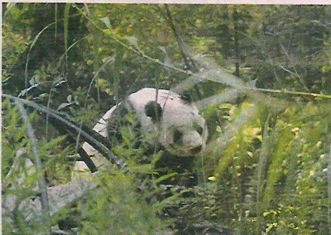
La panda "Xin Xin", de 34 años, es el ejemplar más visitado en el Zoológico de Chapultepec.