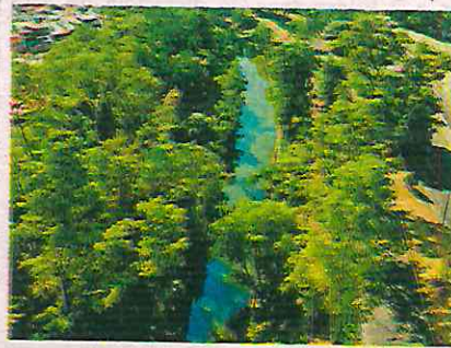
Canal Nacional , único por su biodiversidad e historia

Cabe destacar que Canal Nacional fue declarada Área de Valor Ambiental de la Ciudad de México en el año 2022, cuenta con una extensión de 32.32 hectáreas y está ubicada en las alcaldías de Coyoacán, Iztapalapa y Xochimilco. Es de relevancia ambiental como bosque de galería y zona lacustre, así como por los servicios ambientales que genera como zona de amortiguamiento, corredor biológico, reservorio de biodiversidad y refugio de aves tanto migratorias como residentes.