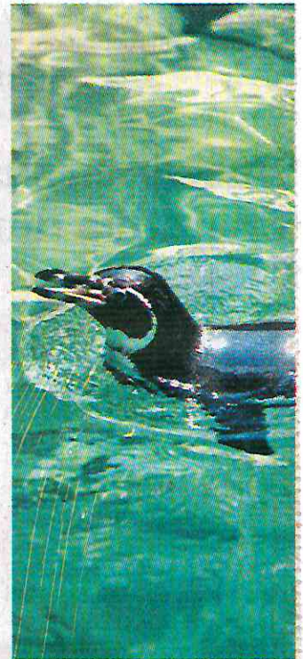
Pingüinos de Humboldt llegaron a la ciudad en mayo pasado, procedentes de Japón.

El Zoológico de Chapultepec abre de martes a domingo, así como días festivos, de 09:00 a 17:00 horas.