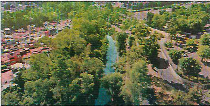
▲ El proyecto de diseño de paisaje y desarrollo sustentable obtuvo el DNA Paris Design Awards 2024, informó el Gobierno de la Ciudad de México. REDACCIÓN / P 25