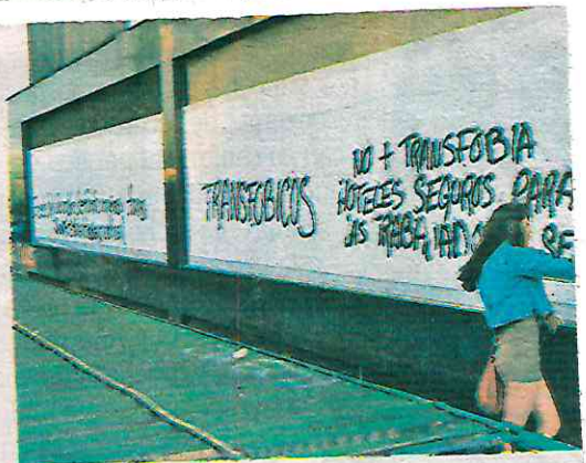
Las manifestantes piden reparación de los daños por hechos discriminatorios y transfobicos