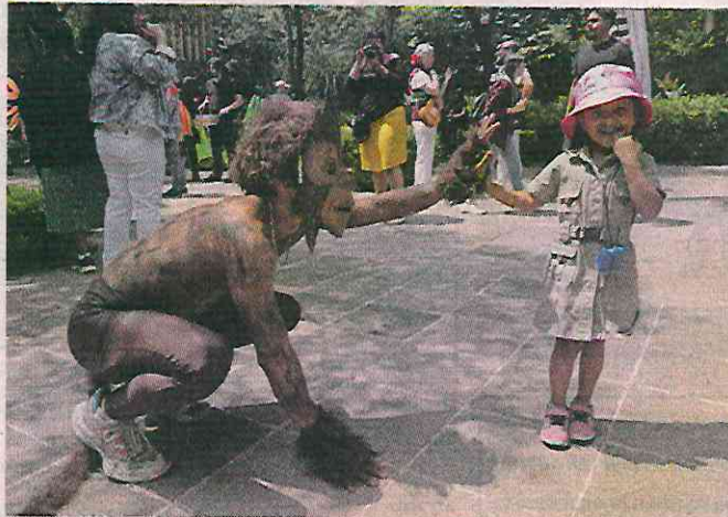
Los bailarines acudieron caracterizados de animales y visitantes aprovecharon para saludarlos y tomarse selfis.

"Xin Xin" es el ejemplar más visitado en el Zoológico de Chapultepec, cumplió 34 años el 1 de julio y, de acuerdo con sus cuidadores, sale al sol y su jardín de las 9:00 a las 12:00 horas y, por la tarde, permanece en habitaciones bajo la sombra, fuera del sol y de la lluvia, a la vista de