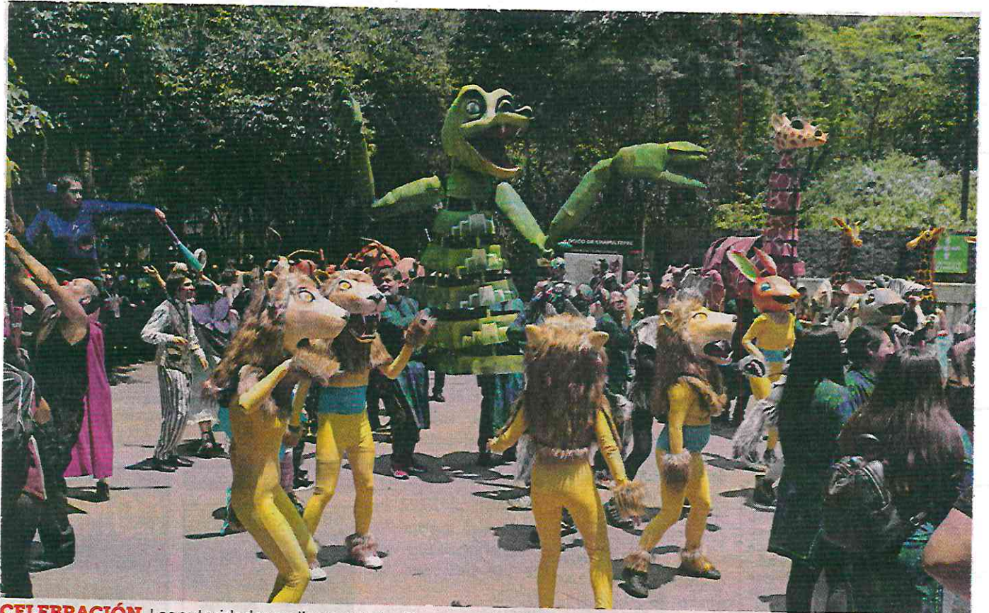
CELEBRACIÓN. Las autoridades realizaron un desfile, con motivo del 101 aniversario del Zoológico de Chapultepec.