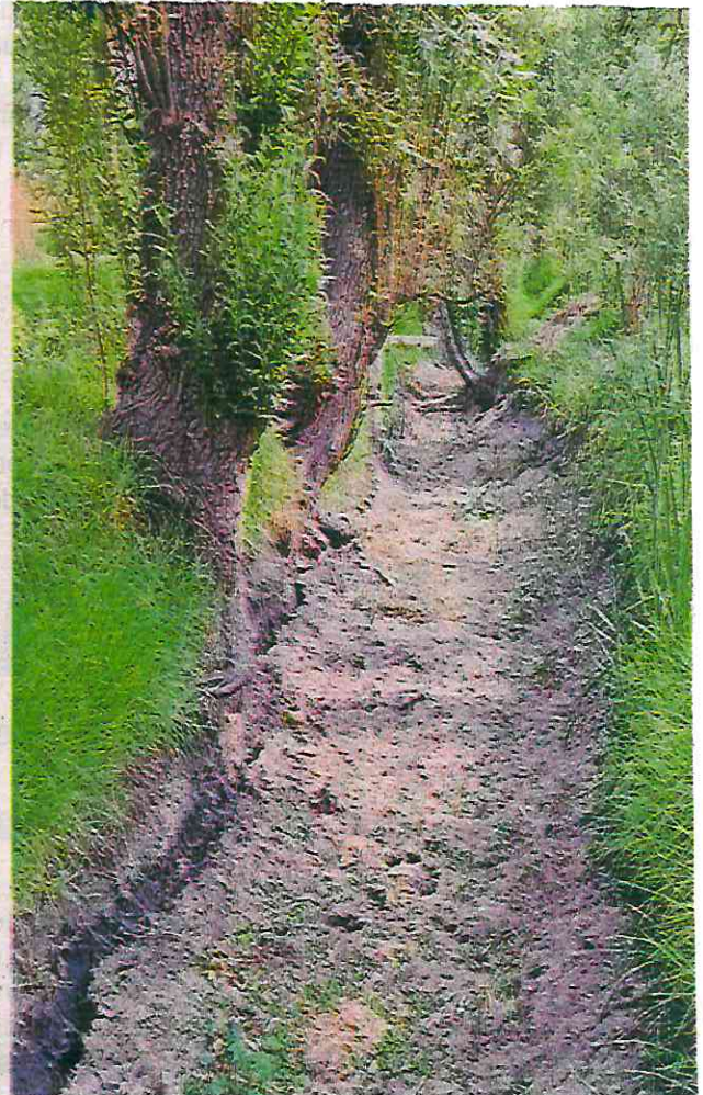
Los canales y zanjas de la zona chinampera del pueblo de San Gregorio Atlapulco lucen secos desde hace meses