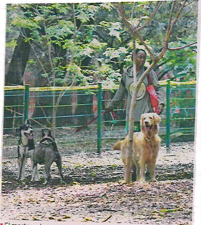
■ El martes, el parque canino del Jardín Gandhi fue cerrado por orden del Tribunal de Justicia Administrativa.

Los dueños suelen recoger los desechos, en tanto los paseadores los abandonan, un problema que puede resolverse con el registro en el que deberán inscribirse, para portar una credencial que los acredite como personal especializado en atender a los perros.