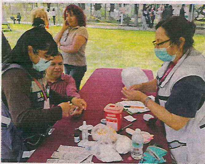
■ De acuerdo con comerciantes, hace falta que las autoridades den difusión del Centro de Salud en la Ceda.

“En este primer año de operaciones, el Centro de Salud ha realizado 3 mil 129 consultas médicas, 803 consultas psicológicas, 2 mil 432 detecciones, se han aplicado mil 100 vacunas en la modalidad de recorrido por pasillo, además de la organización de 26 jornadas de salud desde el inicio del registro el 7 de septiembre de 2023”, apuntó la coordinadora.