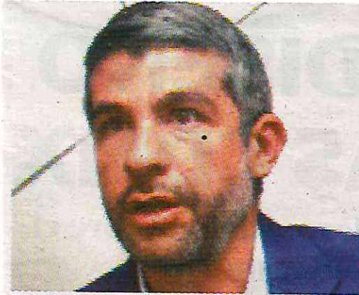
Acusa al Congreso de la Ciudad de México