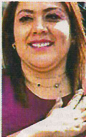
Ha sido omisa en esta acción

En este año, la Alcaldía Tláhuac destinó 7.2 millones de pesos para ser entregados a 150 beneficiarios, que recibieron 8 mil pesos al mes durante agosto y diciembre. En ese periodo fueron detectados hasta 257 pagos a presuntos beneficiarios por