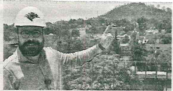
Una alcaldía transformada

En lo referente a la gestión de las escuelas públicas, el alcalde informó que “han sido nuestras prioridades, hemos invertido más de trescientos cincuenta millones de pesos en los más de cuatrocientos noventa y cinco planteles que tiene nuestra demarcación”. “Vamos a sumar a nuestro parque vehicular cinco nuevas moto ambulancias para disminuir el tiempo de respuesta ante una emergencia y entregaremos kits del programa Auxilio Escolar a 140 escuelas