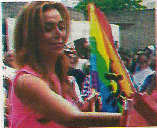
Es lideresa de vendedores ambulantes