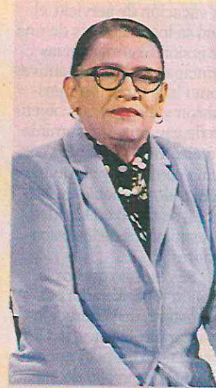
Rosa Icela Rodríguez será Secretaria de Gobernación.

“Estamos muy agradecidos con la doctora por esta designación y lo que les puedo decir es que vamos a trabajar con diálogo, con mucha civilidad, con mucho respeto; con la población, con los diferentes sectores, tanto con los empresarios; con los gobernadores, con los diputados, senadores; con los grupos sociales, también, por supuesto