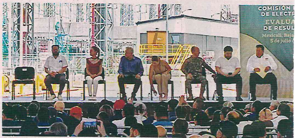
■ Claudia Sheinbaum acompañó al Presidente López Obrador a la evaluación de resultados de la generación eléctrica en la Central de Ciclo Combinado de "Mexicali Oriente".

El Presidente AMLO lanzó ayer una bola fantasma a la próxima Presidenta Claudia Sheinbaum: '(Ella) No va a subir, en términos reales, el precio de la luz en el País'