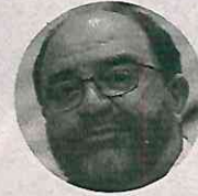
EMILIO ÁLVAREZ ICAZA Senador

“Queremos hacer un ejercicio desde afuera hacia abajo, no queremos centralizar todo en la Ciudad de México, tomaremos la decisión consultando a la ciudadanía”