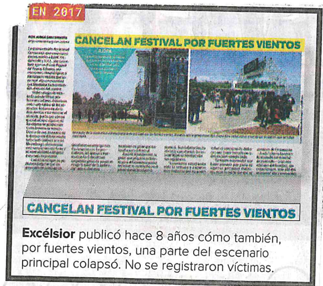
Excélsior publicó hace 8 años cómo también, por fuertes vientos, una parte del escenario principal colapsó. No se registraron víctimas.

— Con información de Jonás López y Jorge Emilio Sánchez