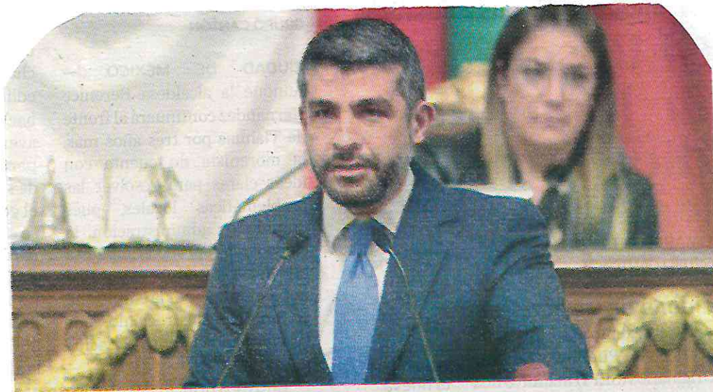
El panista reunió más de 3 mmdp gracias al cobro de cuotas a comerciantes

Asimismo, durante el año pasado, restauranteros denunciaron el cobro de hasta 200 mil pesos para que los colaboradores de Tabe los dejaran operar como centros nocturnos. Entre octubre de 2021 y julio del año pasado, se informó sobre el ingreso de más de 3 mil millones de pesos gracias al cobro de cuotas a comerciantes. No obstante, esta cantidad no fue reportada por la alcaldía.