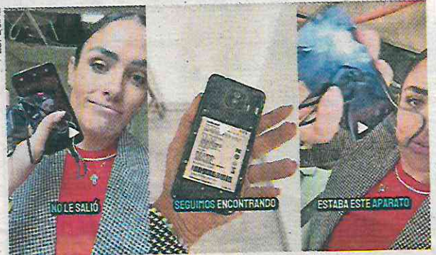
La alcaldesa denunció en redes que falló un contacto, lo mandó arreglar y encontró los aparatos.