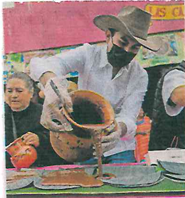
En el inicio de la feria se realizó una enchilada de mole de 80 metros.