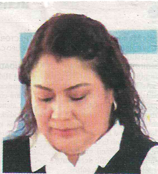
El 67.2 % de la población reprobó a la alcaldesa