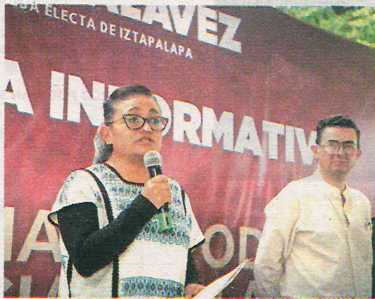
La alcaldesa dio a conocer a su equipo de trabajo en redes sociales

A pesar de no encontrarse en un proceso electoral, lo hecho por la nueva edil de Iztapalapa viola la Constitución mexicana, pues esta prohíbe que las dependencias de gobierno promocionen a algún