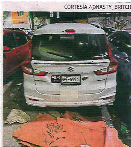
Karla fue agredida en su vehículo