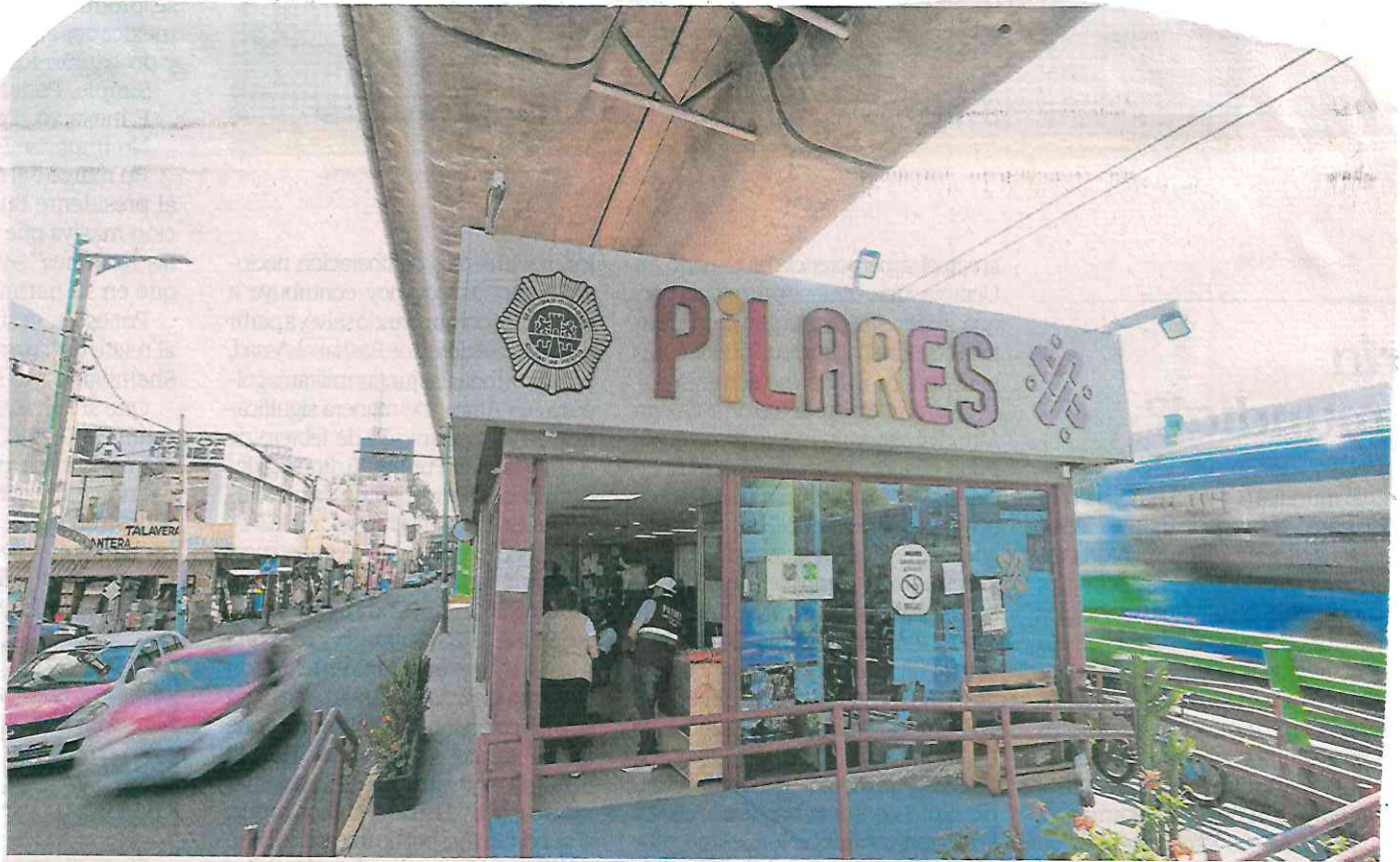
En Ermita Iztaapalapa se ubica uno de los módulos de la policía capitalina que fue convertido en una unidad Pilares.