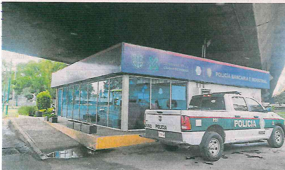
En el bajopunte de Circuito Interior e Insurgentes Norte, el módulo policial se convirtió en una oficina administrativa de la Policía Bancaria e Industrial (PBI).