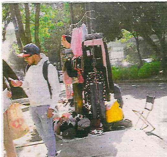
Sostienen que la proliferación descontrolada del comercio irregular en la vía pública ha puesto en jaque a los comerciantes regularizados.

Consideró que la zona de hospitales, uno de los puntos más críticos, se ha convertido en un caos con la proliferación de franeleros y puestos ambulantes que operan sin control; los primeros llegan a cobrar hasta 20 pesos por metro cuadrado de vía pública, y 40 pesos por permitir a los familiares de los pacientes dormir en la calle y, según testimonios, esta actividad cuenta con la anuencia de los patrulleros locales.