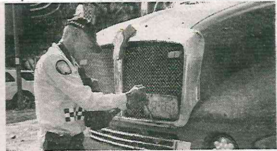
Tienen 72 horas para ser retirados

El operativo de retiro de vehículos ha sido clave en su estrategia de seguridad, que no solo implica más patrullas y elemen-