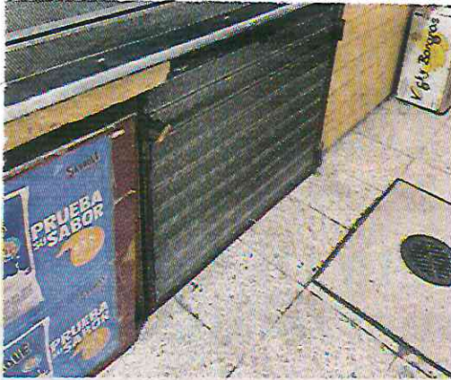
La clientela se mantiene en niveles bajos