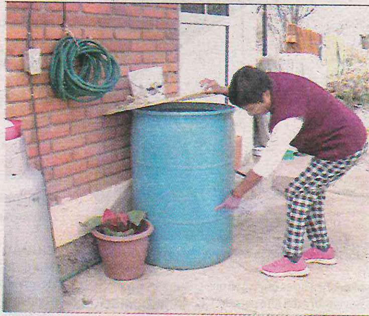
La escasez ha rebasado la economía de las familias

“Cómo le hacen a la jalada, si de por sí no ha habido agua; ya varios sabemos que los delegados hacen tratos con otros delegados y venden el agua, se llevan las pipas a otros lados, y por eso, aquí nos tienen sin agua, cuando antes el pueblo no padecía de la escasez por su calidad”, refirieron los veci-