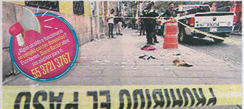
Los robos fueron los más cometidos con 413 mil en el último bimestre de 2024

Los delitos más cometidos en el que es considerado el corazón de la capital, fueron los robos, pues se abrieron mil 413 carpetas de investigación durante ese lapso, y espe-