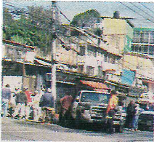
Más de 20 obreros para una banquetta