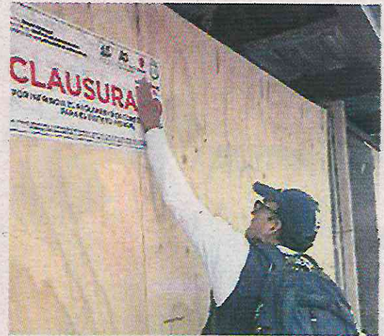
Quejas por violación flagrante del uso de suelo

Los colonos en Isidro Fabella acusaron a los habitantes del predio 19 en la calle Raveneses por realizar trabajos de ampliación en la parte frontal de un domicilio, todo esto sin los permisos correspondientes. Ante esta situación, la PAOT informó que estas quejas fueron ingresadas el 2 de enero, por lo que aún se encuentran en proceso de admisión, sin embargo, esta pro-