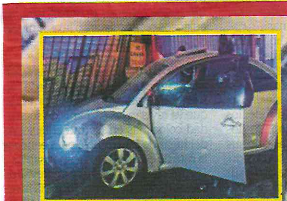
Lo dejaron muerto al volante de su auto.