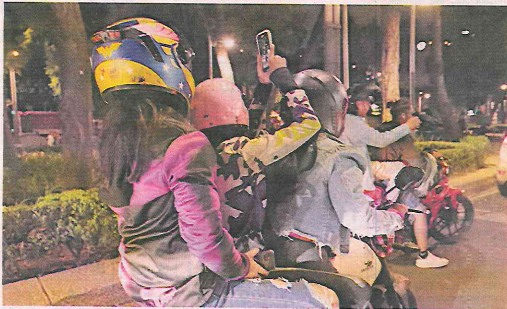
■ Algunas motocicletas llevaban hasta tres personas, poniendo en riesgo a los pasajeros