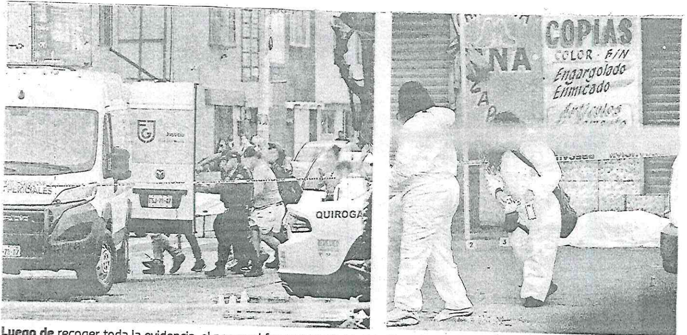
Luego de recoger toda la evidencia, el personal forense trasladó el cadáver de este hombre al anfiteatro de la FGJ de la Cdmx para continuar con las investigaciones

Por la forma en que fue cometido este hecho de violencia, los encargados de las investigaciones de la Fiscalía capitalina presumen que se trató de una agresión directa; sin embargo, será el avance de las indagatorias las que determinen los motivos reales por los que fueron agredidos a tiros.