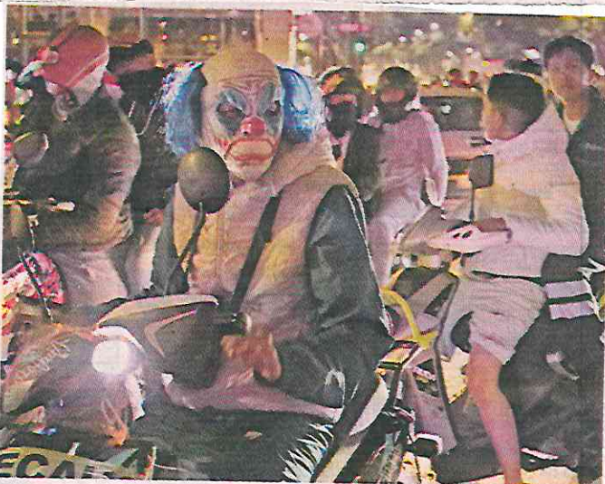
■ De acuerdo con el Reglamento de Tránsito, deben usar casco, pero algunos prefirieron usar máscaras.