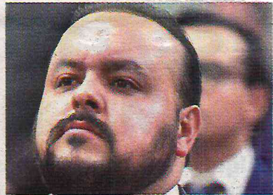
· En medio de transición

“Confiamos en que será un gabinete nuevo y no se reciclarán a funcionarios ineptos