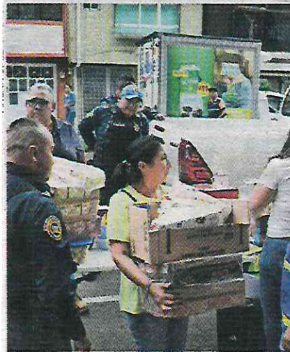
Buscan evitar que las calles de la Ciudad de México sean una cantina.

El funcionario señaló que la alcaldía retira —entre dos y tres— chelerías cada semana, por medio de operativos programados y ya suman 170 que fueron quitadas de la vía pública.