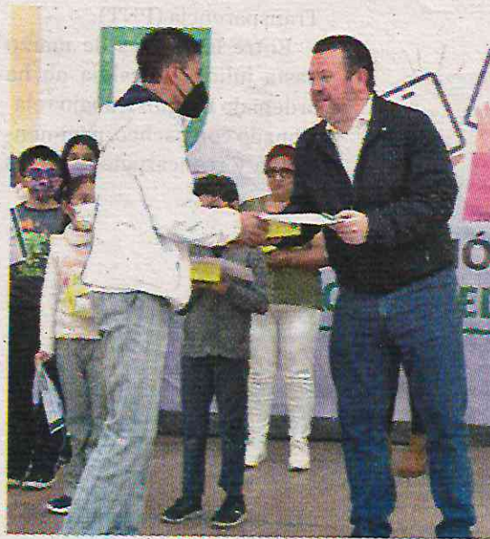
Irregularidades con el programa

La primera entrega de su administración la hizo a finales de 2022 en la que presumió la entrega de 2 mil 650 tabletas con un presupuesto de 4 millones 495 mil pesos. Este monto fue pagado al distribuidor Comercializadora PC & Hardware, S.A. de C.V. La Auditoría Superior de la Ciudad de México (ASCM) investigó este pro-