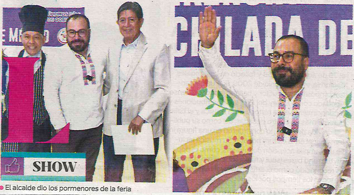
● El alcalde dio los pormenores de la feria