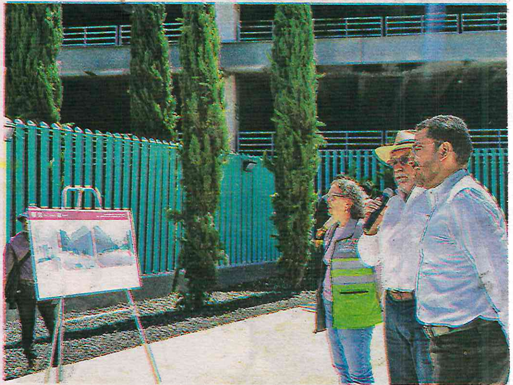
Los pozos San Martín Xochinahuac y Pantaco III, en Azcapotzalco, fueron inaugurados ayer por el jefe de Gobierno