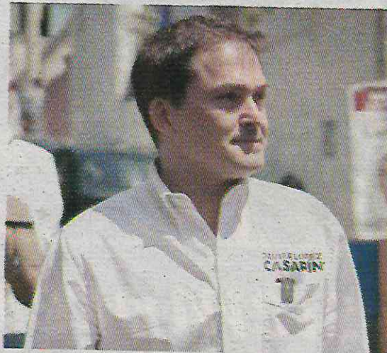
Tiene más experiencia como empresario