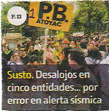
Susto. Desalojos en cinco entidades... por error en alerta sísmica