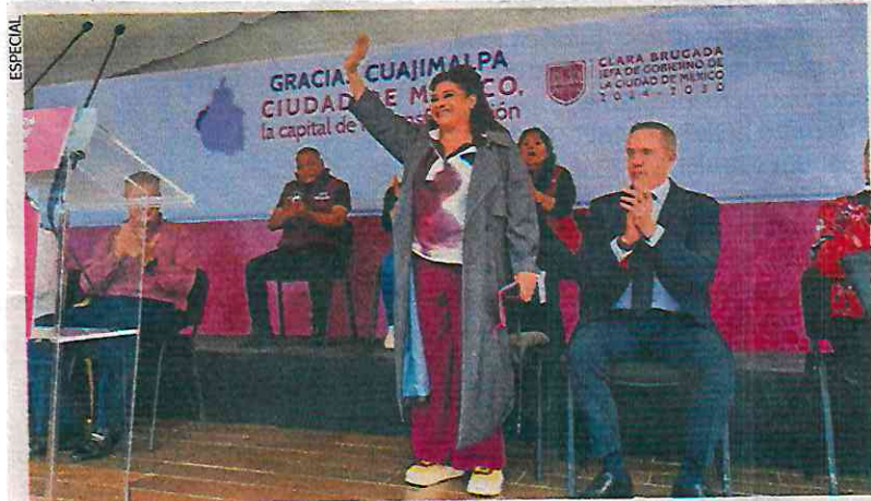
La jefa de Gobierno electa señaló que dará seguimiento a las peticiones de los pobladores de Cuajimalpa.

Más tarde, la jefa de Gobierno electa visitó la alcaldía Magdalena Contreras. ●