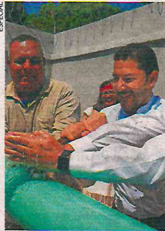
El jefe de Gobierno entregó los trabajos de reposición del pozo Pantaco III.

Agregó que sus compromisos los ha ido cumpliendo. “Vamos cumpliendo. Me reuní con el gabinete ampliado y a cada quien le di su tarjeta de pendientes, porque les dije que nos quedan dos meses, pero hagan de cuenta que es un mes, porque ya en septiembre vamos a andar muy presionados, entonces agosto va a estar muy movido, va a ser un mes de mucho trabajo”, concluyó. ●