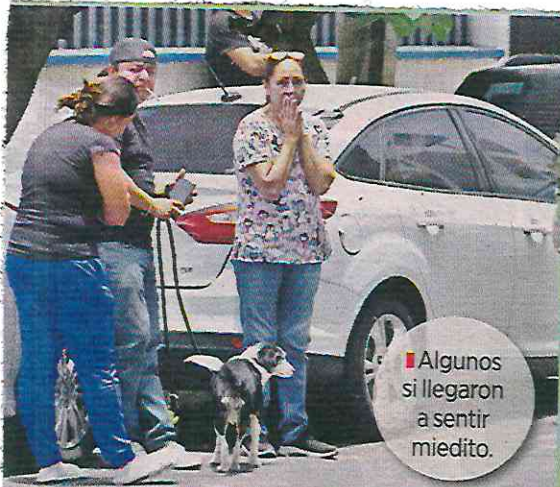
Algunos si llegaron a sentir miedito.