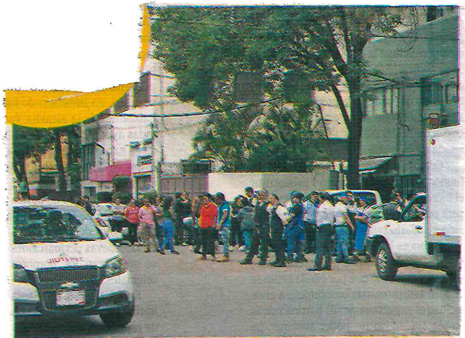
Salieron a las calles y avenidas de las 16 alcaldías para "ponerse a salvo", sin que se registrara algún movimiento telúrico

12:40 HORAS CON 41 SEGUNDOS se activó la alerta sísmica en la Ciudad de México